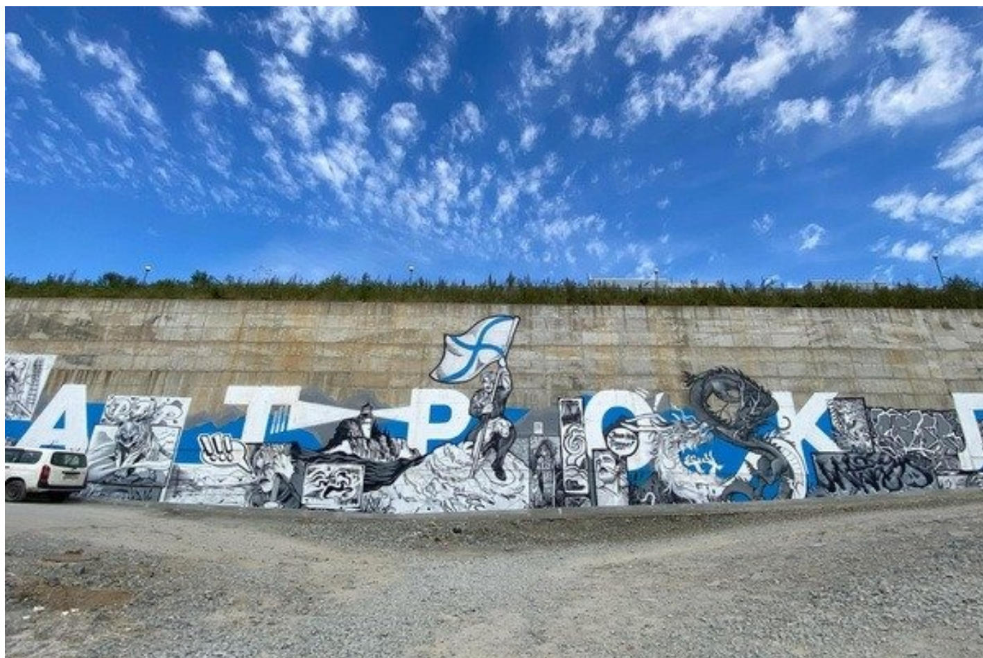
Строительство жилого района «Патрокл» во Владивостоке.