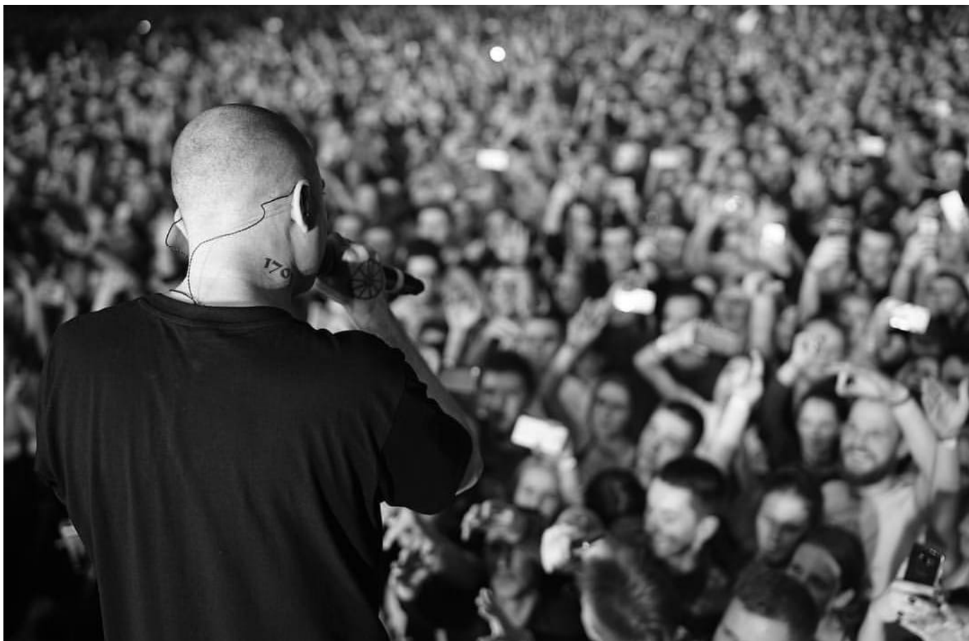
На концерте Оксимирона.

Новый привет СК и прокуратуре вышел вялым, но для оставшихся в России коллег у Окси нашлась пара ласковых — правда, таких же вялых: