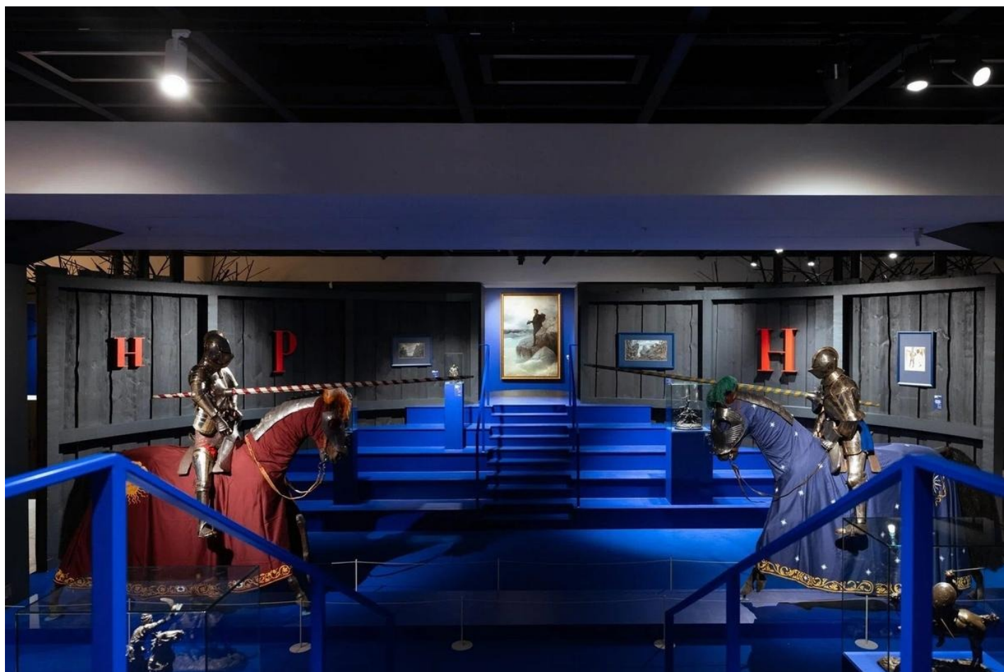
Выставка «Все Бенуа — Всё Бенуа» в «Манеже».