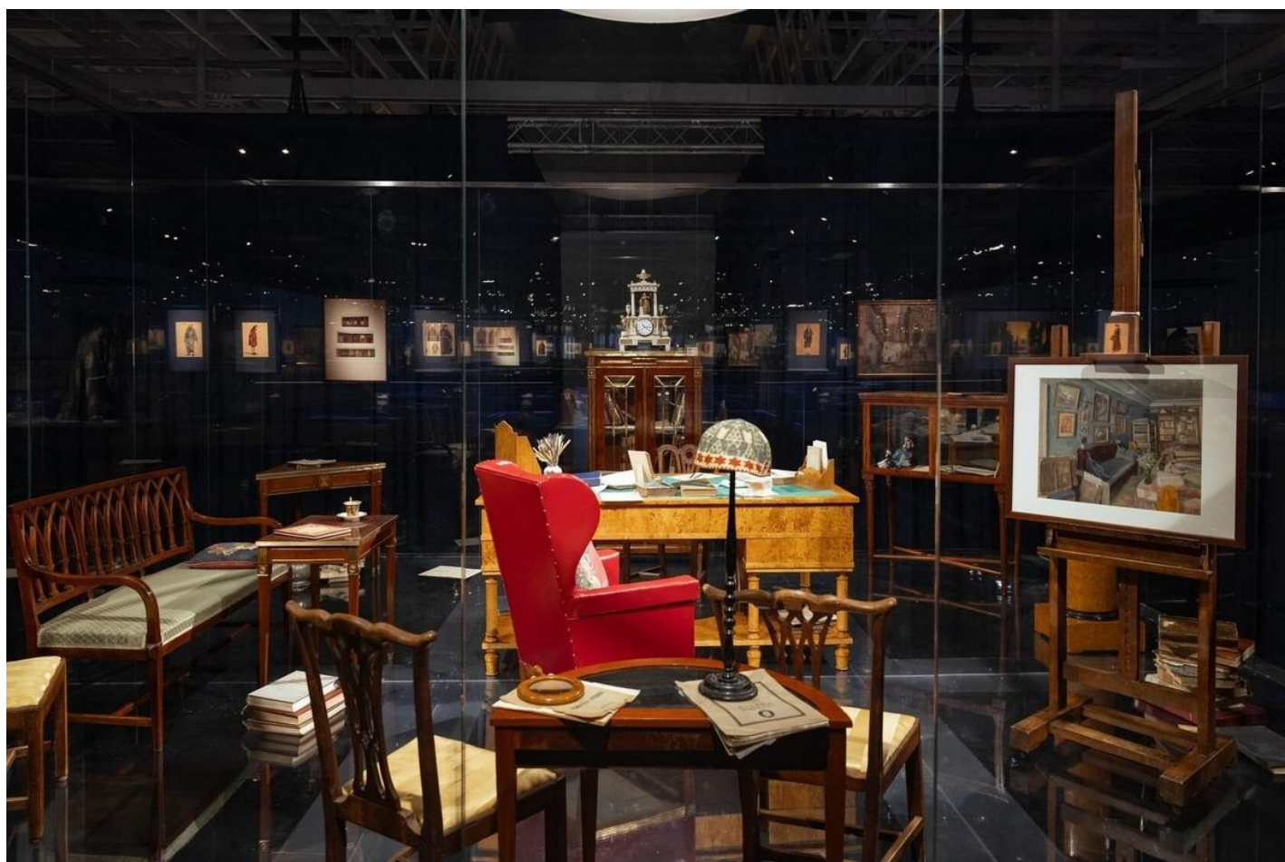
Выставка «Все Бенуа — Всё Бенуа» в «Манеже».

потом сам Александр, у него не было иного выбора, чем стать художником. Он начал рисовать еще в детском саду, а уже со школьных лет получал уроки академической живописи: занятия по рисованию в знаменитой гимназии Карла Мая, где он учился, вел Карл Вениг, мастер исторической живописи, преподаватель Академии художеств. Именно в гимназии Мая будущий художник подружился с теми, из кого позже сложилось известное общество «Мир искусства», — с Константином Сомовым, Вальтером Нувелем, Дмитрием Филосовым (двоюродным братом Сергея Дягилева), Львом (Леоном) Бакстом.