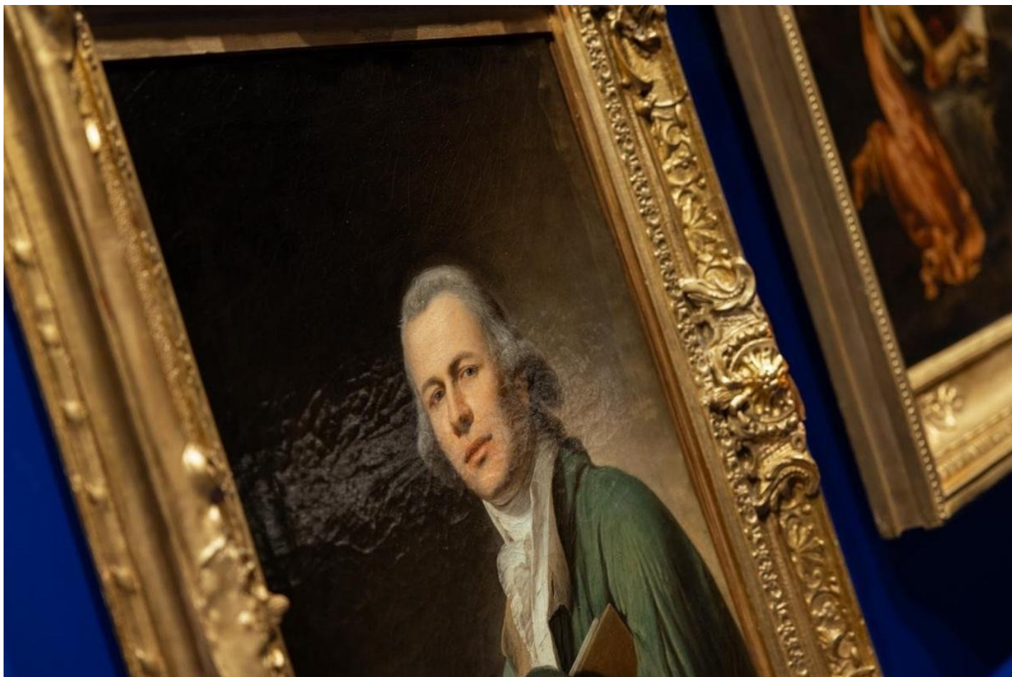
Выставка «Все Бенуа — Всё Бенуа» в «Манеже».

Францию коллекция распалась, потом часть предметов оказалась в Русском музее. На выставке в Манеже представлено около 50 игрушек из коллекции Бенуа, некоторые из них можно увидеть в его работах, в том числе в «Азбуке».