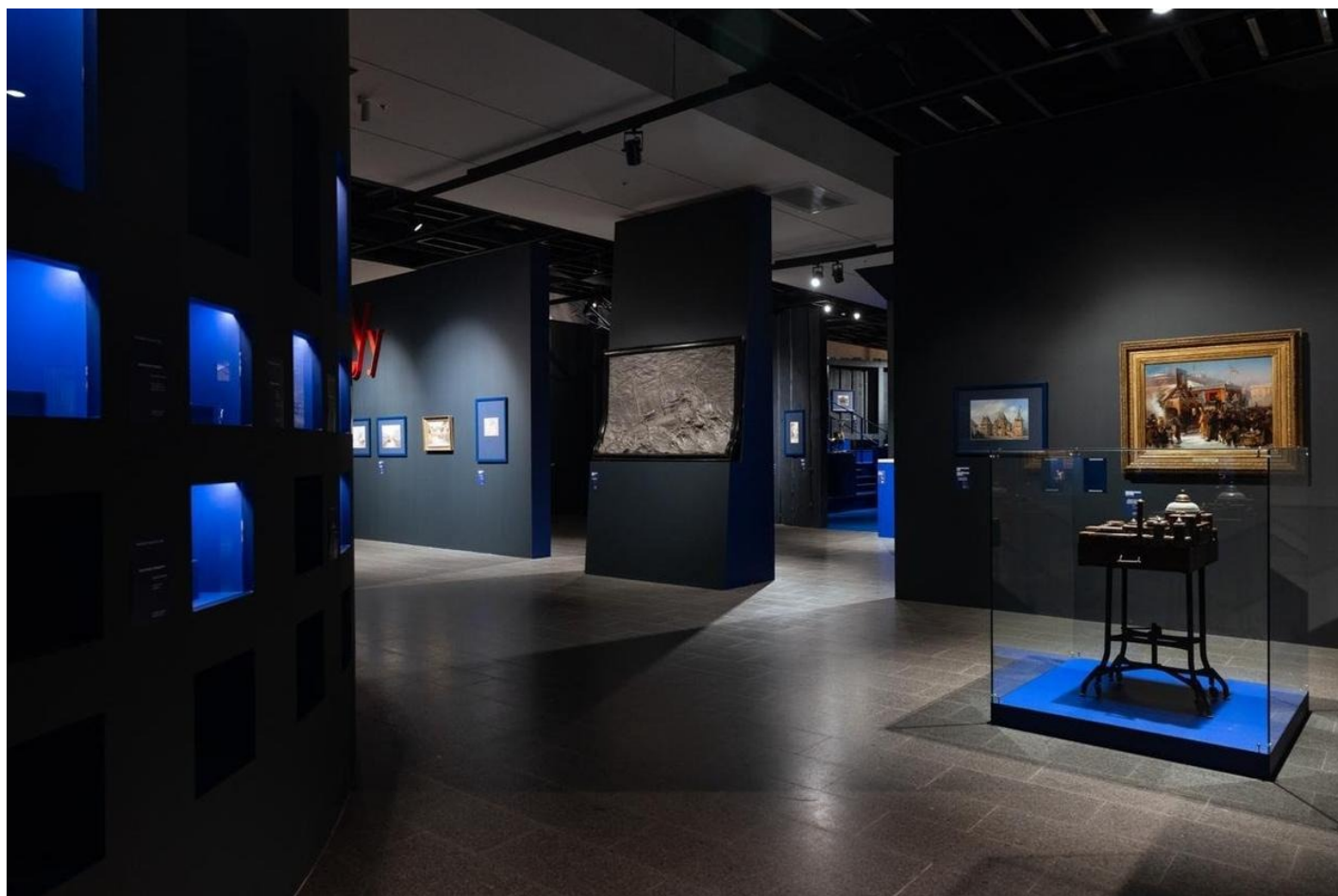
Выставка «Все Бенуа — Всё Бенуа» в «Манеже».

После Египта, в пространстве буквы З, появляются «Звезды», на которые можно полюбоваться, войдя в настоящий деревянный сарай. Это инсталляция «Сарай» Архбюро «Меганом»: крыша и стены испещрены отверстиями, и если смотреть на них изнутри при определенном освещении, возникает иллюзия звездного неба. Здесь можно увидеть театральные эскизы сына Александра Бенуа, Николая, а также работы Бенуа ди Стетто — еще одного племянника главного героя выставки.