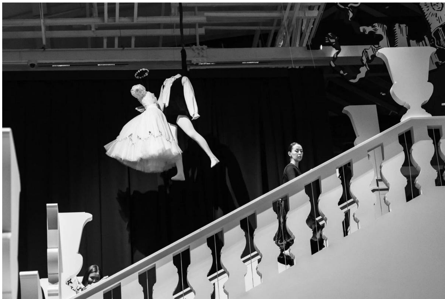
Выставка «Все Бенуа — Всё Бенуа» в «Манеже».

Входная зона отделена от основной экспозиции огромным театральным занавесом, зайдя за который, посетители сразу попадают в фойе театра, или аванзал. Здесь на громадном экране в режиме нон-стоп идет видеозапись балетов, поставленных Сергеем Дягилевым и оформленных Александром Бенуа: «Павильон Армиды», «Петрушка». Главные роли в этих балетах в свое время исполняли Вацлав Нижинский и Анна Павлова.