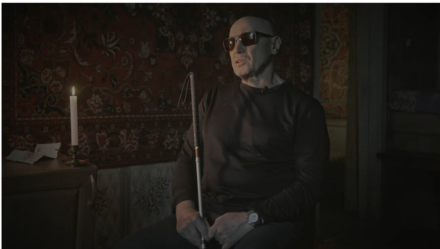
«Вернувшиеся». Кадр из фильма

«Вернувшиеся» Анны Артемьевой и Ивана Жилина