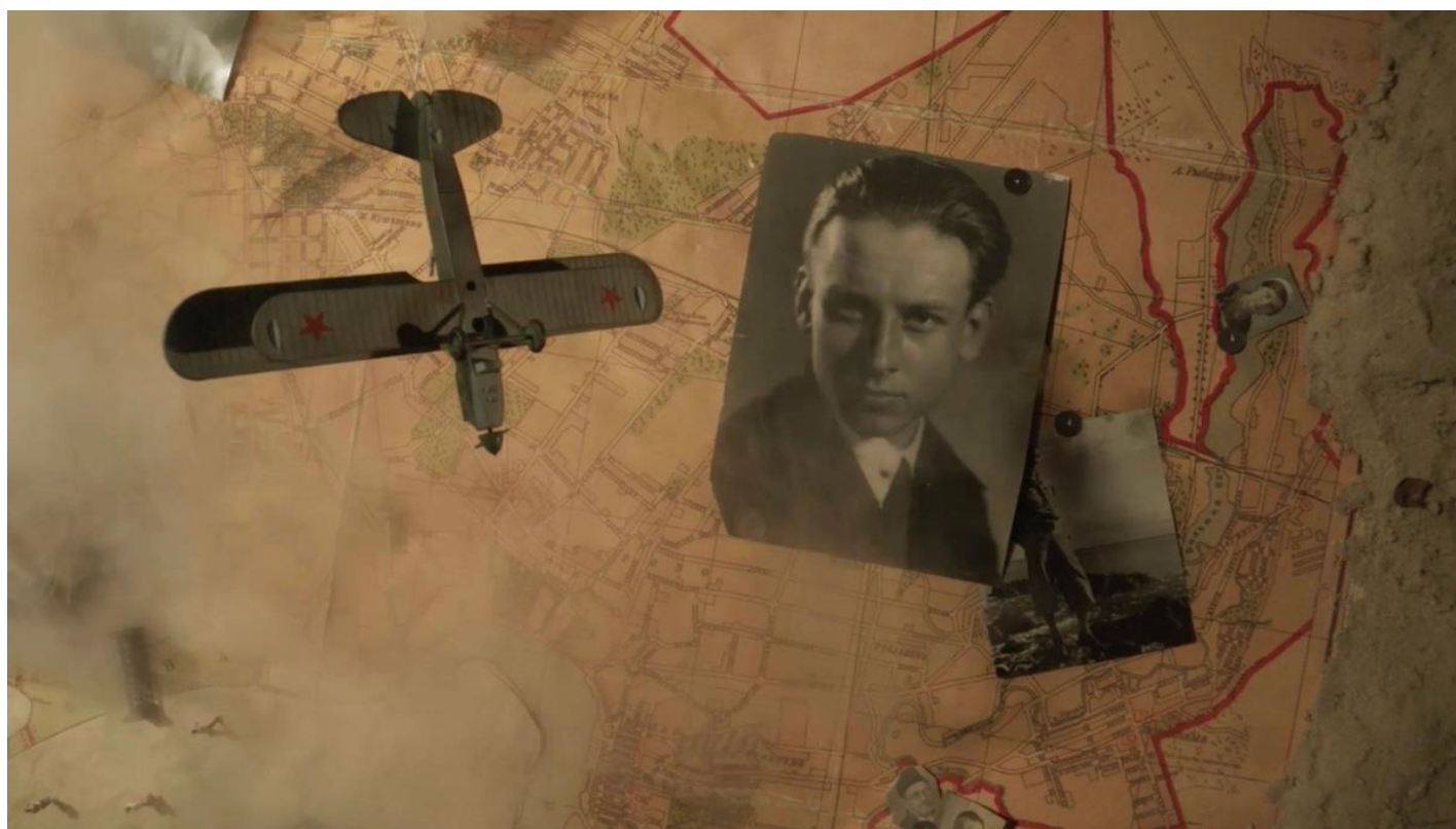
«Однажды в Ленинграде». Кадр из фильма

Удивительная история космического человека и режиссера Павла Клушанцева, создавшего космос на земле, «мастера русской фантастики» (как его окрестил оscarоносный постановщик спецэффектов Роберт Скотак). Говорят, о встрече с Клушанцевым просил сам Лукас, когда был в Москве, нарекая его крестным отцом «Звездных войн». Правда ли, нет, но он сам порой походил на пришельца.