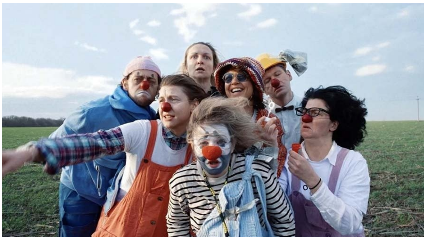
«Сказка про Жилабыла». Кадр из фильма

Группа «Доктор Клоун» колесит по пунктам временного размещения беженцев Ростовской области. Где клоуны и где беженцы? Где трагедия и где смех? Здесь и сейчас.