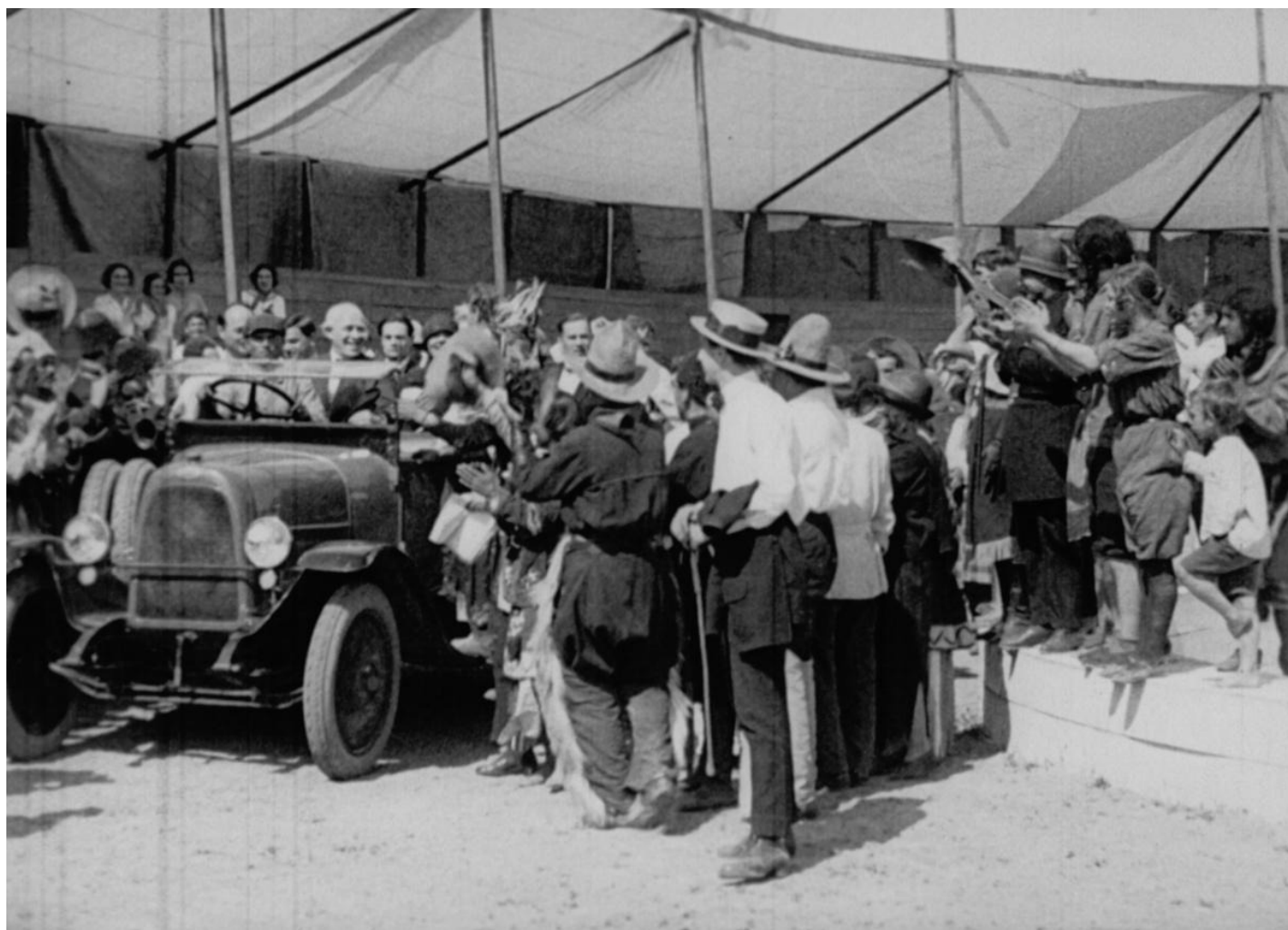
«Станиславский в новом свете» («К другому берегу»). Кадр из фильма

Зимним утром 1922 года из французского порта Шербур отплыл в Америку пароход с символическим названием «Мажестик». На его борту отправлялась в свои первые заокеанские гастроли труппа Московского Художественного театра во главе с К.С. Станиславским — в ту пору уже всемирно известным театральным режиссером и создателем знаменитой системы. Мало кто знает, что там, в США, великий реформатор сцены и написал нетленный труд «Моя жизнь в искусстве». Это фильм об историческом гастрольном туре, предпринятом ради спасения театра и его голодающих артистов, о событиях столетней давности, рифмующихся с сегодняшним днем.