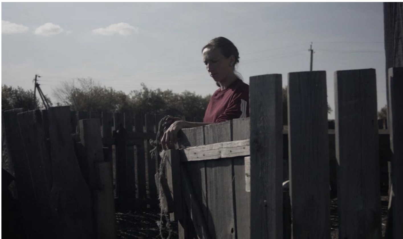
«Счаст». Кадр из фильма