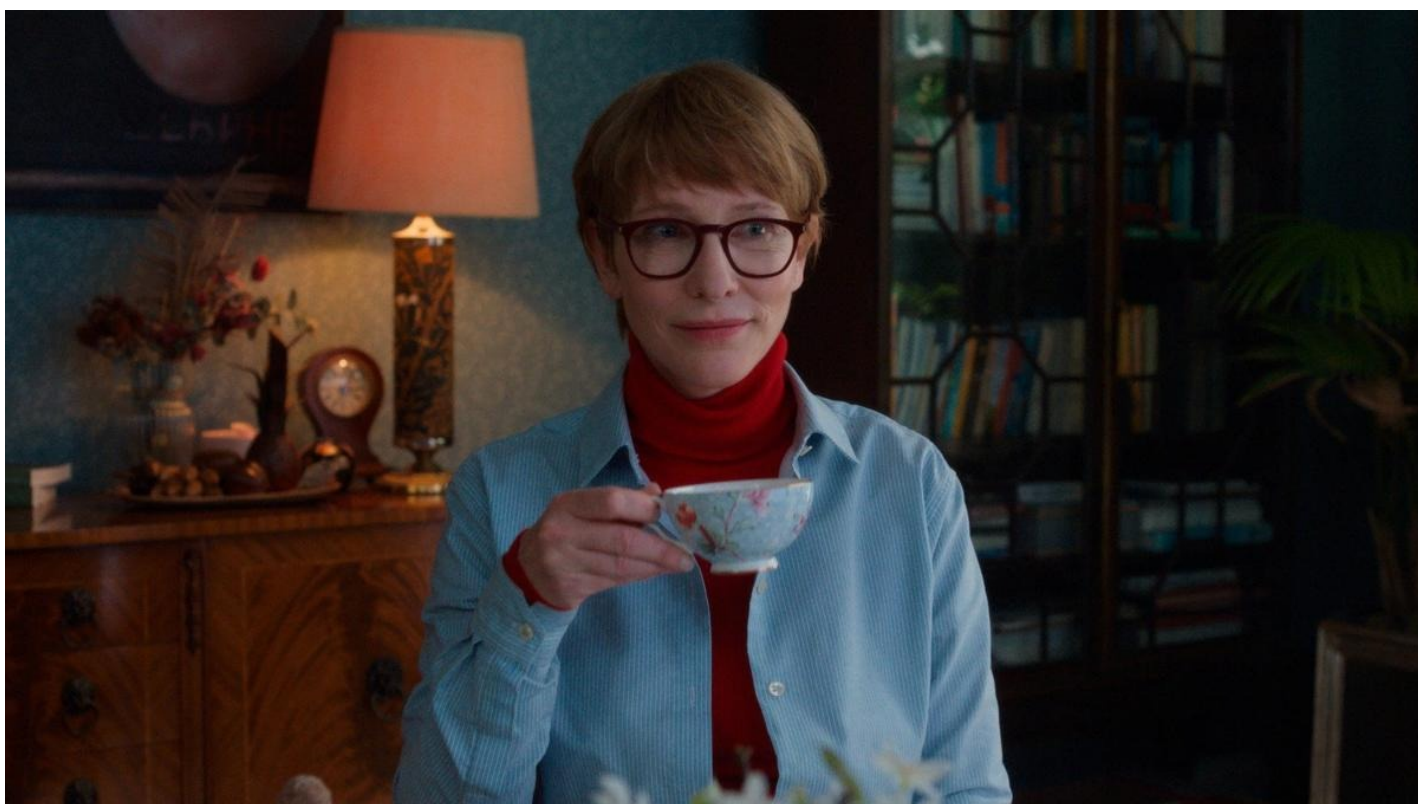
Кадр из фильма «Отец мать сестра брат»

С 1 января на экранах — фильм Джима Джармуша «Отец мать сестра брат», победитель Венецианского фестиваля — 2025