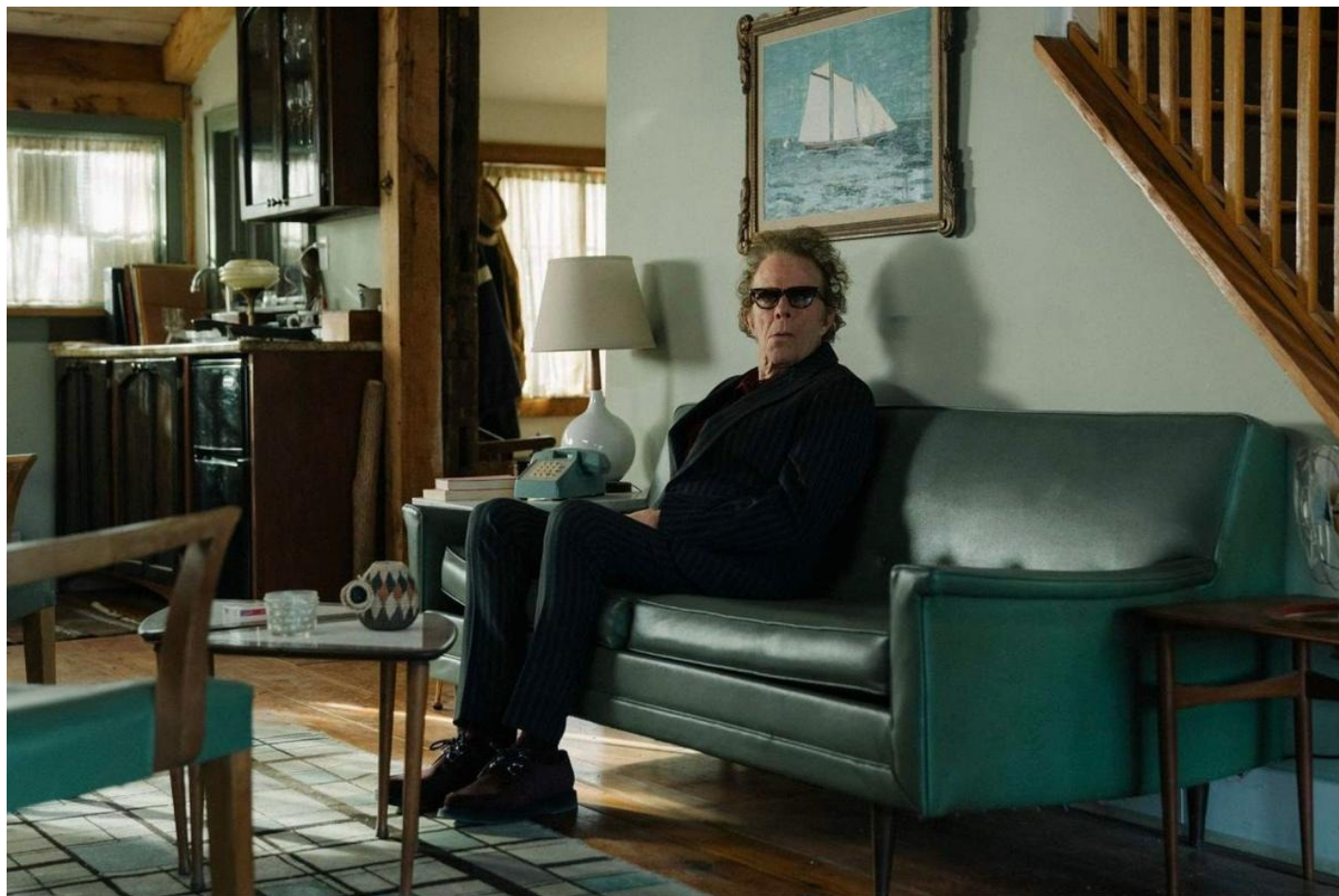
Кадр из фильма «Отец мать сестра брат»

навестить его впервые за долгое время. Они долго едут к нему в какую-то дыру по неровным дорогам, встречая по пути знаки «встречная полоса», «въезд запрещен» и обсуждая странного предка.