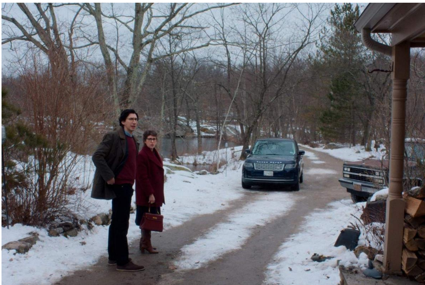
Кадр из фильма «Отец мать сестра брат»

А вокруг дома — роскошное великолепие: заснеженные деревья у кромки замерзшего озера, божественный свет, тишина, постоянство и покой. И какие-то временные людишки на краешке этой красоты все никак не прояснят отношения.