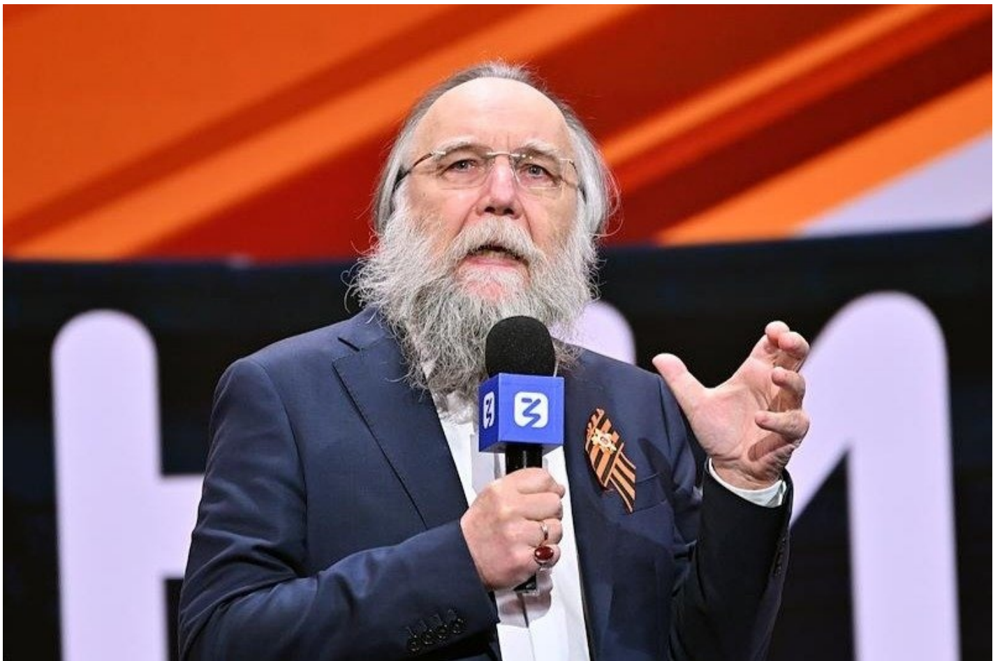
Александр Дугин.

Немало занимательного наговорил главный идеолог страны Александр Дугин.