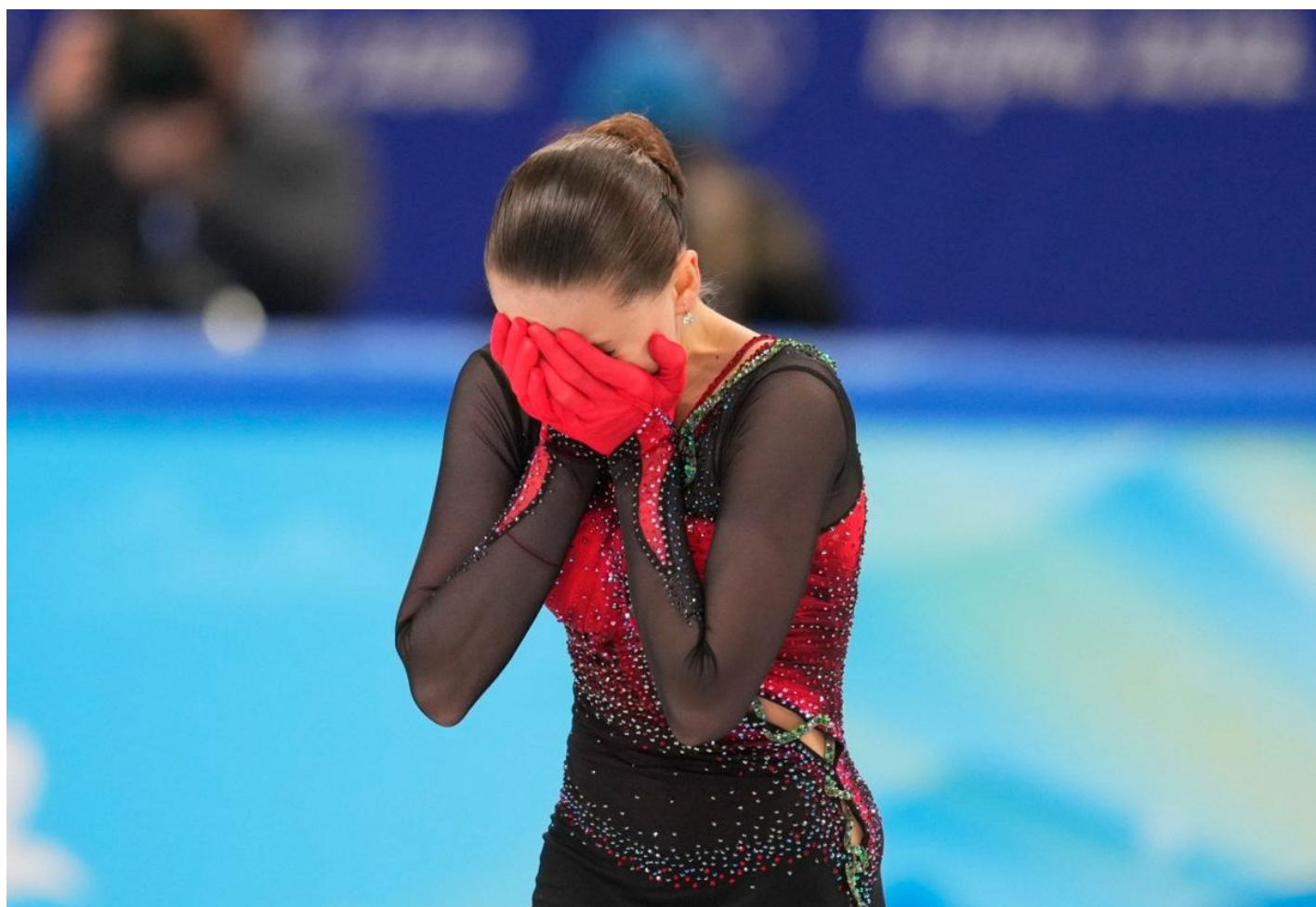
Камила Валиева после произвольной программы в Пекине.

версия с пирожным, которое «плохо» приготовил принимавший сердечный препарат старенький родственник) растянулось почти на два года. Так или иначе, но доказать отсутствие умысла в применении триметазидина не удалось. И 29 января 2024-го из Лозанны пришли грустные новости: спортсменка была окончательно признана виновной в нарушении антидопинговых правил и дисквалифицирована сроком на четыре года, начиная с 25 декабря 2021-го. Соревновательные достижения Валиевой с того момента были аннулированы со всеми вытекающими последствиями (включая лишение любых званий, наград, медалей, призов и выплат за выступления).