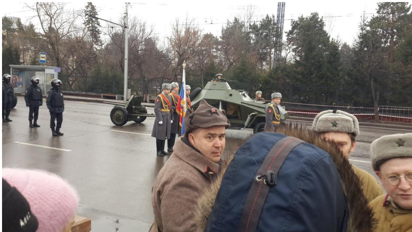
День народного единства, площадь Революции в Красноярске.

причинам. (Конечно, не в 41-м и 42-м.) Возвращали специалистов, думая уже о будущей жизни — после победы. Возвращали израненных. Возвращали тех, кому не место в армии.