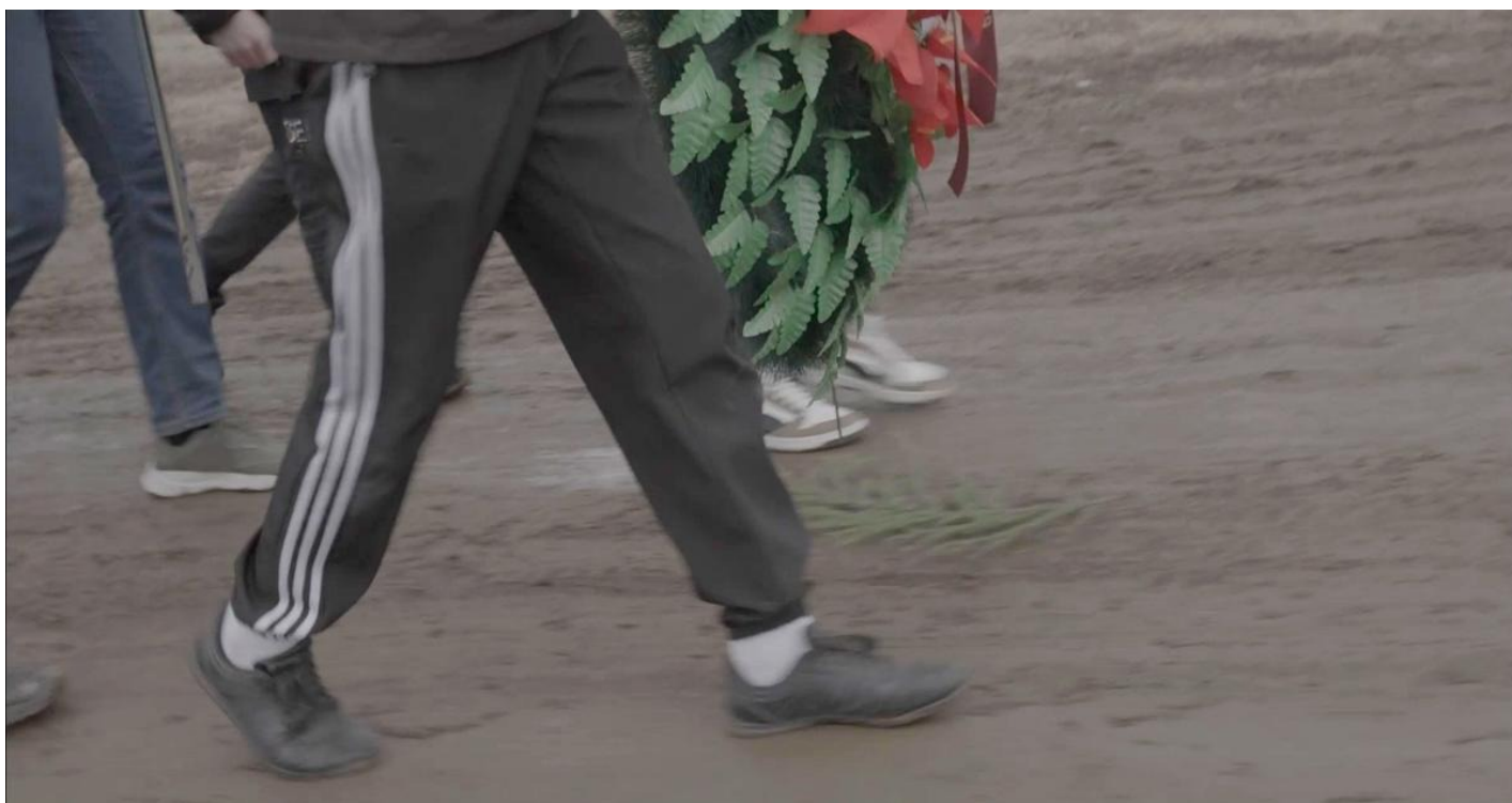
На похоронах солдата. Шагают юнармейцы. Россия, 2024.

И те, кто страдает, что нельзя произносить одно страшное слово, кто говорит, что ужасней его ничего нет, возможно, не знали или знать не хотели, как жила Россия предшествующие годы. Закрывали глаза. Говорили о чем угодно, только не об этом.