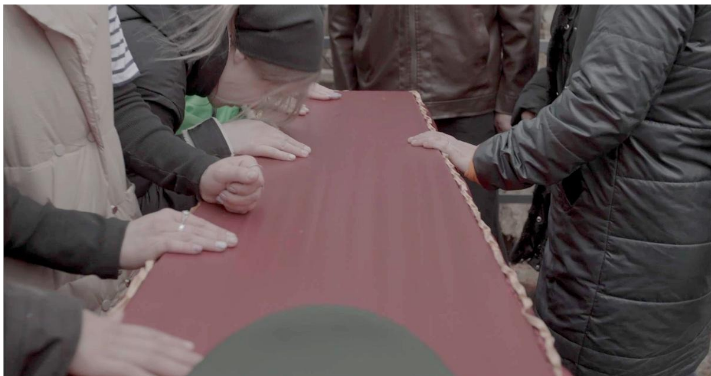
Прощание с солдатом, 2024, Россия.

для глухих деревень и городков на протяжении многих тысяч верст вглубь России все эти конфликты, включая СВО, в равной степени были далеки, и все они всегда черпали жизни прежде всего отсюда.