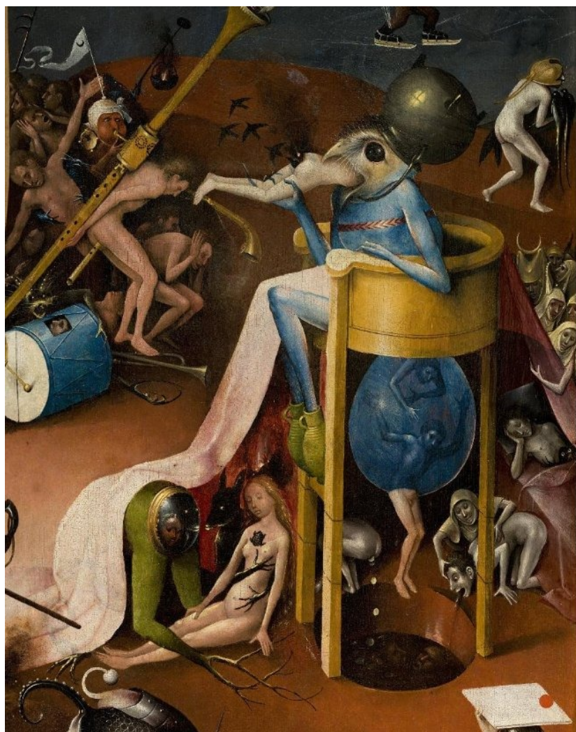
Иероним Босх. Фрагмент правой панели триптиха Сад наслаждений.

грешника. Из его зада в свою очередь выпархивают черные птицы. Летят выклевать нам глаза. Все запечатлено заслуженным и народным художником (безусловно, не одной РФ), все предельно современно. Почему не от него отсчет? И ведь внутри триптиха никто не спрашивает: а это надолго?