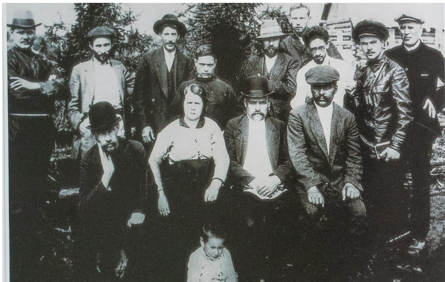
Туруханский край. Ссылные революционеры вместе со Сталиным.