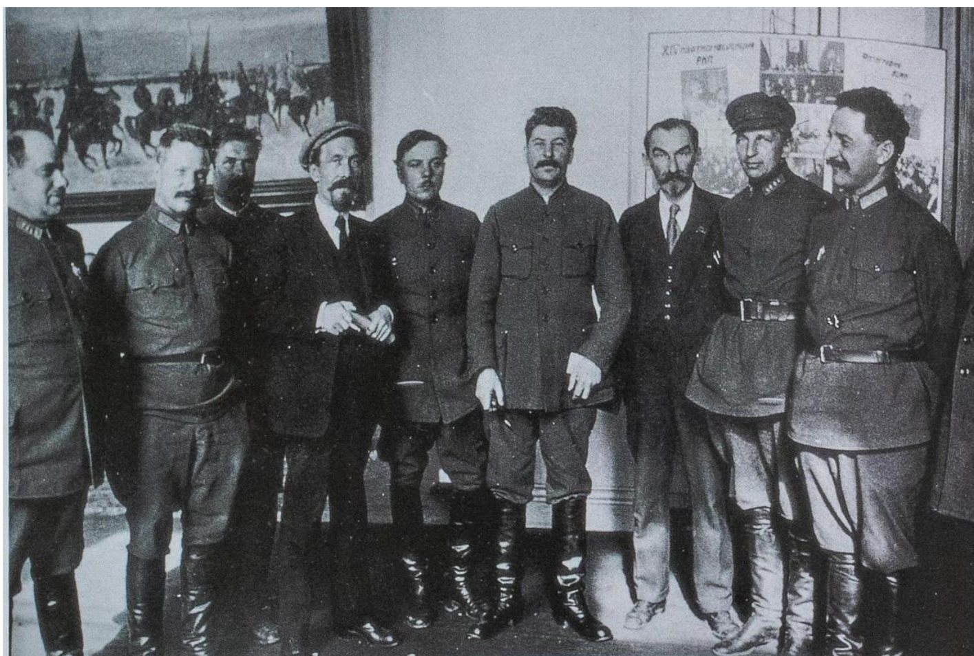
Сталин с соратниками. На снимке (слева направо): Михаил Лашевич (расстрелян), Михаил Фрунзе, Иван Смирнов (расстрелян), Алексей Рыков (расстрелян), Климент Ворошилов, сам Сталин, Николай Скрыпник (самоубийство), Андрей Бубнов (расстрелян), Серго Орджоникидзе (самоубийство).

Академик Отто Юльевич Шмидт, кстати, в письме секретарям ЦК еще в 1938 году вышел с предложением в связи со вторым изданием энциклопедии, подчеркнув, что в ней «имеется также немало биографий различных деятелей, которые в свете позднейших разоблачений правильнее было бы вовсе не помещать в энциклопедии или уже упомянуть о них кратко и в совершенно ином стиле».