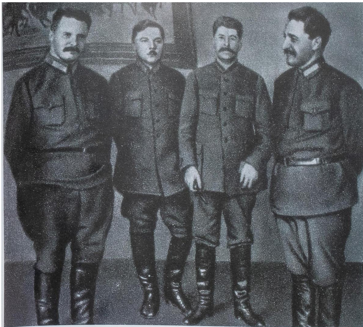
На этом снимке: кто остался к 1939 году

В связи с этим академик предложил «выпускать тома не вшитыми в переплет, а скрепленными под переплетом металлической пружиной, позволяющей мгновенно вынуть любую страницу и заменить ее другой. Редакция должна будет при этом непрерывно следить как за изменением фактических данных (особенно цифровых), так и за отражением последних директив ЦК... Как только какая-нибудь статья устареет или окажется ошибочной, редакция будет обязана перепечатать соответствующие страницы с новым текстом, разослать их подписчикам и потребовать немедленного возврата старых страниц под угрозой прекращения подписки, ошибочные статьи не будут оставаться в библиотеках и на книжных полках и перестанут оказывать свое несомненно вредное действие».