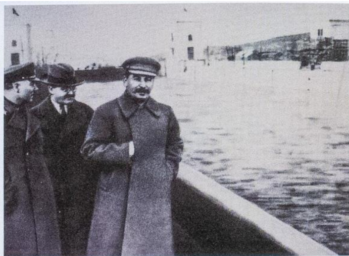
Посещение Сталиным, Ворошиловым, Молотовым и Ежовым нового канала Москва-Волга. На втором снимке Ежова уже нет. Утоп.