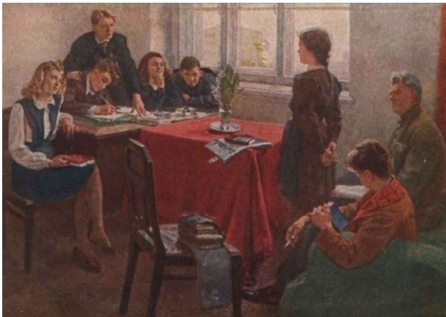
А это — та же картина «после критики культа личности» на XX съезде