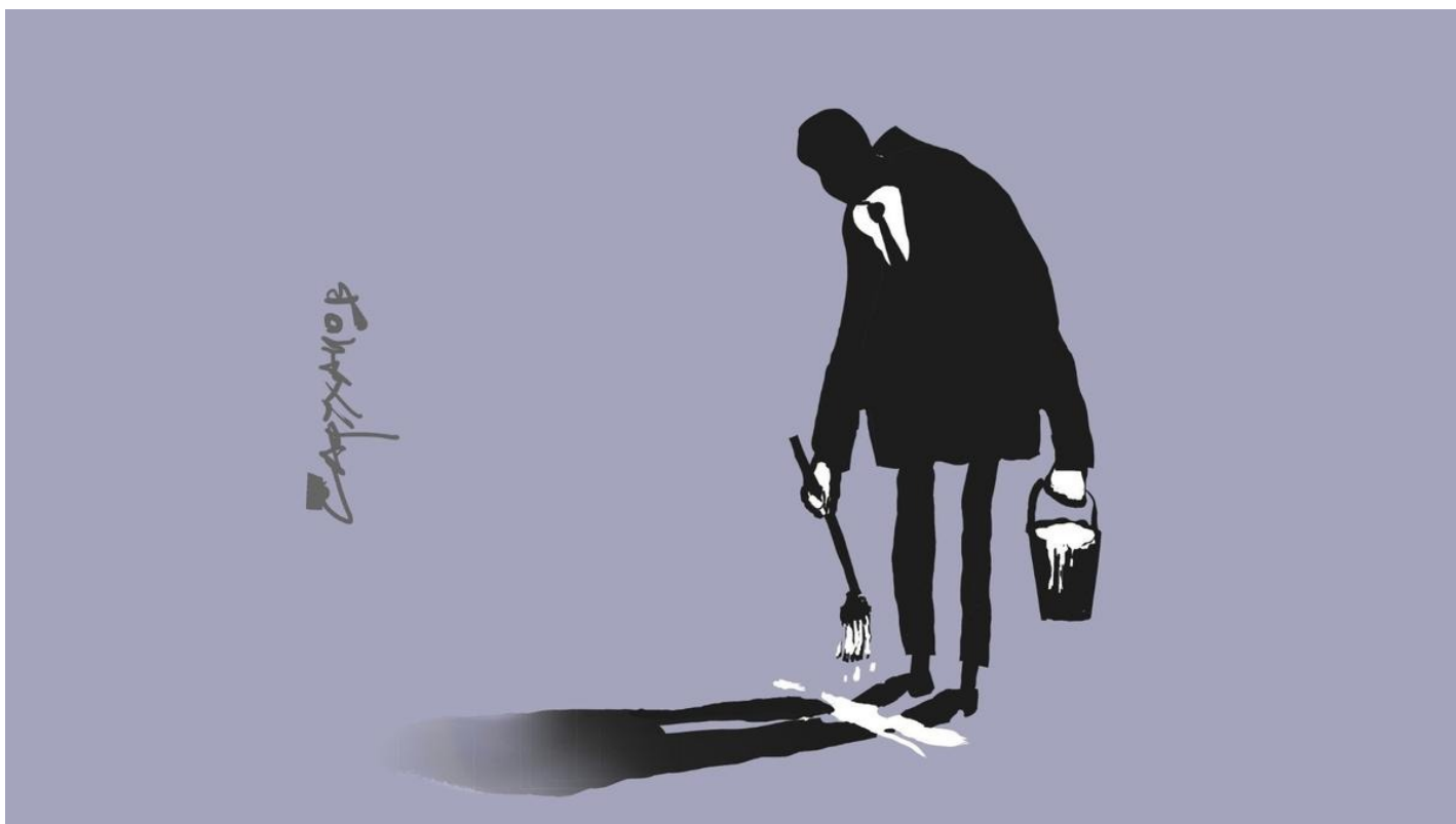
Иллюстрация: Петр Саруханов / «Новая газета»

Как в России стирают: части тела, сигареты, наркотики, лица актеров и... память