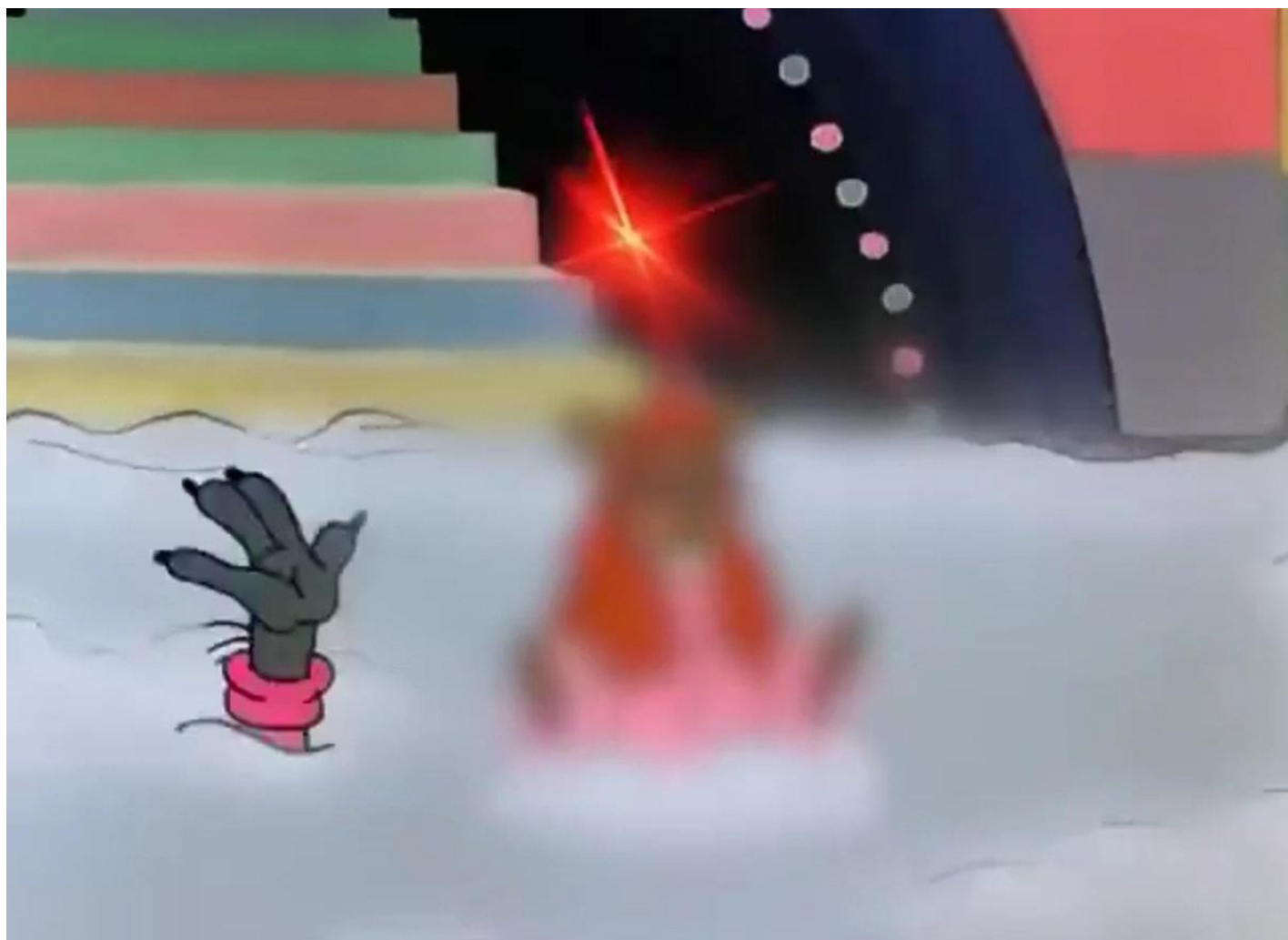
После цензуры. Скриншот из видео

Но самый любимый наш «блюр» — Заяц из «Ну, погоди!» в образе Аллы Пугачевой, поющий про айсберг и превращенный каналом «Карусель» в облачное пятно . Изображение Пугачевой «затуманили» и на афише в фильме «Ледокол».