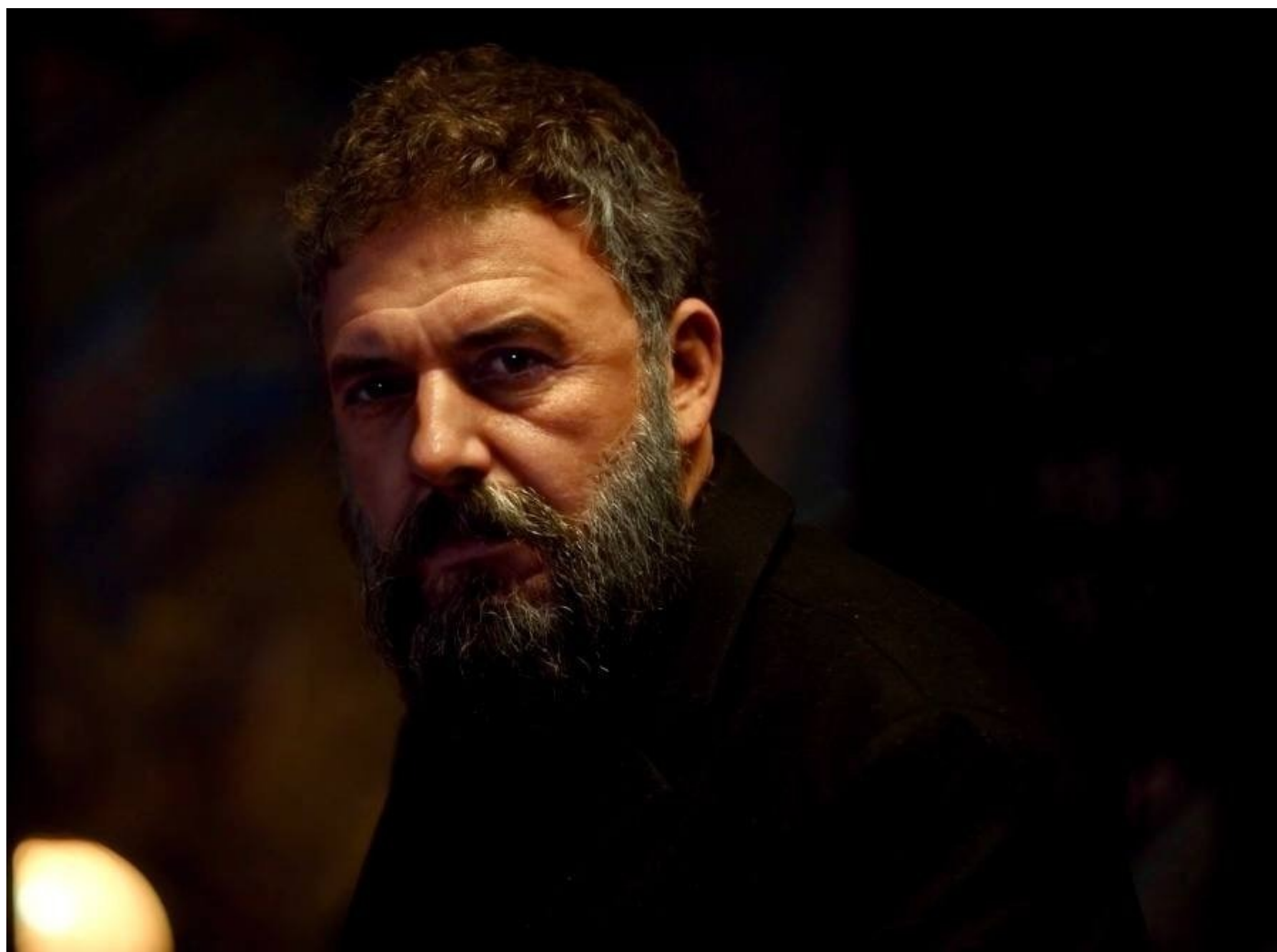
ИИ-двойник Максима Виторгана в сериале «Бар «Один звонок».