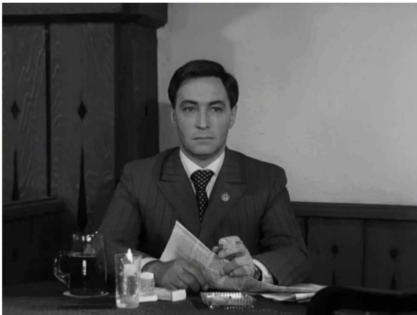
Кадр после цензуры. Скриншот из видео

В мультфильме Хаяо Миядзаки «Ветер крепчает», который перевыпустила компания RWV Film, заблюрен не только процесс курения, но и пачки сигарет. На цифровых каналах замазана квадратиками сигарета в руках у Штирлица. И начинаешь думать, что он там курил? Может, мы раньше не замечали?