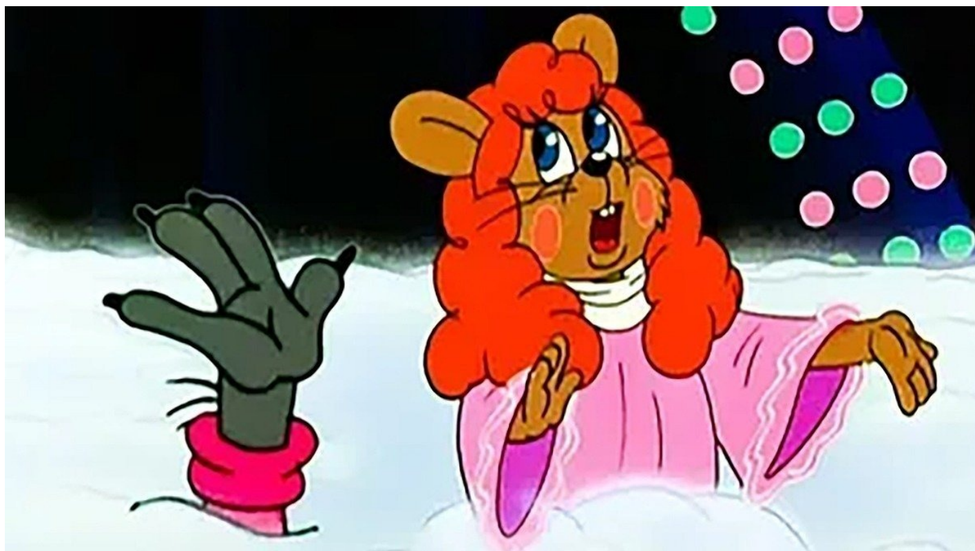
Самый любимый наш «блюз» — Заяц из «Ну, погоди!» в образе Аллы Пугачевой, поющий про айсберг и превращенный каналом «Карусель» в облачное пятно. Скриншот из видео

режиссера «Ученика», «Лета» и «Чайковского» российскому зрителю запрещено. При этом Серебренников — не «иностранный агент», не террорист, не экстремист. Каким законом руководствовалась компания «Артхаус», удаляя этот отрывок, остается гадать.