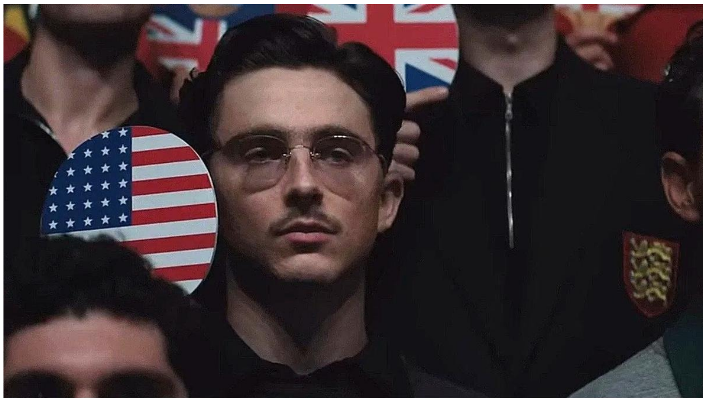
Кадр из фильма «Марти великолепный»

Харизматик Шаламе играет самовлюбленного, амбициозного неудачника, заикленного на сверхидее. Героя с отрицательным обаянием.