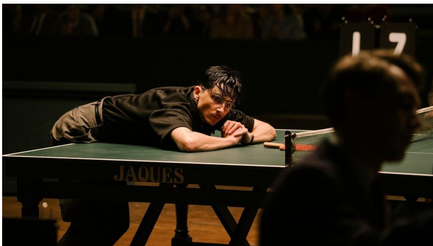
Кадр из фильма «Марти великолепный»

15 января выходит в прокат фильм Джуша Сафди, уже отмеченный «Золотым глобусом» за лучшую мужскую комедийную роль