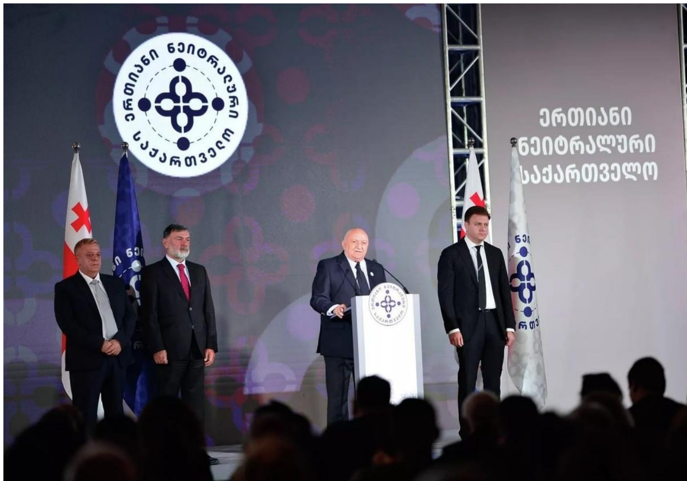
Съезд партии Единая нейтральная Грузия.

ценностей», обретение и сохранение «международно признанного статуса нейтрального государства», ориентация на «национальные интересы при взаимодействии с другими государствами и международными организациями».