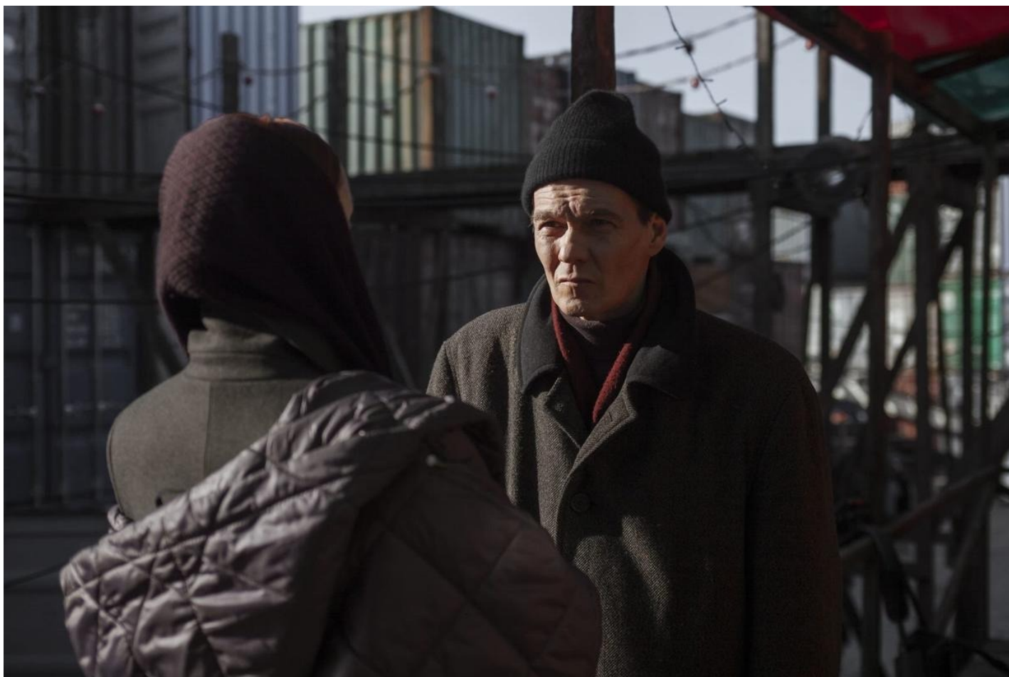
Кадр из сериала «Резервация»

Ради спасения своей семьи Сергею придется раскрыть многослойную тайну резервации. Стать частным сыщиком, хранителем семьи, которая от него отвернулась, и, возможно, стать мстителем. А среди первых дел, которые ему поручают: разыскать по просьбе мутного мэра особой зоны (Филипп Янковский) его пропавшую дочь.