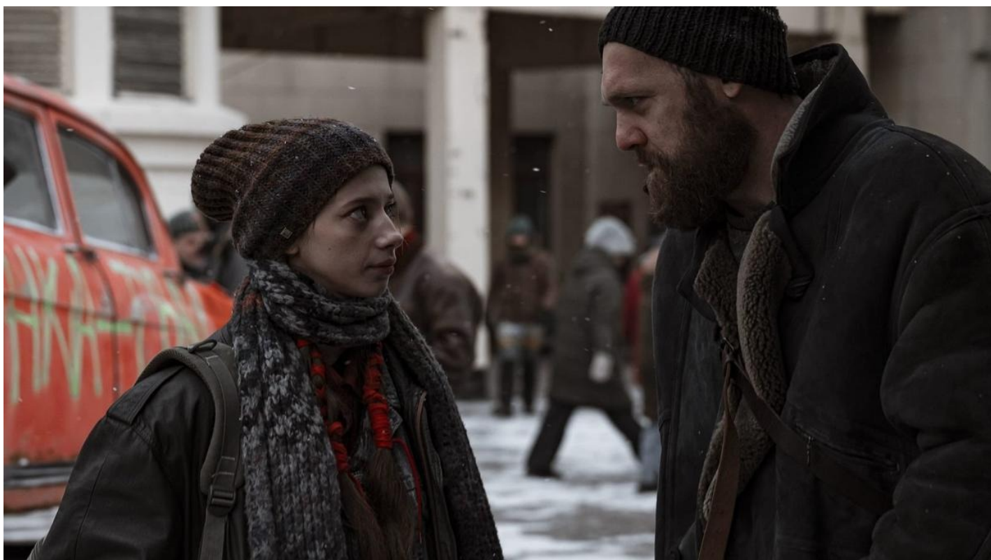
Кадр из сериала «Резервация»

С 1 февраля на платформе KION детективный триллер «Резервация» режиссера Алексея Андрианова