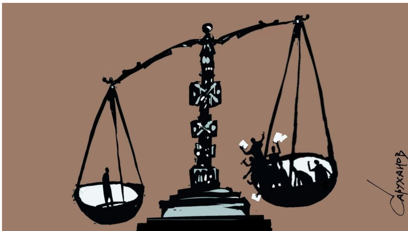
Иллюстрация: Петр Саруханов / «Новая газета»

Даже если суд в России вынесет адекватный приговор, после обжалования прокуратурой он, скорее всего, будет ужесточен