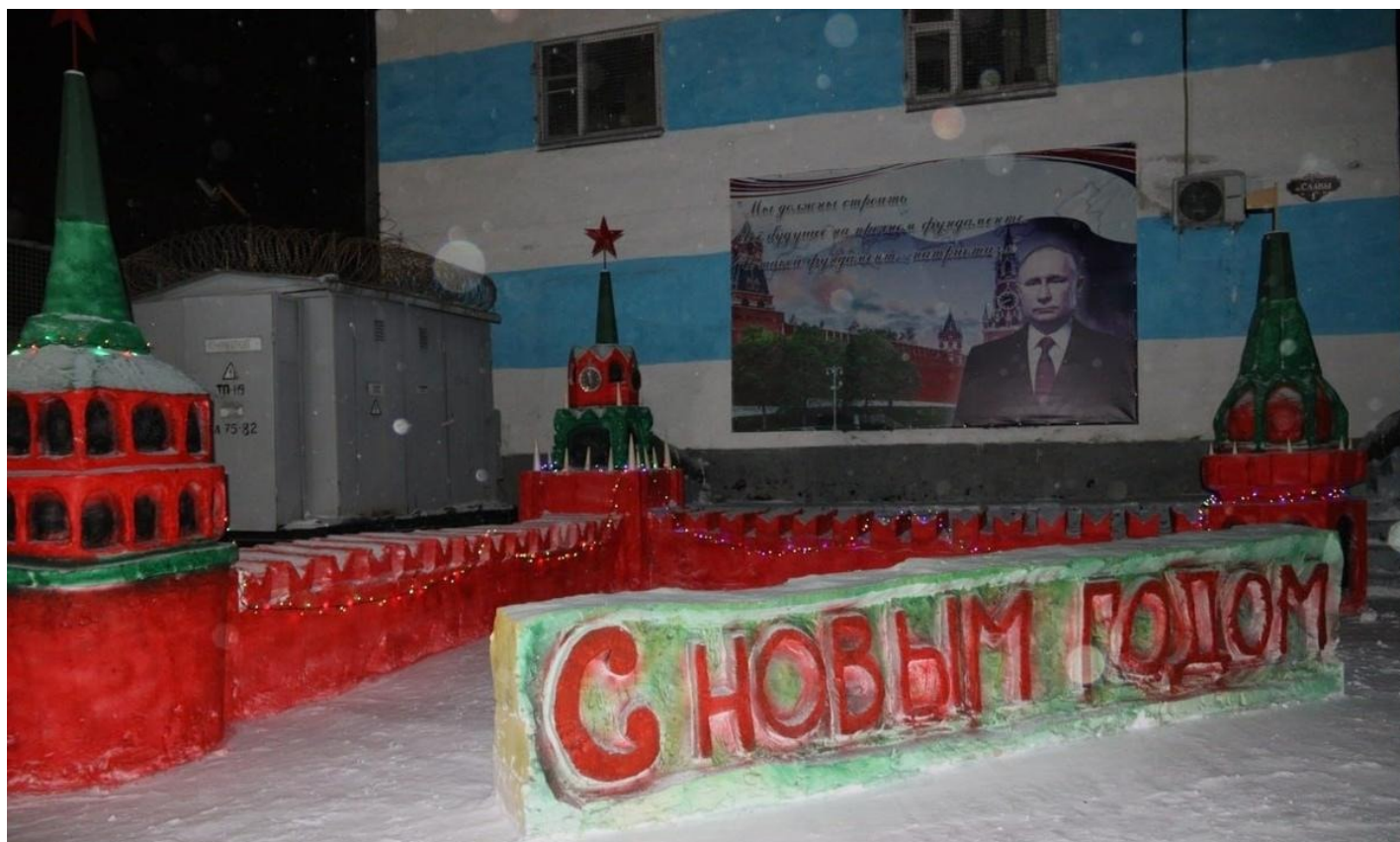
ИК-27 Красноярского ГУФСИН (это соседняя, за забором, колония от Никиты).

на промзоне есть какая-то бочка: если на нее взобраться, то вдалеке видно немного воли — холм и что-то на нем, то ли столб, то ли дерево, больше ничего не видно. А так изо всех окон — только заборы.