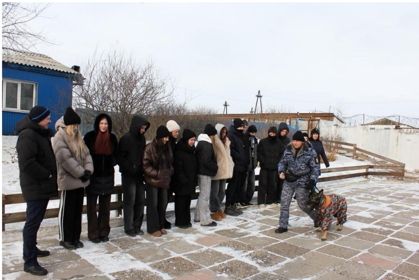
В гостях в ИК-31 ученики профильного класса ГУФСИН красноярской школы № 156.

Никита остался тем же — он и сейчас говорит не о себе, не о своих бедах, а о проблемах друзей и товарищей по лагерю.