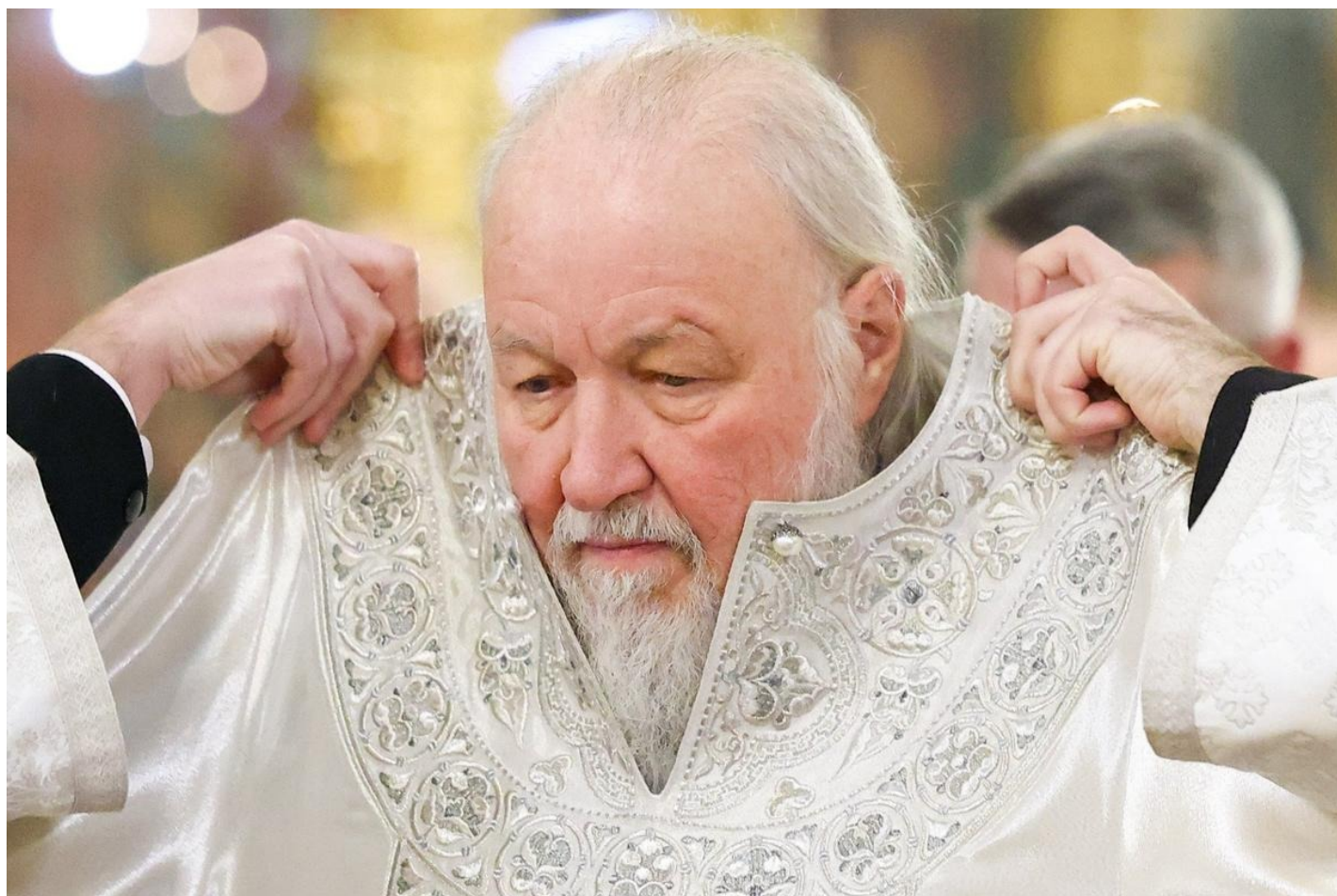
Патриарх Кирилл.