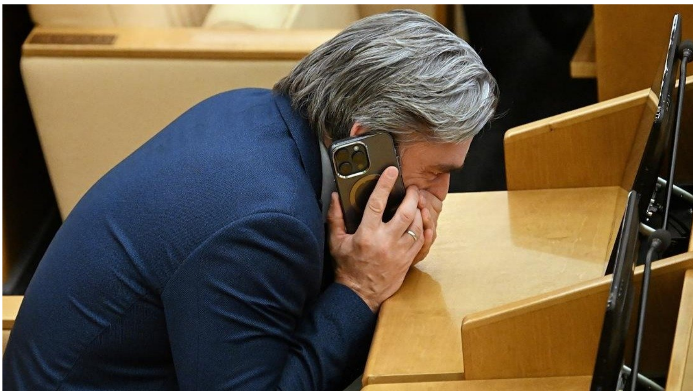
Андрей Свинцов.

Зачем скандальный депутат Госдумы Андрей Свинцов решил совершить политическое самоубийство