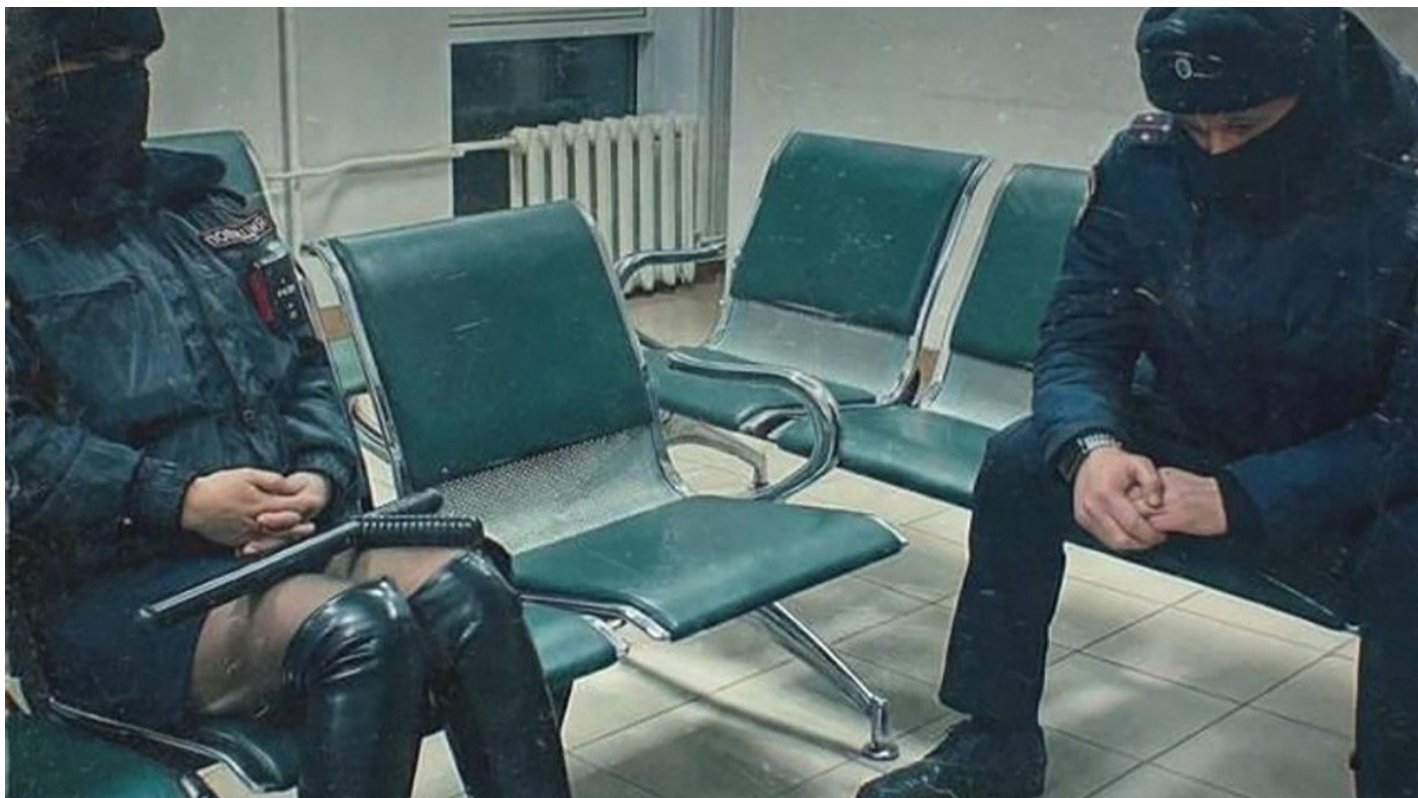
Фрагмент обложки пластинки «Чужие»

Топ-5 лучших музыкальных релизов начала года