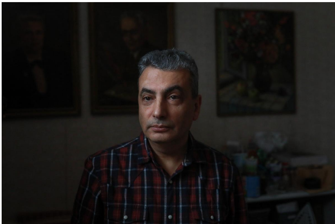
Лев Шлосберг.

Для внутренней тишины важна и внешняя тишина. Человеческое общение должно быть широким ровно настолько, насколько оно внутренне востребовано. Я понял, что в новой жизненной ситуации мне более всего важен разговор внутри себя. Но не только.