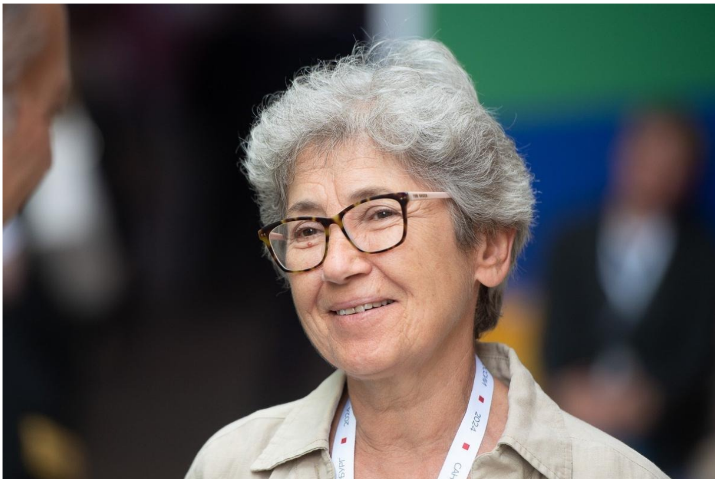
Экономист Наталья Зубаревич.

Азербайджану было легче — из-за нефти. Туда пришли западные компании, получили возможность делать технологически более современную добычу нефти. И очень простая арифметика: вы вкладываете ваши инвестиции, а потом часть дохода, и немалую, отдаете нам. А мы сами решим, как мы будем это тратить. Поэтому Азербайджан не так сильно падал — потому что базовая индустрия добычи сохранилась. У людей, которые имели доступ к доходам от нефти, все было хорошо. Но массовое население Азербайджана жило очень бедно, как и грузинское, как и армянское.