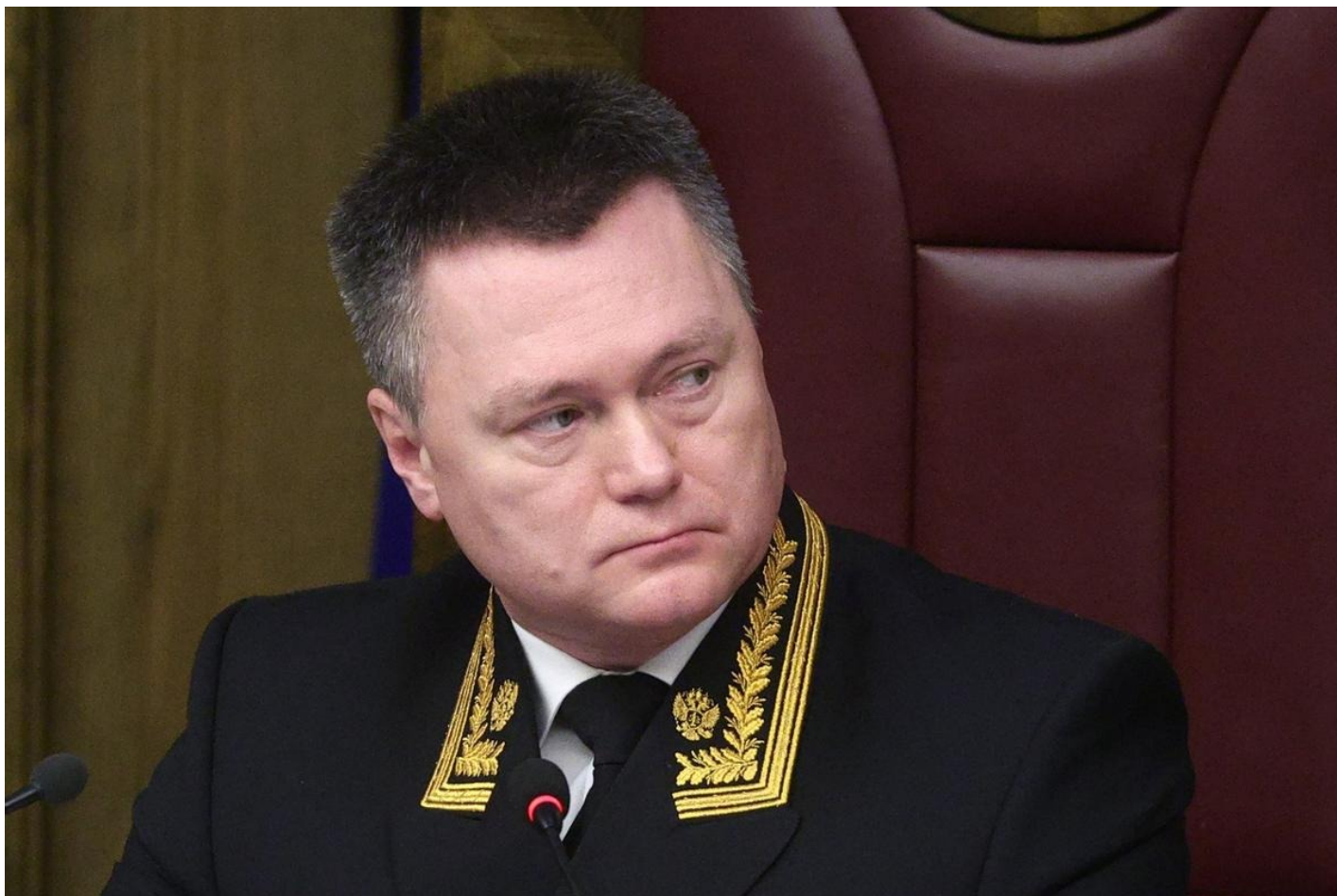
Игорь Краснов.

19 февраля 2026 года председатель Верховного суда РФ Игорь Краснов выступал на совещании судей судов общей юрисдикции, арбитражных и военных судов. Где сказал следующее: