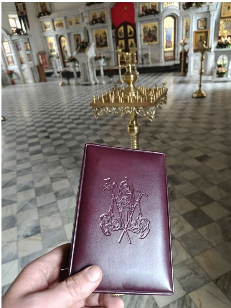
«Патриаршая благодарность» за участие в борьбе с коронавирусной инфекцией.