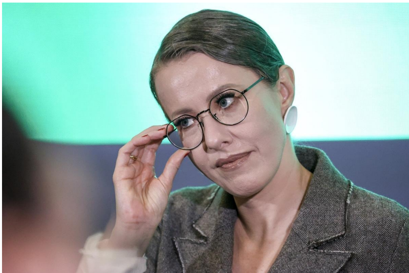
Ксения Собчак.

Пока пишу колонку, подоспело новое сообщение. Теперь уже Ксения Собчак обратилась к Бастрыкину с просьбой дать правовую оценку словам Соловьева в адрес Бони. Бедный Александр Иванович! Он ведь не только глава Следственного комитета, но и писатель, творец, у него к словам свое, особое отношение. Более того, ему ведь еще с Григорием Остером нужно разобраться, пока «Вредные советы» окончательно не испортили подрастающее поколение. Они ведь впервые были опубликованы аж в 1983 году в крамольном журнале «Колобок». Вот уж где истинная опасность для государства кроется, а Соловьев с Боней могут и подождать.