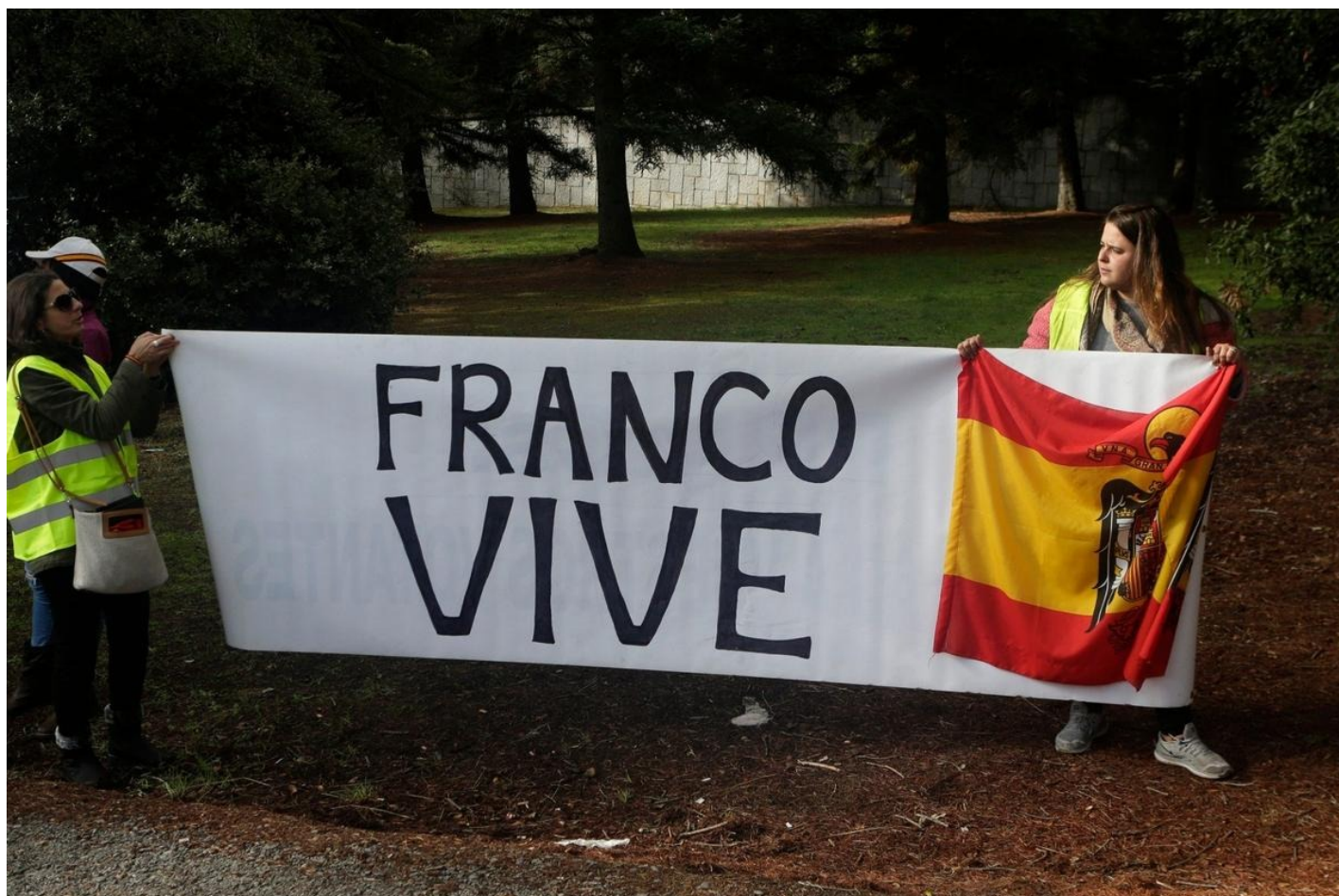
Эксгумация и перезахоронение останков Франко в Мадриде.