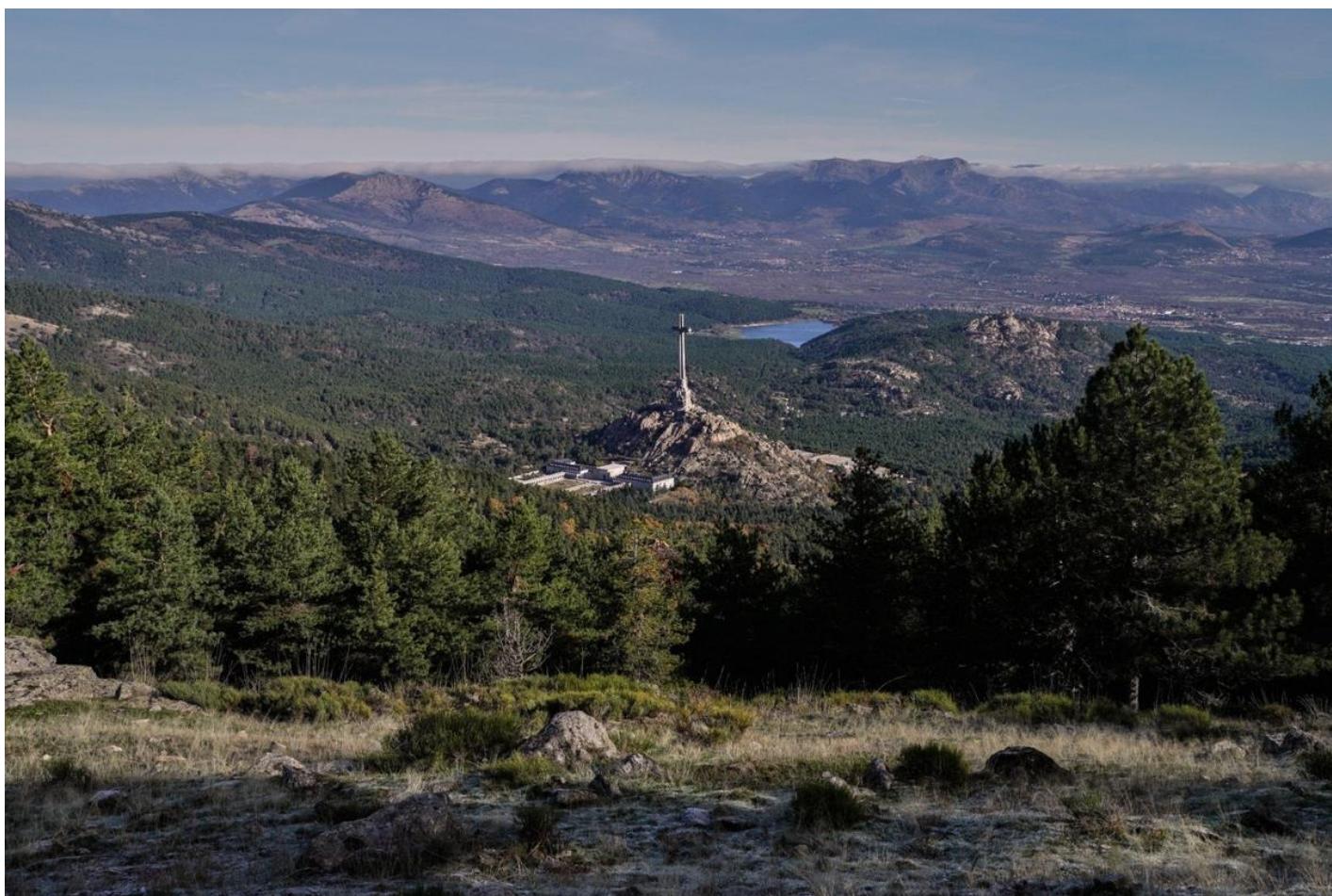
Долина Павших.

Если сопротивление оказывается сильнее ожидаемого, сценарий корректируется. Замедляется темп, изменяется риторика, вводятся дополнительные компромиссы. Если поддержка превышает прогнозы, процесс ускоряется.