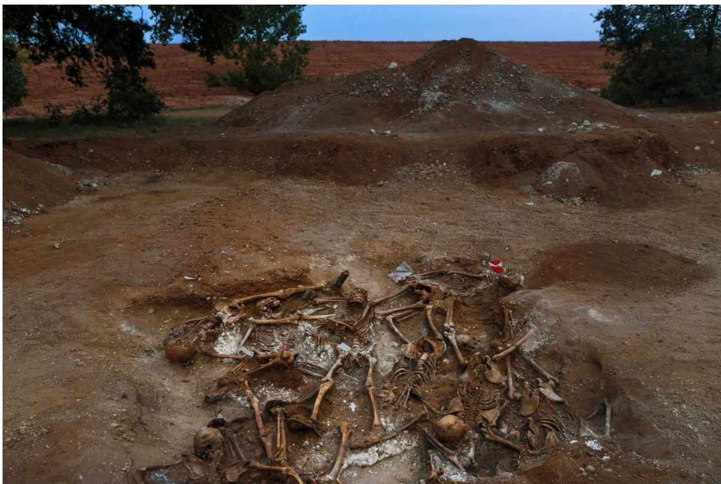
Массовые захоронения времен генерала Франко.

Второй акт может закончиться тремя способами. Если новый нарратив побеждает — процесс переходит к кульминации. Если терпит поражение — возвращается к прологу. Если силы равны — возникает ситуация «противоречивых нарративов», когда в обществе параллельно существуют несовместимые версии истории.