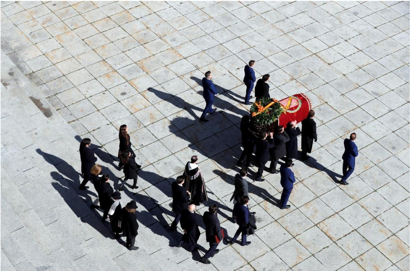
Эксгумация и перезахоронение останков испанского диктатора Франсиско Франко в Мадриде.

Ключевая особенность первого акта — борьба за легитимность новой повестки. Инициаторы должны доказать, что их требования обоснованы, актуальны, заслуживают общественного внимания. Им противостоят защитники status quo , которые апеллируют к стабильности, традициям, необходимости «не делить общество».