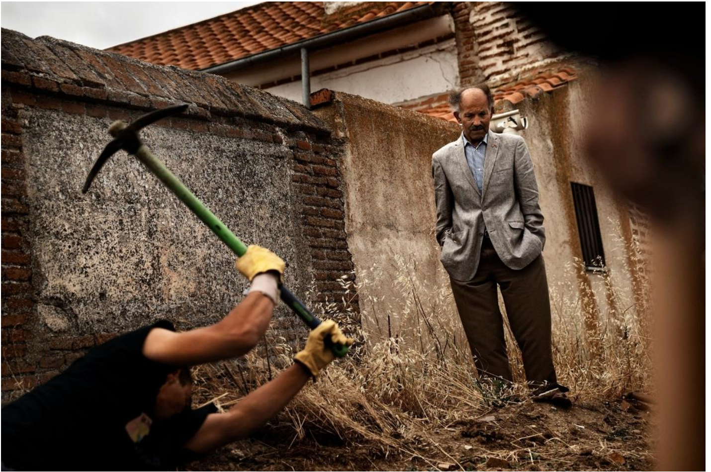
Предполагаемое место массовых захоронений — наследия фашистского прошлого Испании времен генерала Франко.

Этот период кажется статичным — ничего не происходит, история застыла. На самом деле в прологе накапливается энергия, которая в будущем будет питать процесс трансформации. Молчание не означает забвения. Семьи жертв хранят память о своих убитых. Дети и внуки растут с обрывками историй, недосказанностями, семейными тайнами.