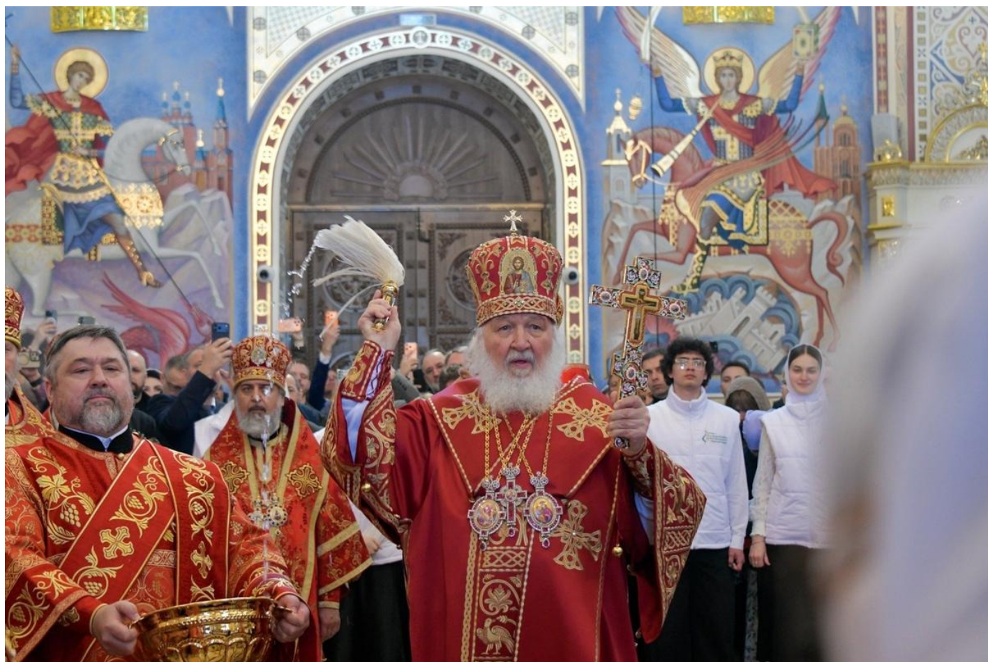
Патриарх Московский и всея Руси Кирилл.

Светские лидеры говорят религиозным языком, религиозные — языком силовых ведомств. Если государство, его политический режим и военные инициативы объявляются священными, всякая грань между светским и духовным стирается.