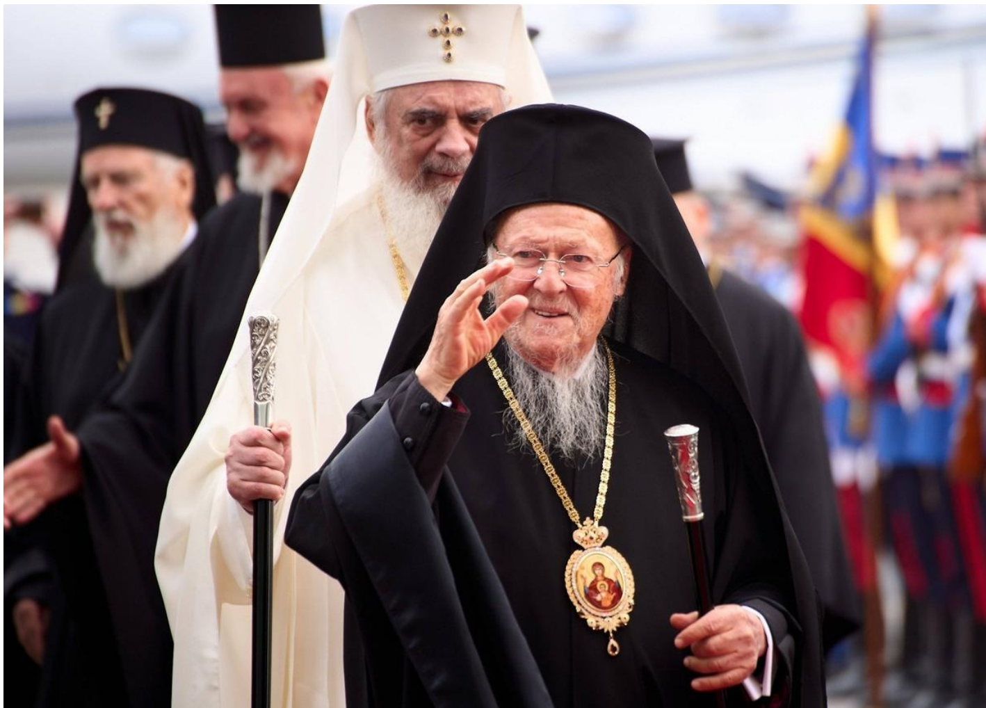
Патриарх Константинопольский Варфоломей.

плоти», обвинив в стремлении распространить свое влияние на Украину, а также на Балтийские страны и Черногорию. В следующем заявлении, которое вышло 31 марта под названием «Варфоломей забылся в своем высокомерии», то же ведомство, ссылаясь на церковные каноны (!), обвинило Константинополь в попытке повлиять на выборы патриарха в Грузии.