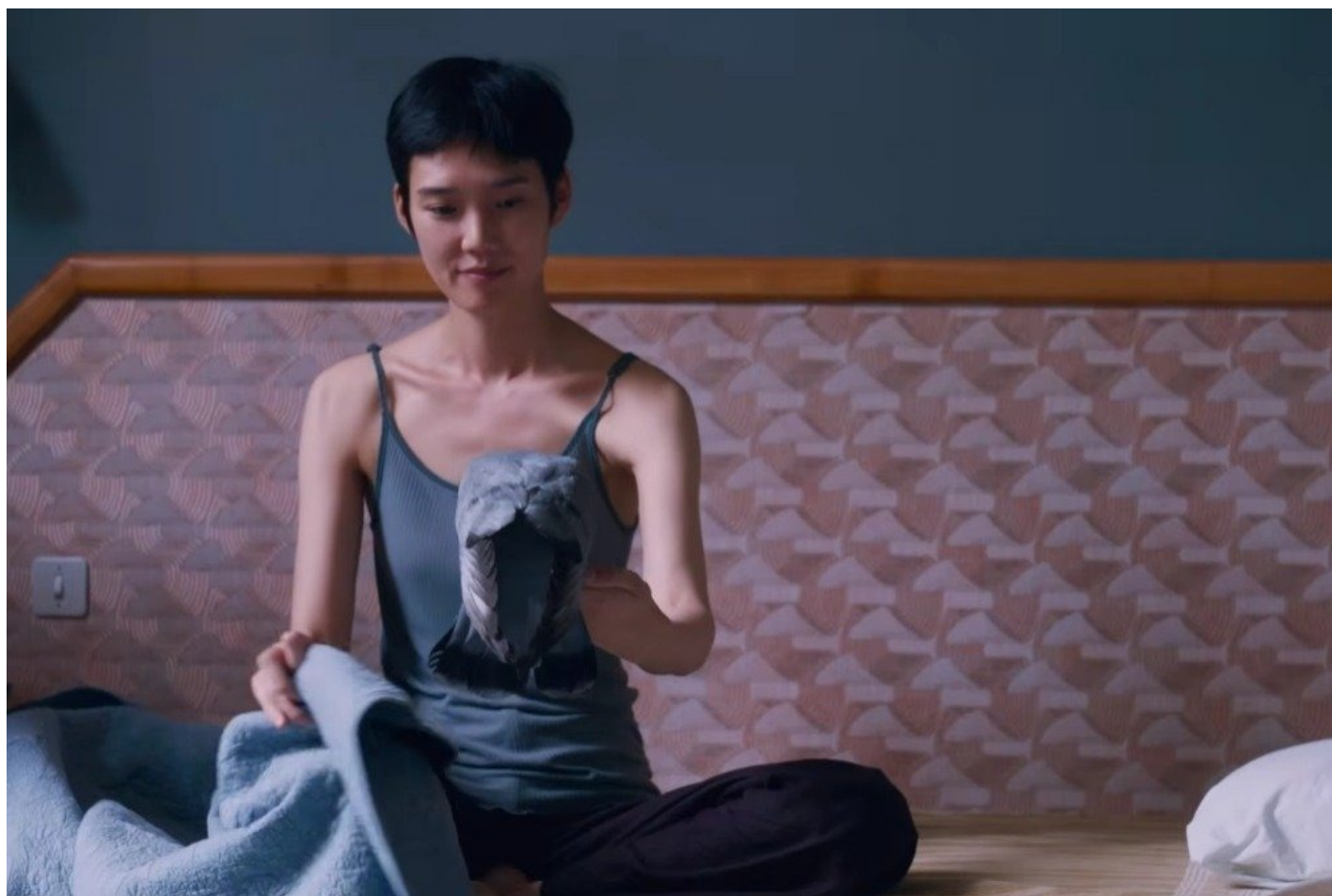
Кадр из фильма «Внезапно»

уничтожает природу. «Внезапно» помещает философские вопросы в контекст гуманитарной гериатрии. При этом возлюбленный режиссером образ двойника здесь теряет свою тревожную симметрию: из символа раздвоенности становится инструментом не показной — подлинной коммуникации.