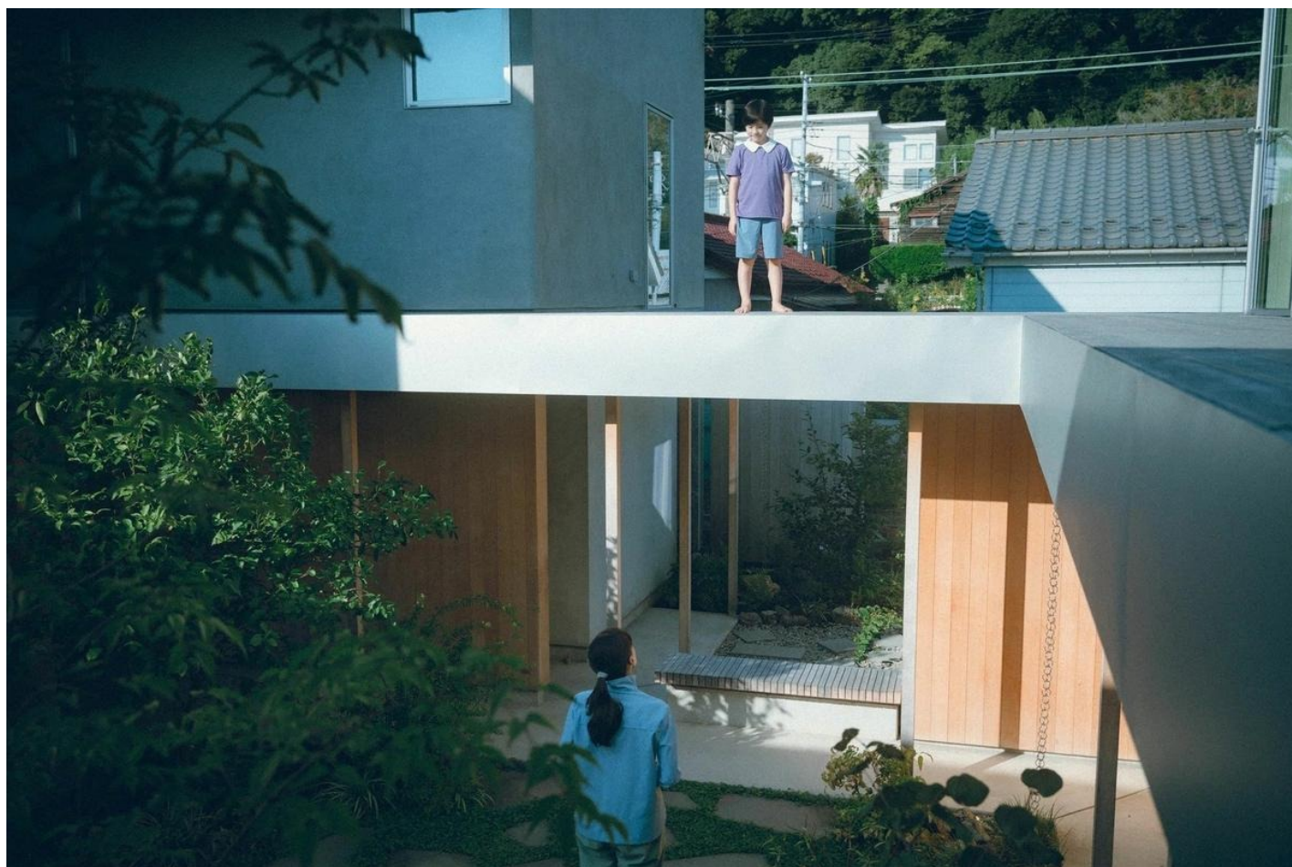
Кадр из фильма «Барашек в коробке».

После «Мулена» — франкоязычной драмы талантливого венгерского режиссера Ласло Немеша («Сын Саула», «Оскар» за лучший иностранный фильм), ее также показали в основной программе, — странные ощущения. Кино о легендарном французском лидере Сопротивления Жане Мулене (сдержанный, «застегнутый на все пуговицы» Жиль Леллуш), который на парашюте в 1943 году буквально падает на захваченную Францию из Лондона, чтобы начать объединение враждующих сторон Сопротивления. Но вскоре Мулена по доносу забирают в штаб-квартиру гестапо, он попадает в клещи Клауса Барби (надо же, чтобы так звали изощренное чудовище по прозвищу Лионский Мясник! Как всегда, роскошная, но несколько нарочито театрализованная игра Ларса Эйдингера, которому снова выпала роль подонка), на его руках — жизни десятков тысяч (!) невинных людей.