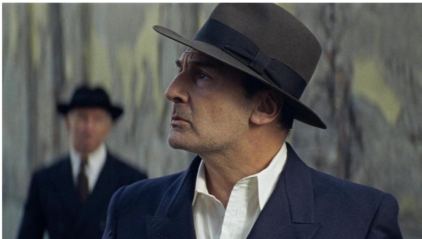
Кадр из фильма «Мулен»

Первая половина фильма — безусловный нуар: ночные сцены с теплым светом фонарей, высокая контрастность, анаморфированное изображение, длинные тени. Нарастающее напряжение, когда каждый силуэт рядом с Муленом воспринимается как преследователь. Вторая часть — пытки. Изощренные. Не для слаонервных. Не только физические, но и моральные. Наверное, все это с точки зрения факта честно. Но невыносимо. Беспощадно. И предсказуемо.