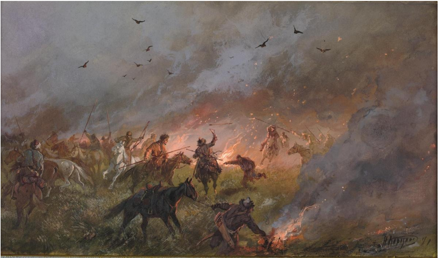
Пугачёвщина в Сибири. Поражение скопищ самозванца под Троицком, 21 мая 1774 г.

Еще одним приемом Зыгаря, помимо фокуса на личностях, являются параллели. Здесь их тоже много. Например,