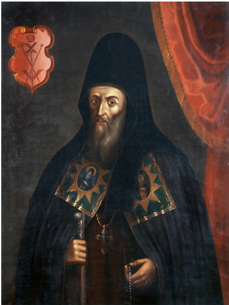
Иннокентий Гизель. Архимандритъ біско-печерской лавры умеръ 1687 году.

Архимандрит Иннокентий (Гизель). Портрет 1-й половины XVIII в.