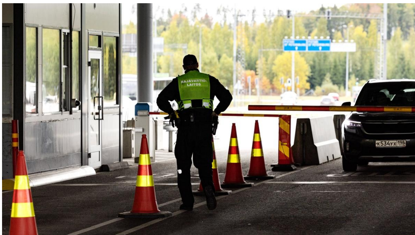
Пункт пересечения границы между Россией и Финляндией.

«Новая-Европа» поговорила с теми, кто уже столкнулся с арестом автомобилей с российскими номерами, и теми, кого эта проблема скоро затронет