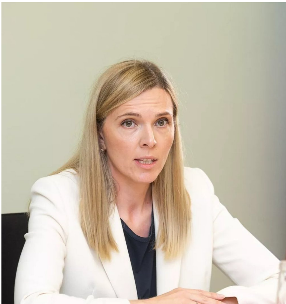
Агне Билотайте.

Кроме того, литовская таможня пригрозила, что в скором времени власти начнут изымать автомобили с российскими номерами, которые находятся в Литве.