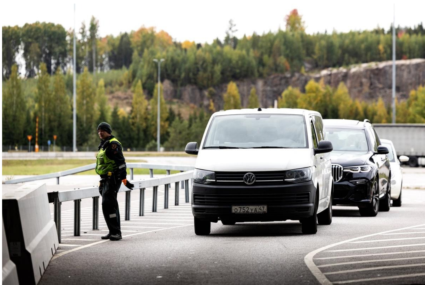
Пункт пересечения границы между Россией и Финляндией.