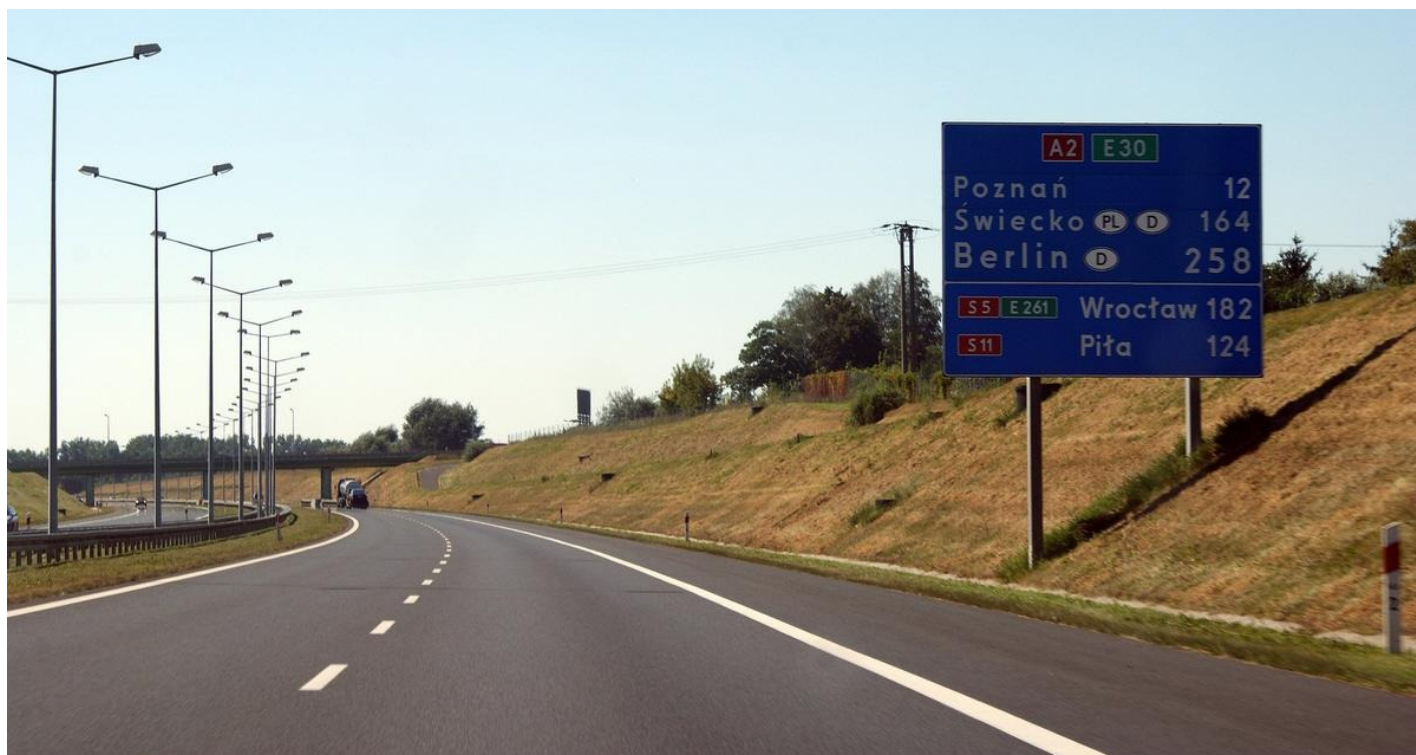
Трасса А2, между Варшавой и Берлином.