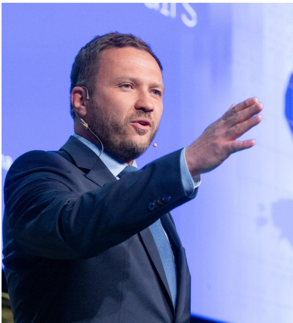
Маргус Цахкна.

При этом автомобили с российскими номерами пока могут покинуть Эстонию через внутренние границы ЕС — в таможенной службе пообещали не препятствовать этому процессу.