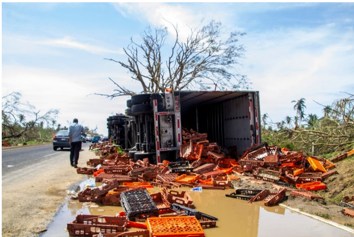
Последствия урагана.