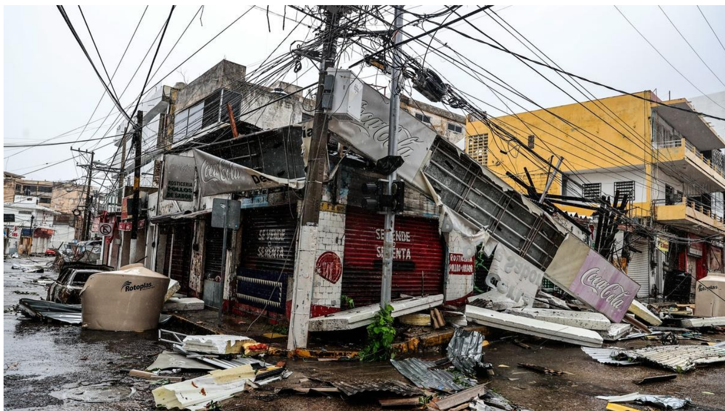
Последствия урагана.

Десятки людей погибли, сотни тысяч остаются без света. СМИ сообщают о массовом мародерстве