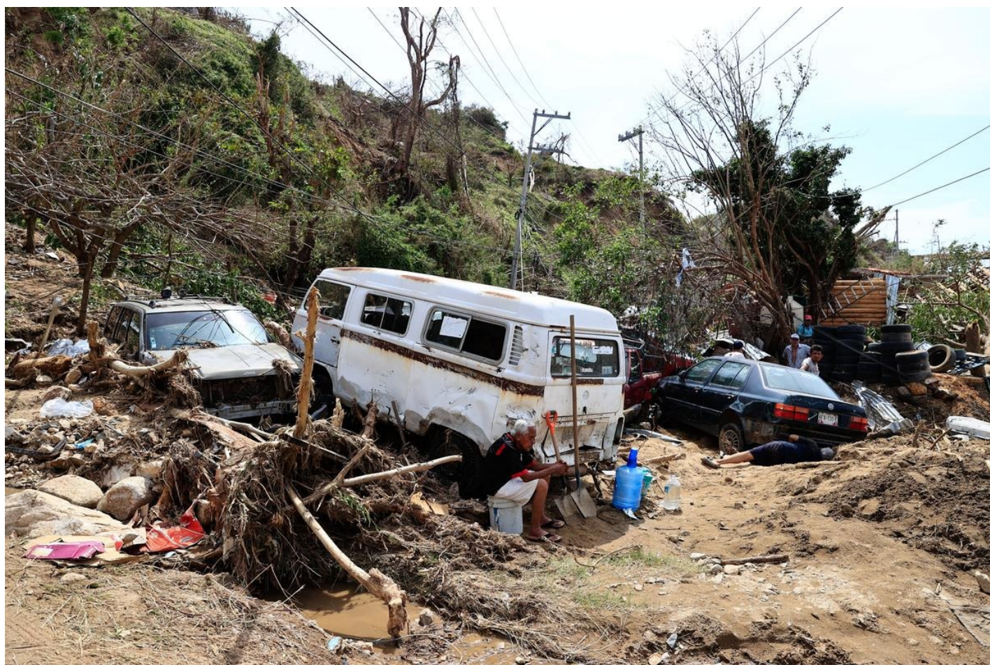
Последствия урагана.

«В некоторых местах имели место акты мародерства, поскольку сложилась чрезвычайная ситуация», — заявил в пятницу президент Андрес Лопес Обрадор, призвав жителей не пользоваться ситуацией.