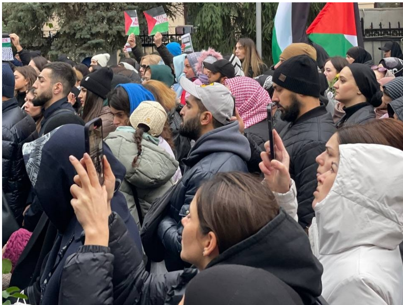
Акция у посольства Палестины в Москве.