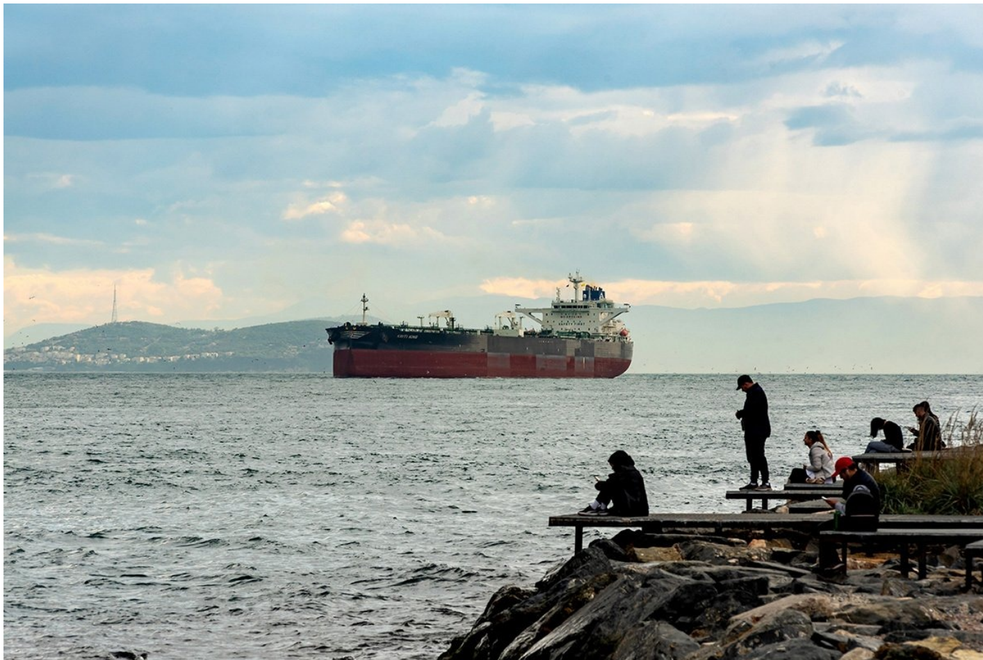
Нефтяной танкер входит в пролив Босфор в направлении Черного моря и порта Новороссийск.

это просто подставные фирмы, которые владеют одним танкером. Тем не менее аналитики зафиксировали , что скидки на российскую нефть опять растут. Но прошлый опыт показывает, что делать выводы еще рано.