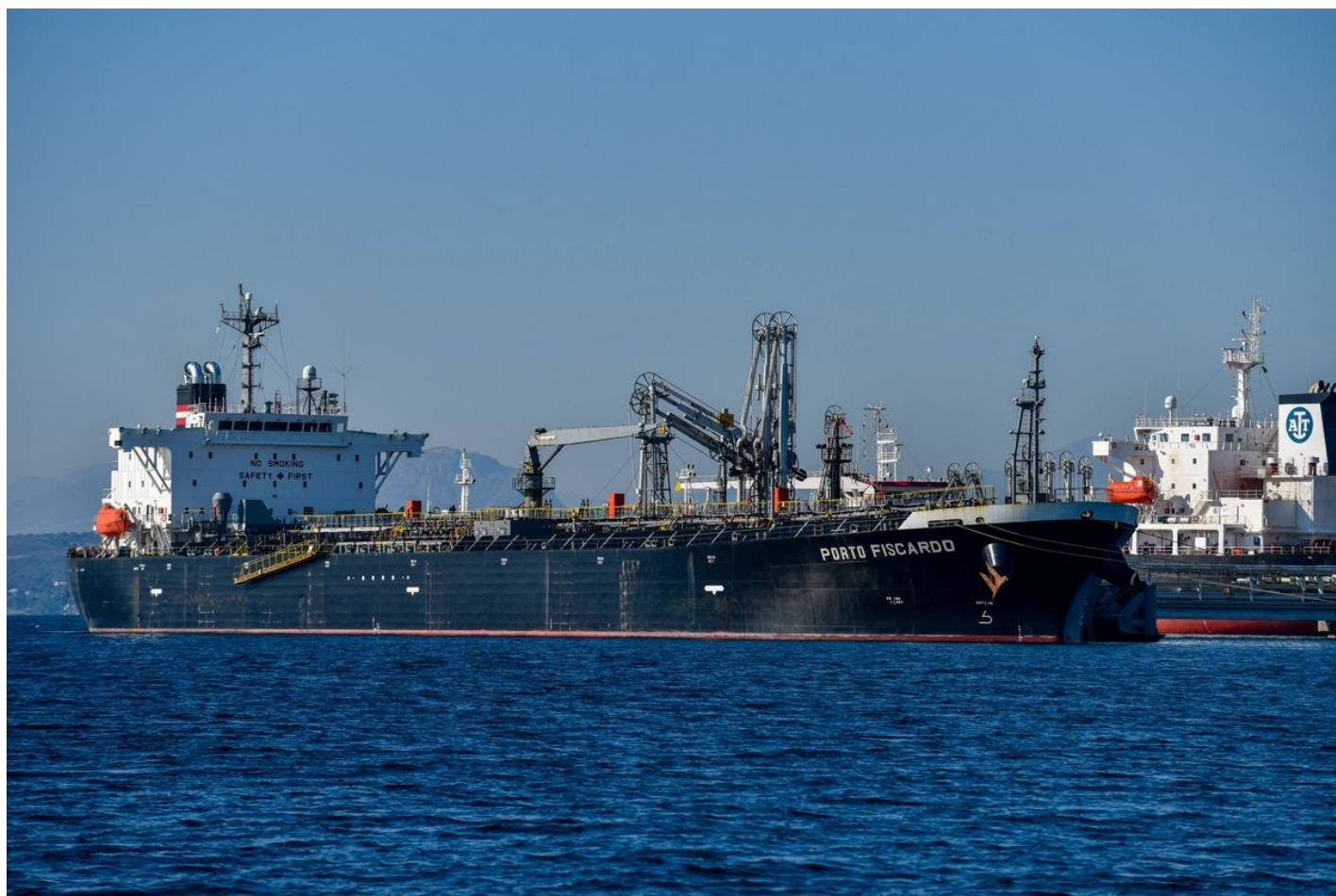
Танкер прибывший из порта Новороссийск на Черном море, выгружает свой груз в доке Агиои Теодорои близ Коринфа, Греция, 4 января 2023 года.

Уже к концу года практически все поставки России шли выше потолка в 60 долларов за баррель, признавал на условиях анонимности чиновник из европейского правительства в разговоре с Financial Times. Основной сорт российской нефти Urals торговался выше потолка с июля, а затем поднялся выше 70 долларов, сообщали независимое агентство Argus и Минфин России. Ведомство утверждает, что в сентябре-октябре цена российской нефти превышала 80 долларов, а дисконт к эталонной марке Brent был около 10 долларов.