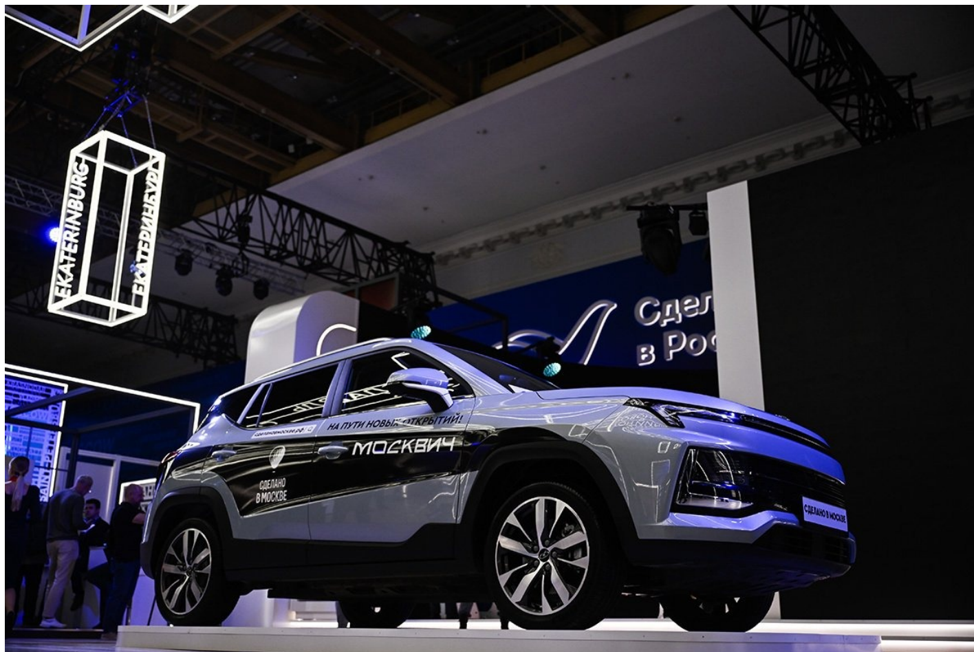
Презентация автомобиля «Москвич 3», который является копией Sehol X4 (JAC JS4) китайской компании JAC Motors, 20 октября 2023 года.

российского подразделения международного агентства Nielsen IQ, продажи товаров повседневного спроса выросли за год к ноябрю на 10%. Рост продаж непродовольственных товаров, по данным Росстата, в октябре достиг 20% за вычетом инфляции.