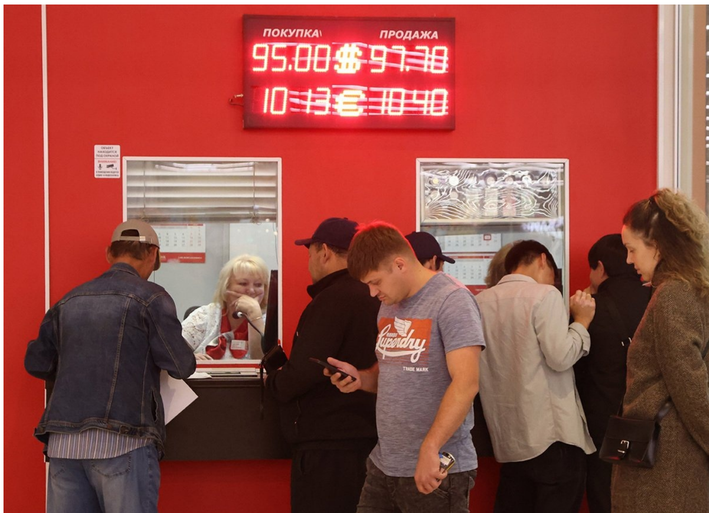
Обменник валют в Москве, 18 сентября 2023 года.

Экономисты не сомневаются , что деньги на эти расходы найдут: если доходов не хватит, у правительства есть накопления в Фонде национального благосостояния и возможность занимать у российских банков. Вдобавок для пополнения бюджета правительство ввело новые сборы с бизнеса и граждан: за ввоз иномарок, добычу ископаемых, пошлины для экспортеров, единоразовый налог на сверхприбыль и другие. Новые сборы также дополнительно разгоняют инфляцию. Крупнейшие магнаты, обеспокоенные непредсказуемостью appetitов власти, уже начали с правительством переговоры о новых налогах в 2024 году.