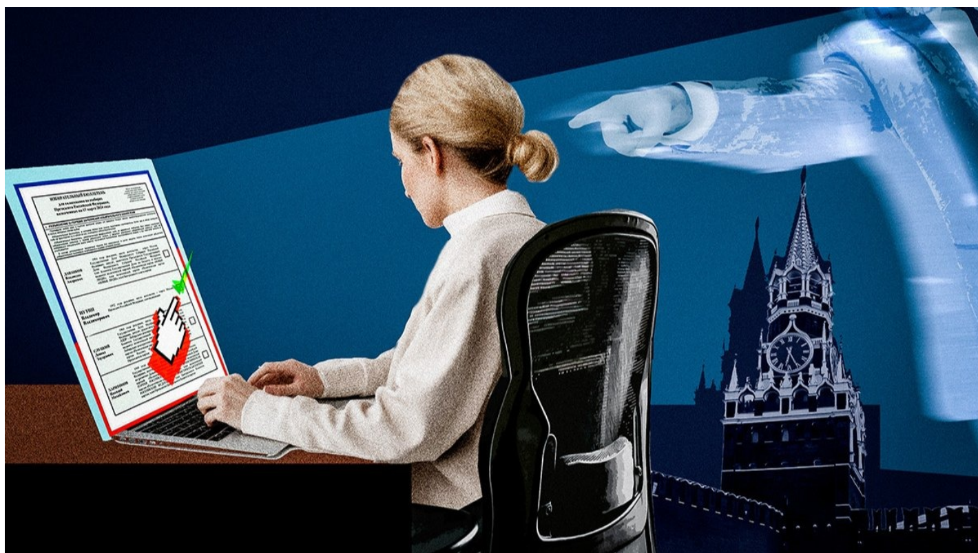
Иллюстрация: «Новая газета Европа»

«Новая-Европа» рассказывает, кого и как заставляют участвовать в дистанционном голосовании. С его помощью Путину планируют обеспечить исторический результат