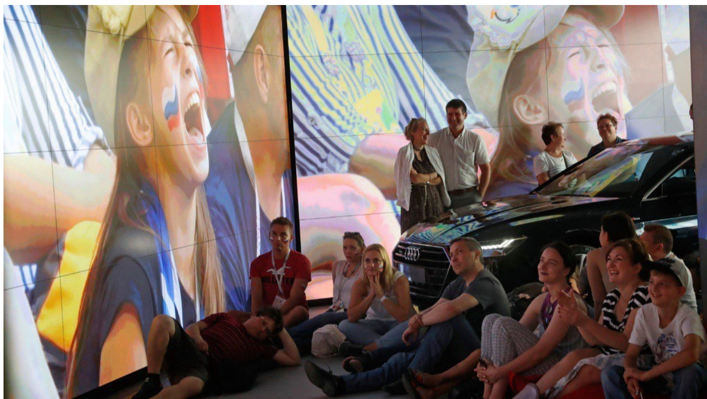
Болельщики смотрят прямую трансляцию матча Чемпионата мира по футболу FIFA 2018 между сборными России и Уругвая в Москве, 25 июня 2018 года.