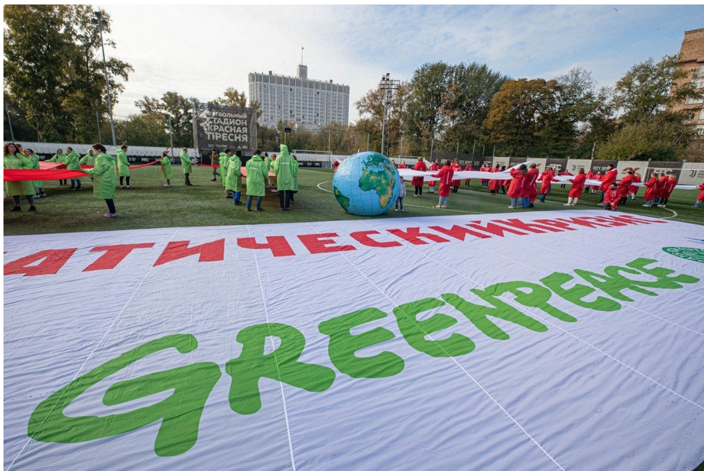
Активисты Гринпис выстраивают слова «Действуй сейчас» рядом с баннером с надписью «Климатический кризис» во время акции протеста перед зданием правительства РФ в Москве.

— Далее организация приступила к ликвидации. По факту нежелательной признали Greenpeace International, а не российское отделение, но так как мы отделение международного «Гринпис», мы обязаны были закрыться, — добавила Горчакова.