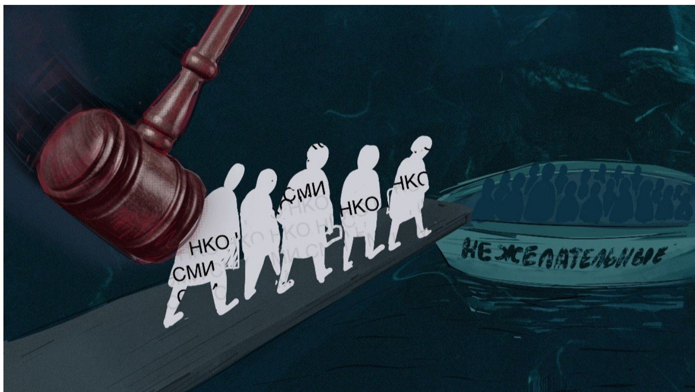
Иллюстрация: Алиса Красникова / «Новая газета Европа»

За первые три месяца 2024-го российские власти признали своими врагами больше организаций, чем за весь 2022-й. «Новая-Европа» показывает, как ужесточили репрессии против медиа и НКО