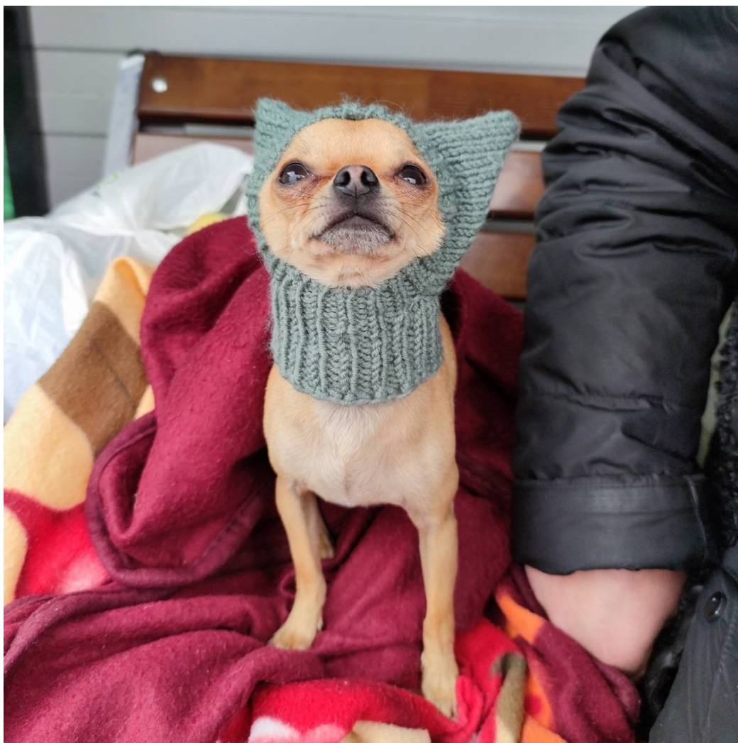
Беженцы пытаются согреть свою собаку, 9 октября 2023 года.

Воду для чая греют в магазине рядом. Когда она вновь заканчивается, девочка бежит помогать. Подпрыгивает и передвигается бегом — то ли просто быстрая, то ли хочет так согреться. Но возвращается ни с чем: в магазине теперь стали требовать деньги за кипяток: сто рублей. Александр идет разбираться в магазин, а я остаюсь общаться с украинцами.