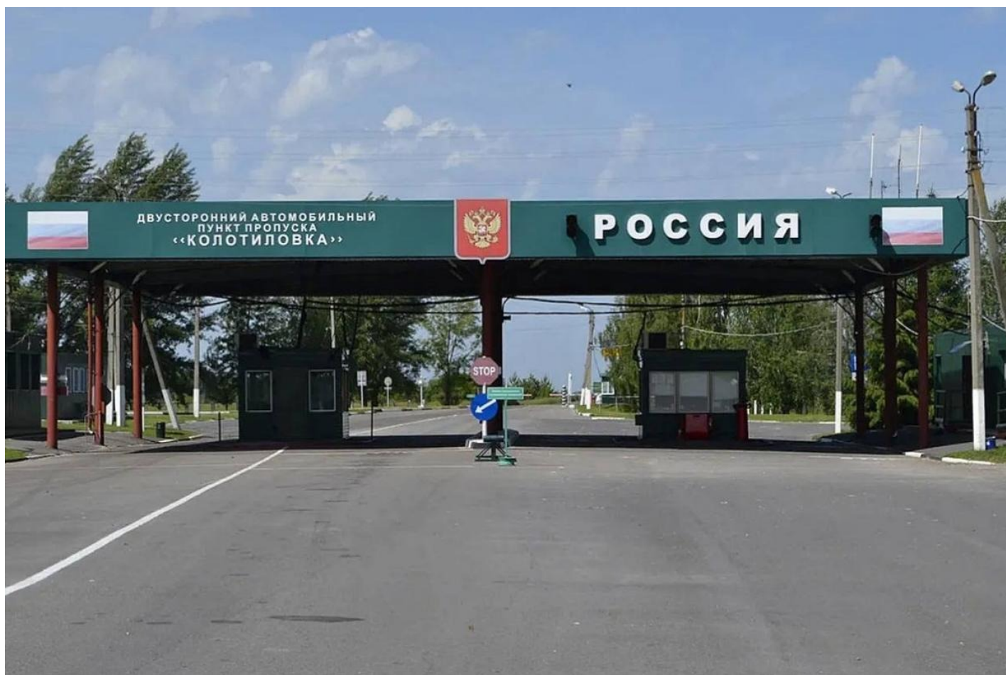
КПП «Колотиловка», 2020 год.

Колотиловка — последний действующий КПП между Россией и Украиной. Каждый день на площадке перед этим КПП собирается огромное количество людей. Это украинцы, которые из оккупированных территорий выехали в Россию (зачастую это было единственное направление, по которому вообще можно было выехать). Теперь эти люди пытаются покинуть Россию и попасть в Украину. Сделать это напрямую можно только через Колотиловку, а Колотиловка — это ад.