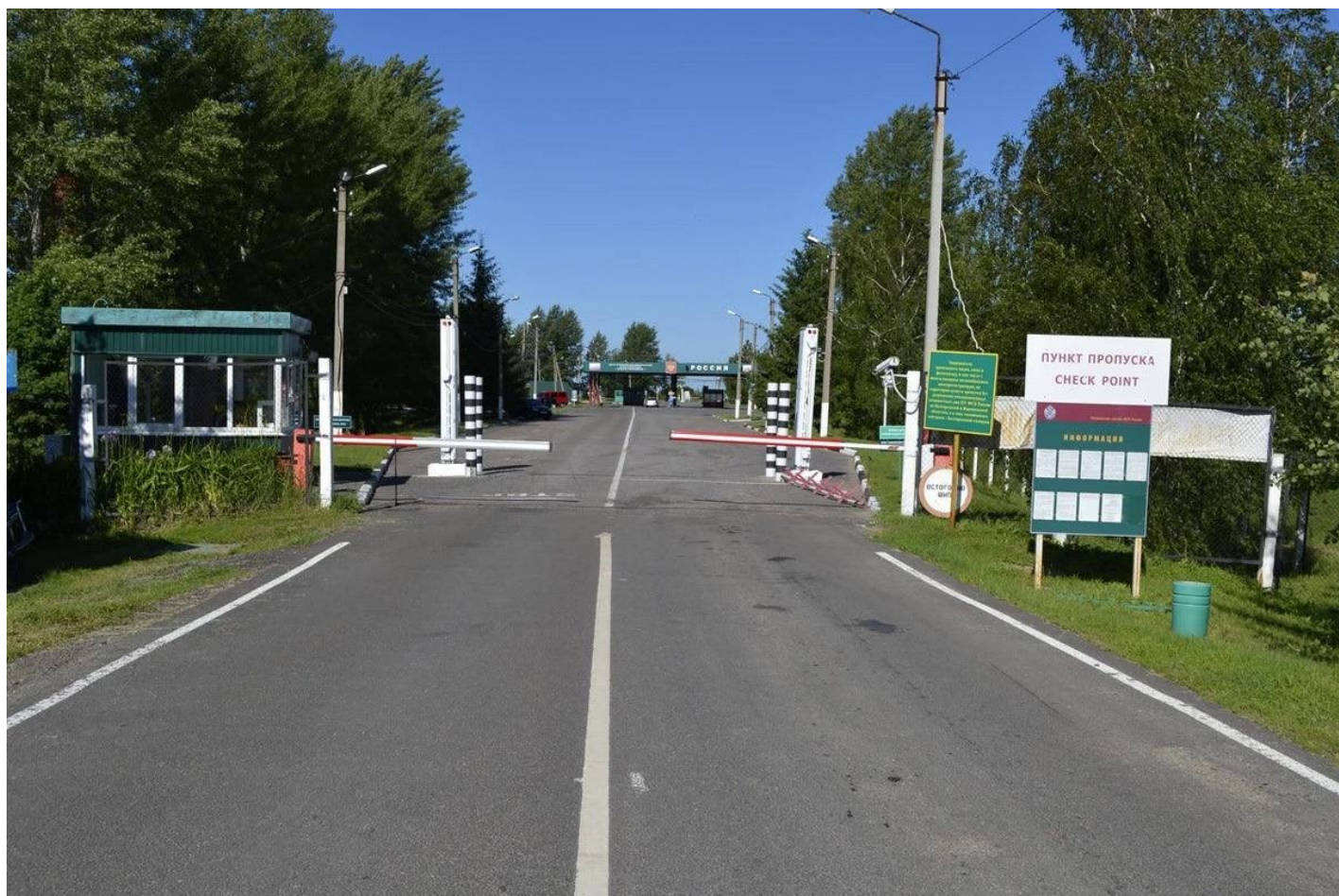
КПП «Колотиловка», 2020 год.