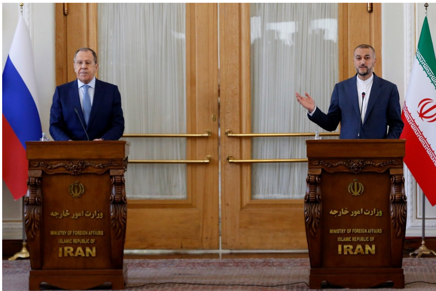
Министр иностранных дел Ирана Хосейн Амир-Абдулахиан (справа) и Сергей Лавров (слева) во время совместной пресс-конференции в Тегеране, Иран, 23 июня 2022 года.