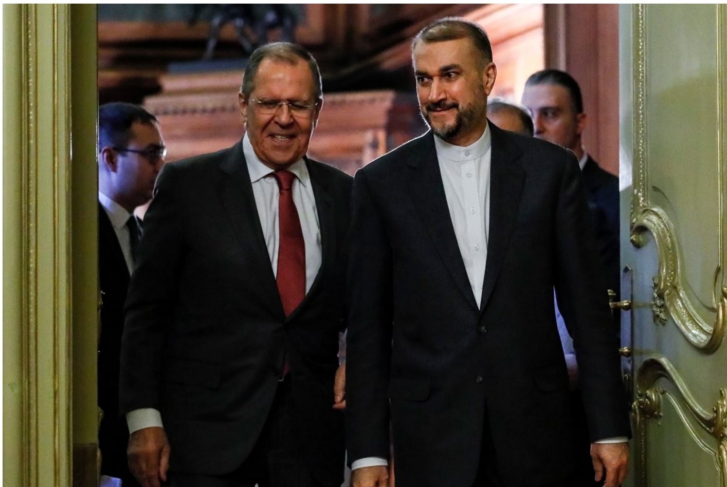
Министр иностранных дел Ирана Хоссейн Амир-Абдулахиан и Сергей Лавров, 29 марта 2023 года.

Так, по итогам 2023 года товарооборот между Россией и Ираном уже снизился по сравнению с предыдущим годом на 17% — до 4 млрд долларов. Одна из причин — уменьшение уровня поставок российской пшеницы на иранский рынок из-за высокой урожайности в самой Исламской Республике в минувшем году. Но есть и другие.