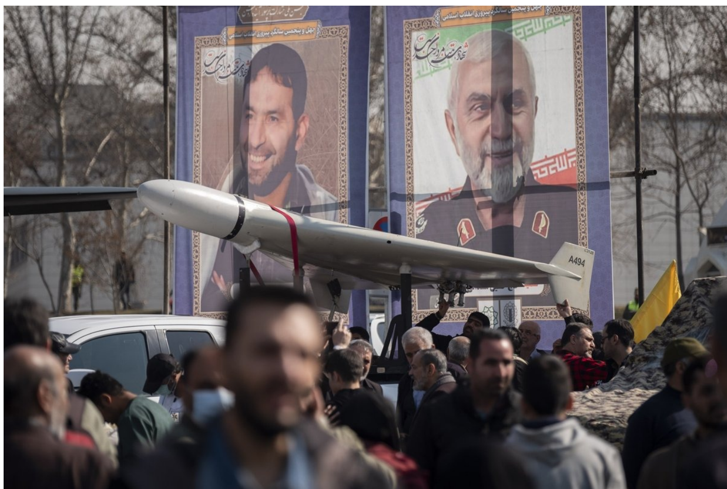
Беспилотный летательный аппарат иранского производства Shahed-136 демонстрируется под портретами убитых командиров КСИР на площади Свободы в Тегеране во время митинга в честь 45-й годовщины победы Исламской революции 1979 года, 11 февраля 2024 года.

Для привлечения иранских стройматериалов на российский рынок взамен покинувших его западных брендов Минстрой России и правда провел серию встреч с партнерами из Исламской Республики. По их результатам был сформирован список компаний, которые будут поставлять строительные материалы на российский рынок.