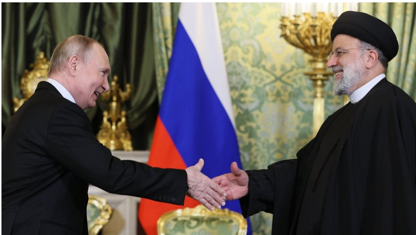
Владимир Путин (слева) и президент Ирана Эбрахиму Раиси во время их встречи в Кремле в Москве, 7 декабря 2023 года.

Последние два года обложенные санкциями Россия и Иран активно наращивают сотрудничество. Но только на словах. На деле мешают застарелые проблемы двух диктатур