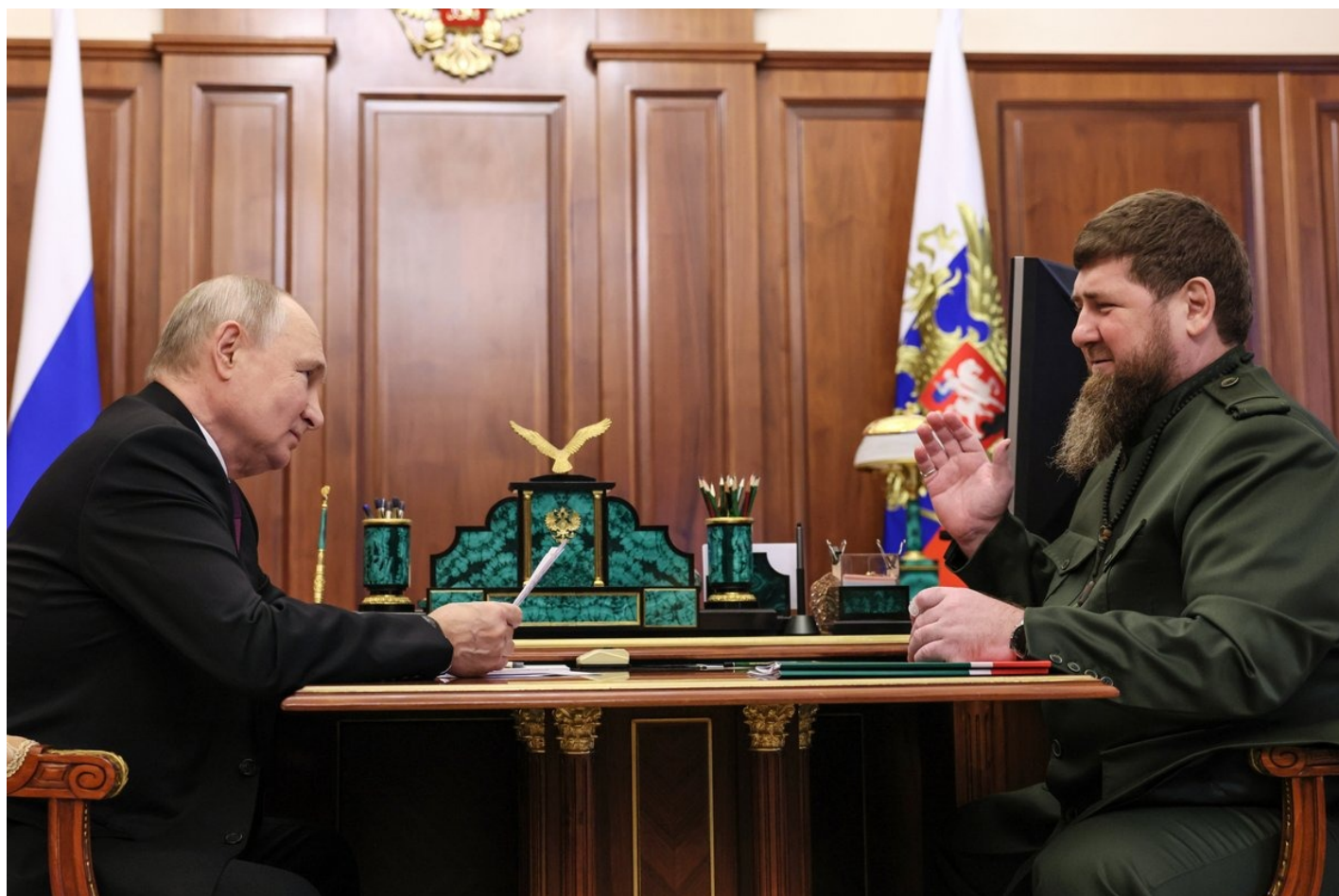
Владимир Путин (слева) беседует с Рамзаном Кадыровым во время встречи в Кремле в Москве, 28 сентября 2023 года.

Но в сентябре прошлого года к кризисной ситуации подключились уже федеральные пиарщики, которые посчитали, что одного Путина для устранения репутационного ущерба в данном случае будет мало. Поэтому в информационной кампании задействовали главу Росгвардии Виктора Золотова и министра МЧС Александра Куренкова, с которым у Рамзана Ахматовича сложились весьма доверительные отношения. Беседы с Золотовым и Куренковым (во время которых Кадыров фактически молчал, так как говорить у него получалось с большим трудом) выдали за «рабочие встречи» главы Чечни, находящегося «в длительной служебной командировке в Москве». Однако по интерьеру помещения, в котором проходили эти «рабочие встречи», журналисты быстро вычислили локацию — это был кабинет главного врача ЦКБ Управделами президента РФ. К федеральным «спасателям» присоединилась и Ксения Собчак, которая очень вовремя позвонила главе Чечни, и тот с