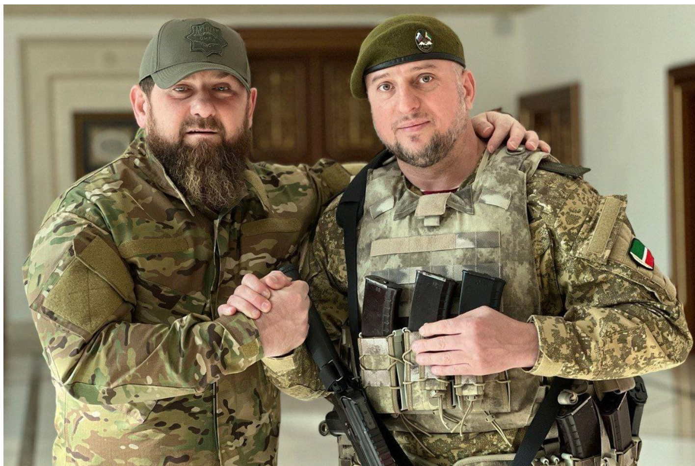
Рамзан Кадыров и Апти Алаудинов.

С идеологической точки зрения его речь, которая убедительно походила на настоящий экспромт, была абсолютно выверенной. Однако интонационно она резко контрастировала с агрессивной манерой других кадыровцев, которые не могут и рта раскрыть без угрозы на плохом русском языке «пустить пулю в лоб» или «голову отрезать». Алаудинов же предстал перед публикой цивилизованным чеченским силовиком, от чего мы за последние 17 лет почти отвыкли. Он артистично и точно использовал трибуну съезда «Единой России», сигнализируя аудитории: «Я — хороший чеченец!» Что интересно, рассуждая вслед за Путиным о традиционных ценностях и, конечно же, религии, Алаудинов пять раз подчеркнуто употребил слово «бог». Слово «Аллах» он в своем выступлении использовал только один раз, да и то сделал это скорее вынужденно, когда под аплодисменты закончил речь обязательной для всех кадыровцев речевкой: «Ахмат — сила. Россия — мощь. Аллаху Акбар».