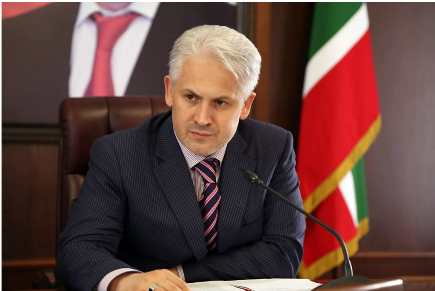
Муслим Хучиев.

обязанностей главы ЧР Председателю правительства ЧР Муслиму Хучиеву... Хвала Аллаху, организм у меня крепкий, капельницы ставили всего два дня. Всё теперь нормально. С 16 февраля в полном объеме выполняю свои должностные обязанности. И вам советую заниматься спортом, если желаете быстро справиться с разными недугами».