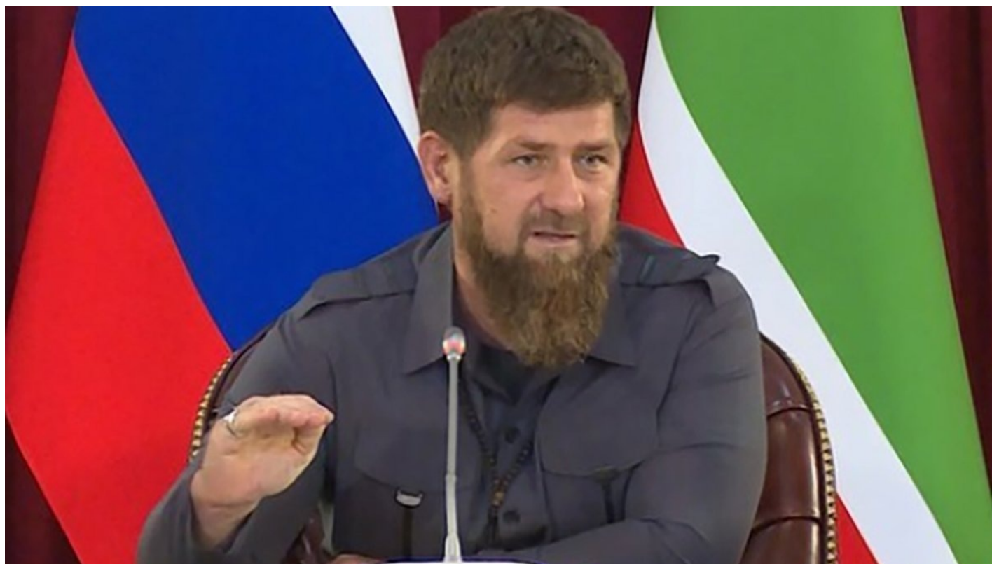
Заметно похудевший Рамзан Кадыров в 2019 году.

А летом 2020-го глава Чечни переболел ковидом и получил в нагрузку к основному заболеванию, развитие которого пытались купировать врачи ЦКБ, серьезные проблемы с эндокринной системой.