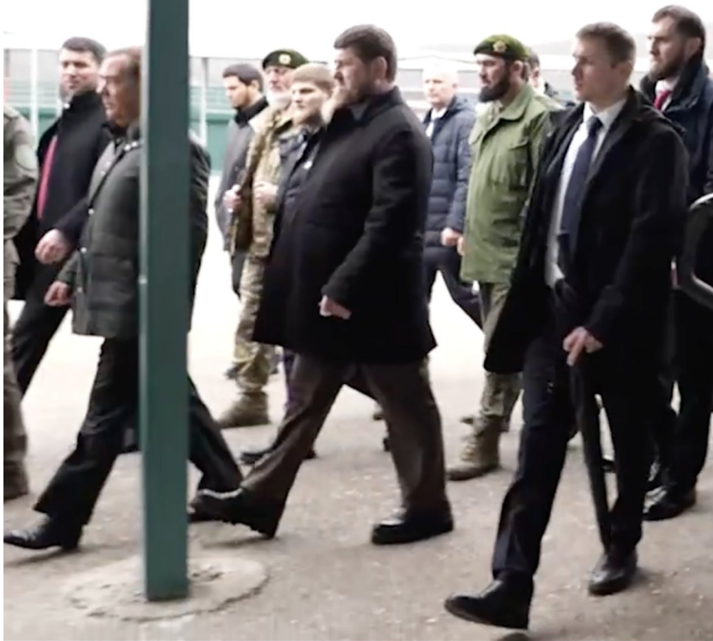
Визит Дмитрия Медведева в Грозный зимой 2024 года. На фото видна странная угловатая форма живота Кадырова. Стоп-кадр видео, находящегося в общем доступе

Но самое главное, он стал пропадать из публичного пространства в самые неподходящие для этого моменты.