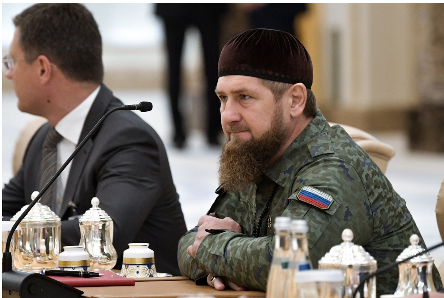
Рамзан Кадыров (справа) во время встречи Владимира Путина и наследного принца Абу-Даби, Объединенные Арабские Эмираты, 15 октября 2019 года.

Однако злоупотребление этим препаратом может привести к угнетению дыхательной деятельности. Именно в таком остром состоянии, по словам наших источников, глава Чечни и был госпитализирован в сентябре прошлого года в ЦКБ Управделами президента. Для стабилизации дыхательной функции Кадырова подключили к ИВЛ, для чего ввели в медикаментозный сон. Такое состояние еще называют «медикаментозной комой». Собственно, отсюда и пошла слухи о коме чеченского лидера, хотя на тот момент благодаря высокопрофессиональным действиям врачей прямой угрозы для жизни пациента уже не было.