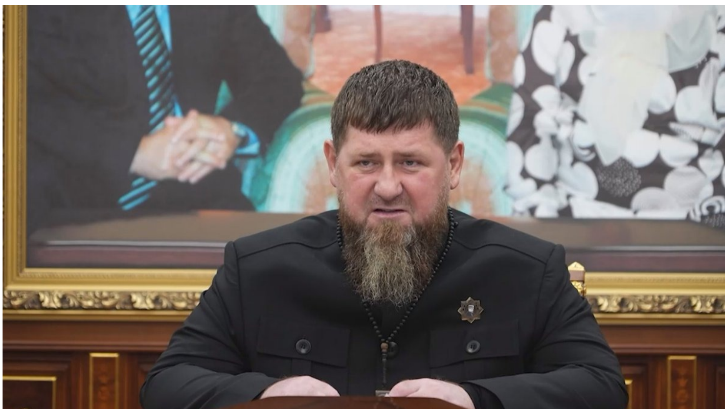
Рамзан Кадыров на совещании, 22 апреля 2024 года.

Зачем Путин встречался с сыном Кадырова, каковы шансы самых обсуждаемых претендентов и как глава Чечни стал апологетом феминизации республиканской политики