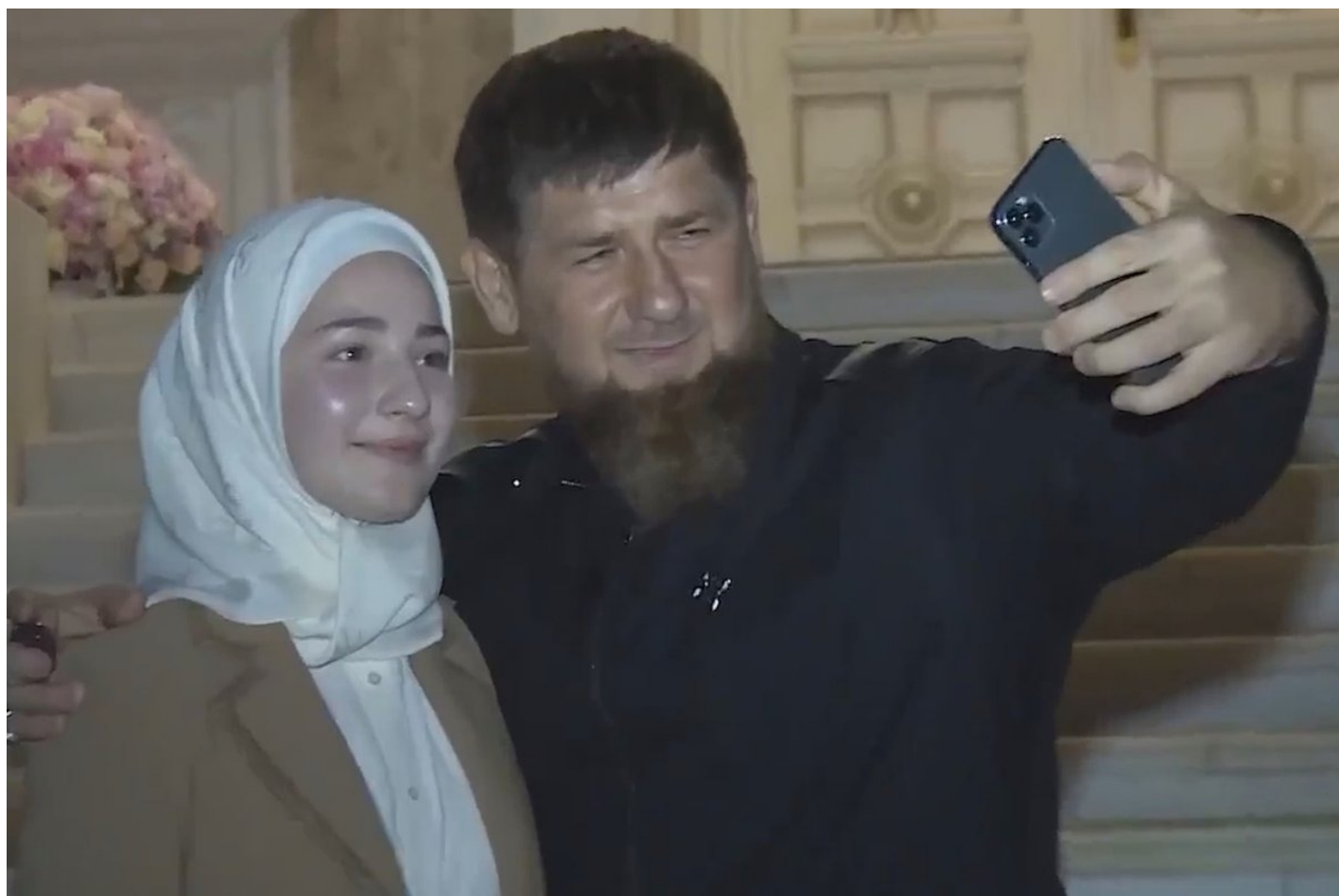
Рамзан и Табарик Кадыровы.

В последние годы по мере взросления дочерей Кадырова очень заметны попытки главы Чечни изменить привычную парадигму восприятия роли и места женщины в чеченском социуме. До революционных изменений в этом плане еще очень и очень далеко, и в Чечне с ее традиционным патриархальным укладом женщину-губернатора вряд ли воспримут «на ура».