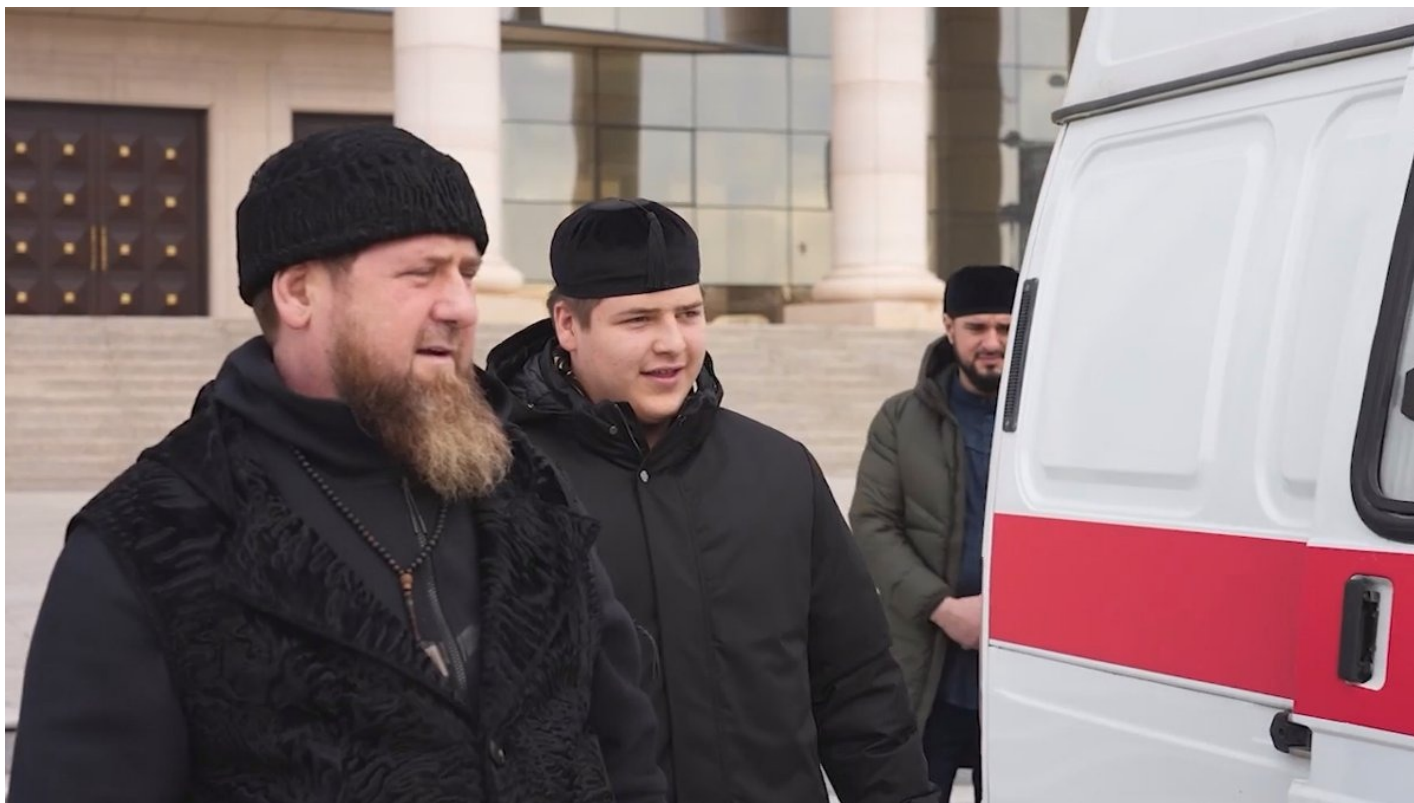
Рамзан Кадыров вместе с сыном Адамом осматривают машину скорой помощи, предназначенную для отправки в Украину, 2 февраля 2024 года.