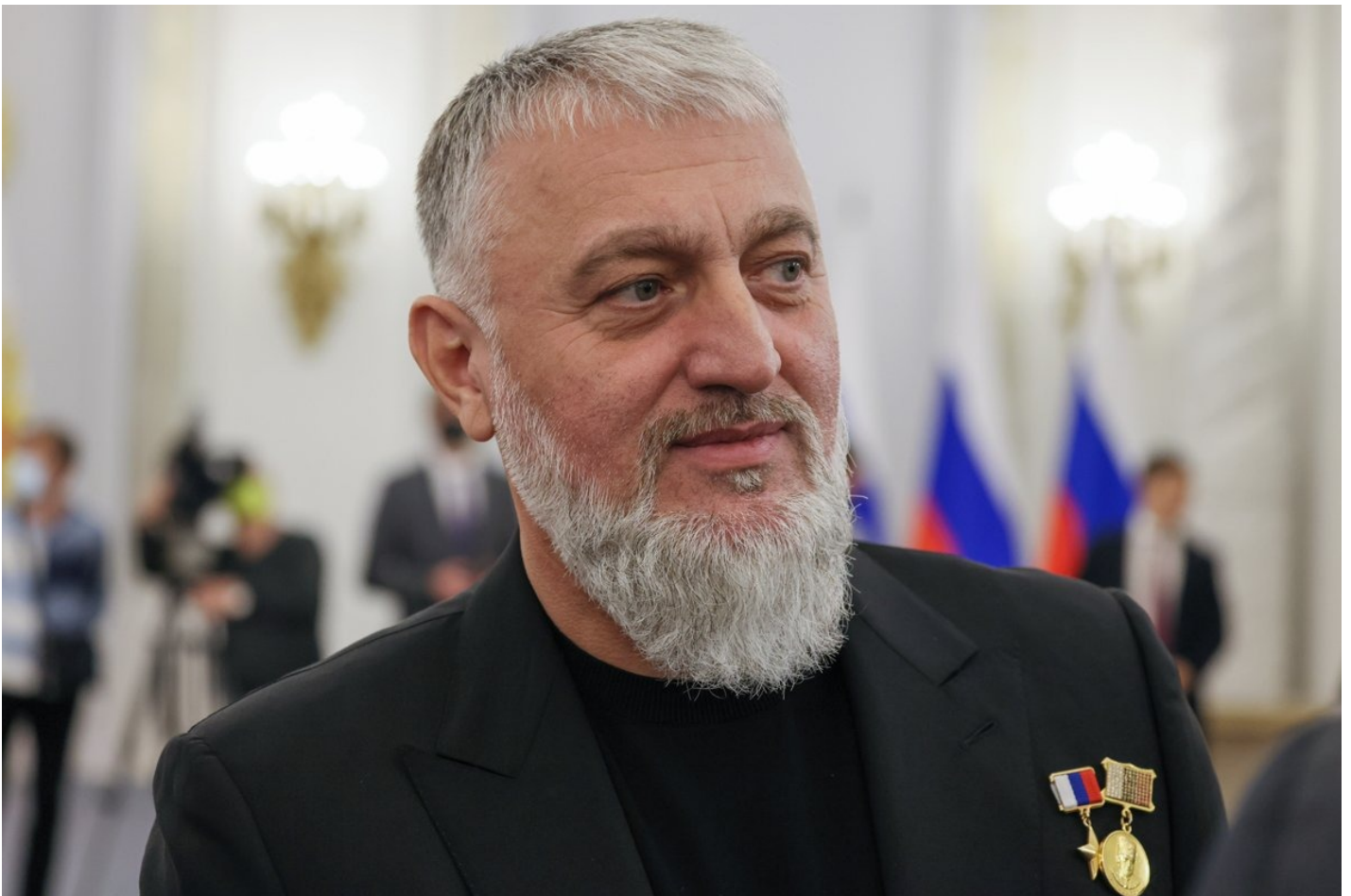
Адам Делимханов.

Собственно, именно из-за такой их мощи Кремль настолько легко сдал Кадырову на растерзание этих Героев России (трое из шести братьев Ямадаевых были удостоены данной награды, как, впрочем, и двое из четырех братьев Делимхановых): слишком они были опасны.