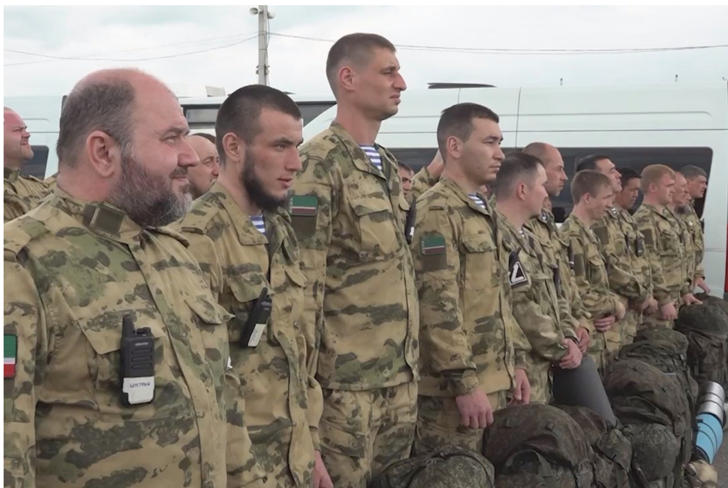
Добровольцы готовятся к отправке в Украину из Гудермеса.

личного состава чеченской полиции было сформировано несколько отрядов якобы для участия в военных действиях в Украине уже по линии МВД.