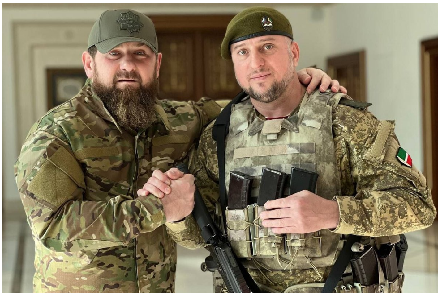
Рамзан Кадыров вместе с Апты Алаудиновым.

А 17 марта Рамзан Кадыров впервые за много лет неожиданно опубликовал совместную фотографию с опальным Апты Алаудиновым и сопроводил следующим комментарием: «Помощник Главы Чеченской Республики по силовому блоку, мой дорогой БРАТ Апты Алаудинов во главе тысячи добровольцев из Чеченской Республики отправляется для участия в спецоперации по денацификации и демилитаризации Украины».