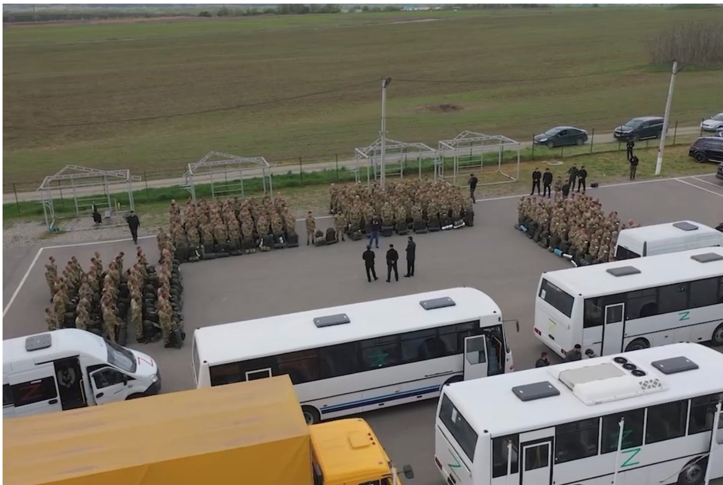
Добровольцы готовятся к отправке в Украину из Гудермеса.