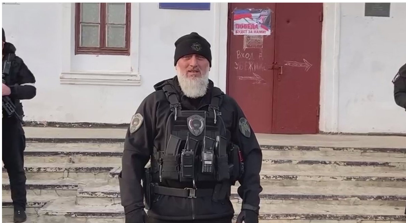
Адам Делимханов приветствует новых бойцов в Мариуполе, апрель 2022 года.

Именно ликвидация Байсарова положила начало длинной цепочке заказных убийств политических конкурентов Кадырова, что в итоге привело к абсолютизации его власти в Чечне.