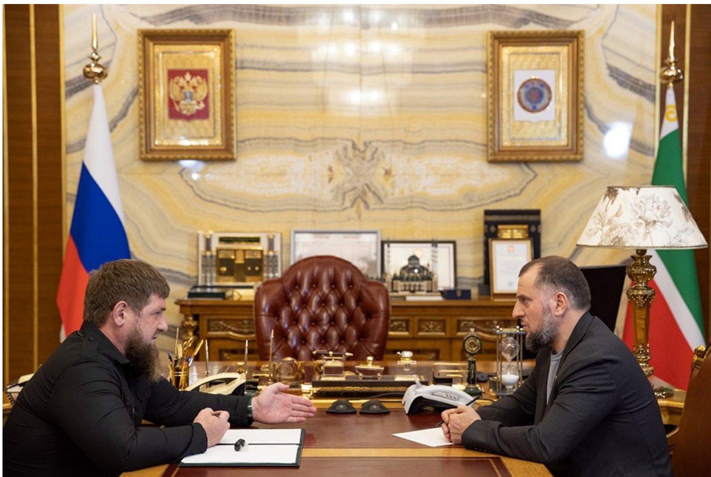
Рамзан Кадыров и Апти Алаудинов.

В одном из своих недавних интервью он говорил, что был против амнистии боевиков, и подчеркивал, что «плечом к плечу воевал с русскими против боевиков, против международного терроризма».