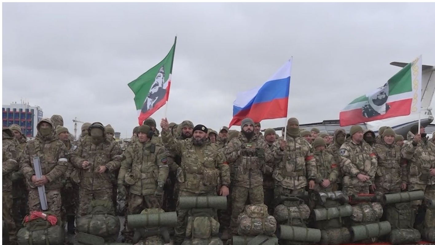
Отправка добровольцев из Грозного на войну в Украину, 20 марта 2024 года.

И по тому, каким образом чеченцы в качестве добровольцев попадают в алаудиновский интернациональный «Ахмат», можно судить о настоящем отношении Кадырова к войне в Украине.