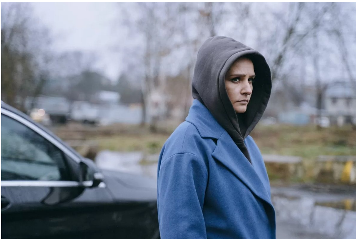
Кадр из сериала «Обоюдное согласие».

Рассказанная во втором сезоне история — не менее актуальна. Согласно исследованиям , до 79% российских женщин, которых судили за насилие в отношении мужчин, заявляли о самозащите. Почти в половине из этих случаев суд подтверждал, что поведение потерпевшего было противоправным, но всё равно приговаривал женщин к сроку за умышленное насилие. Налицо неспособность правоохранительных органов защитить пострадавших и, как следствие, недоверие пострадавших к системе.