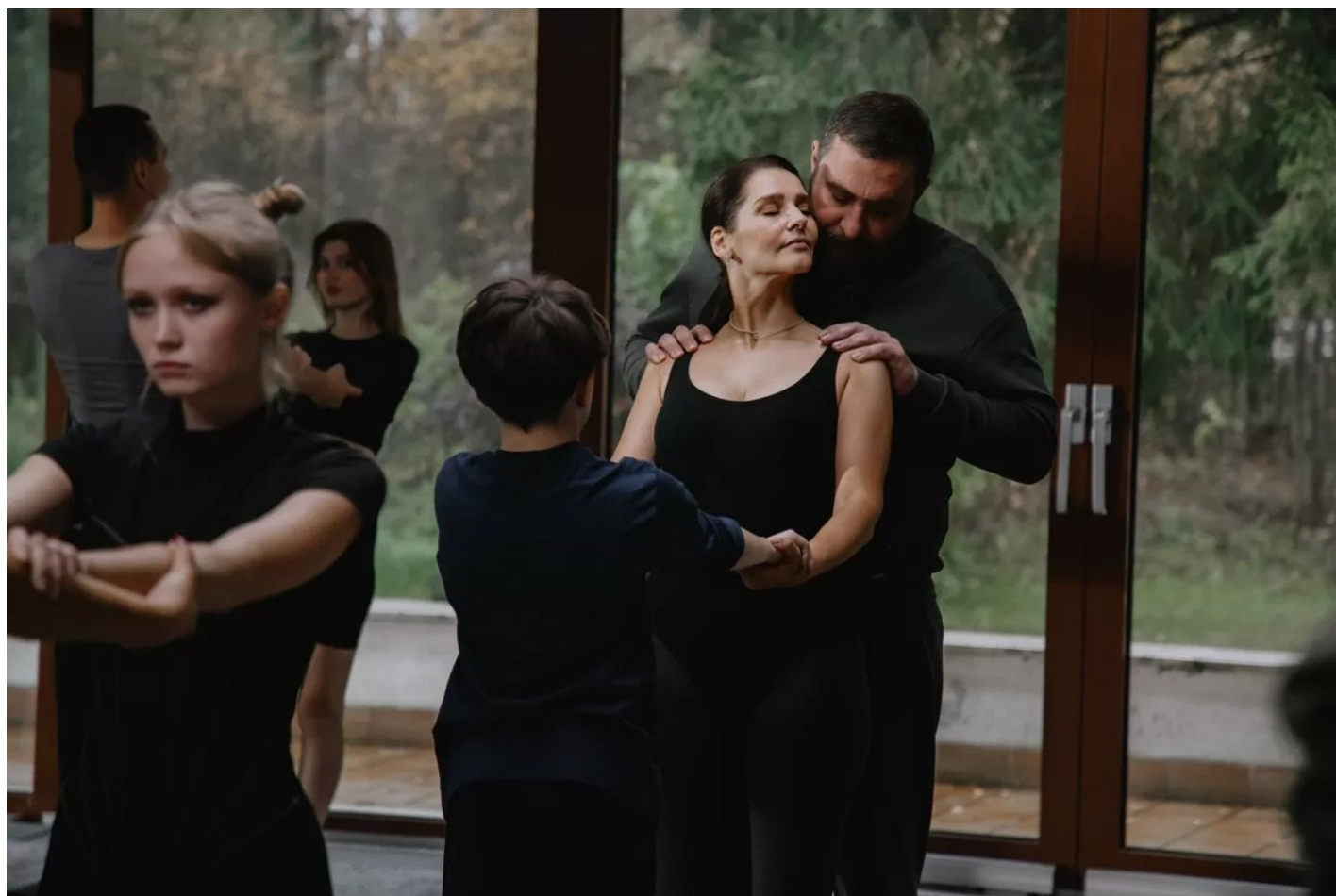
Кадр из сериала «Обоюдное согласие».

В продолжении зрителей знакомят с новыми действующими лицами. Григорий Венишев — глава медицинского центра, где лечат по его уникальной методике. Гений своего дела, он помог тысячам зажиточных клиентов обрести гармонию с собой. В личной жизни у гуру также всё в полном порядке. У него есть жена Марина и трое замечательных детей — младший ребенок еще не умеет ходить. Окружающим семья Венишевых кажется безупречной. Идиллия рушится, когда на годовщину свадьбы Григория убивают кухонным ножом возле подъезда. Подозрения падают на Марину, которую полицейские на следующий день отправляют в СИЗО. Вести резонансное дело поручено следовательнице Анне Клинских, известной своим черствым характером, тогда как защищать подозреваемую берется именитая юристка Ида.