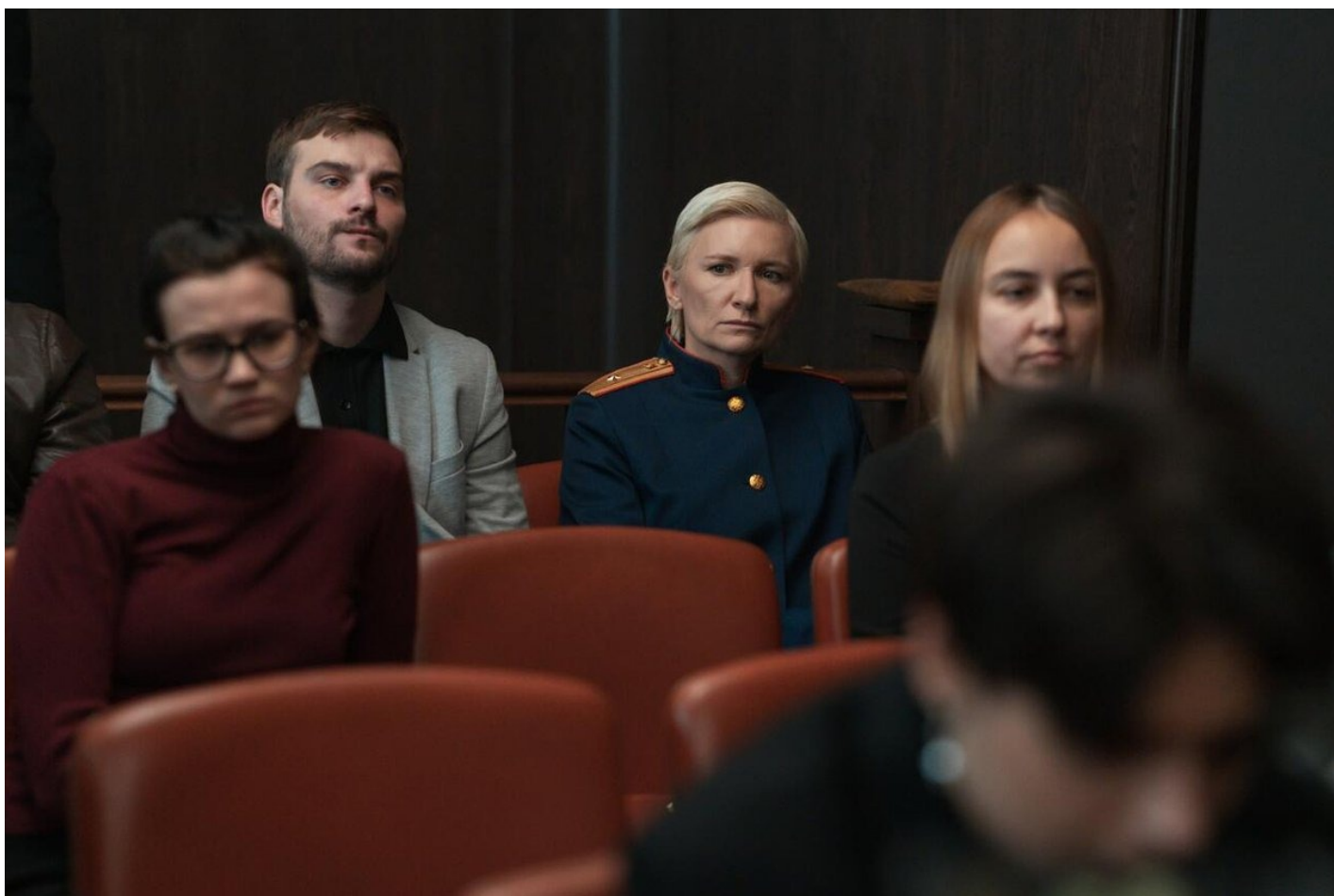
Кадр из сериала «Обоюдное согласие».

В первых же сериях постановщица разом надавила на все болевые точки общества, описав ситуации, не понаслышке знакомые многим женщинам. Так, полицейские с порога пытаются отговорить жертву изнасилования от подачи заявления: мол, всё равно суд не выиграешь, да и вообще ты была в состоянии алкогольного опьянения. Мать жертвы больше заботится о том, что о ней подумают соседи по лестничной площадке, нежели о чувствах дочери. А когда дело придается огласке, жертва, как водится, сталкивается с виктимблеймингом: «Раз изнасиловали, значит — сама виновата», — заключают ученики, а взрослые при каждом удобном случае припоминают героине ее «провокационное» красное платье.