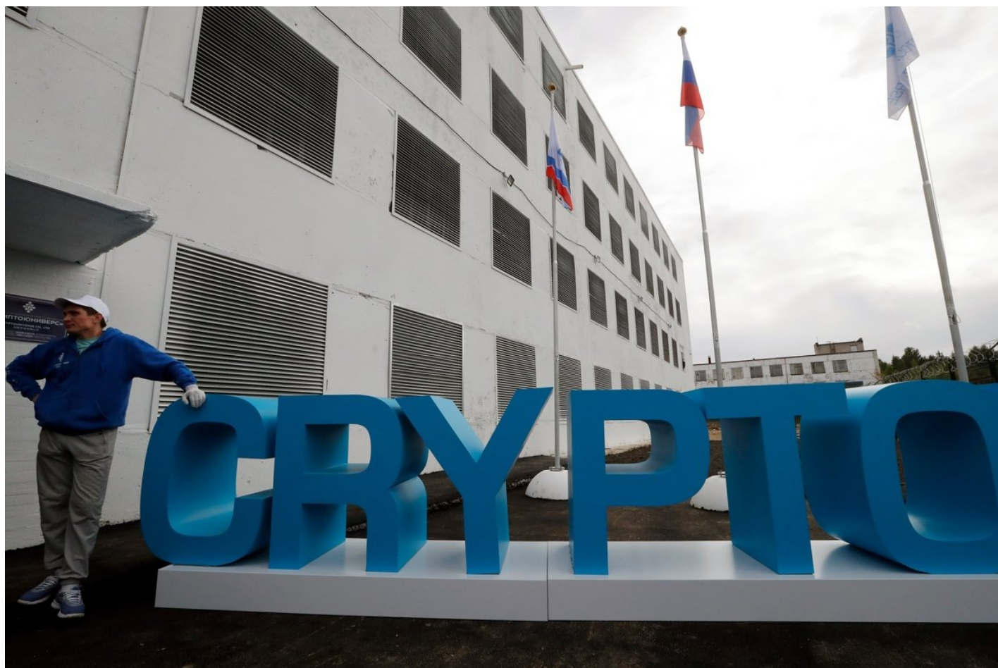
Вывеска «Свурто» у крупнейшего в России центра по добыче криптовалют в Киришах, Ленинградская область, Россия, 20 августа 2018 года.

Если даже в Китае, где CBDC ввели задолго до РФ, население, приученное веками подчиняться любому государственному произволу, подвергает «цифровой юань» невиданному ostracismу, то что говорить о России с ее вечной фигой для властей предрержащих в карманах обывателей?