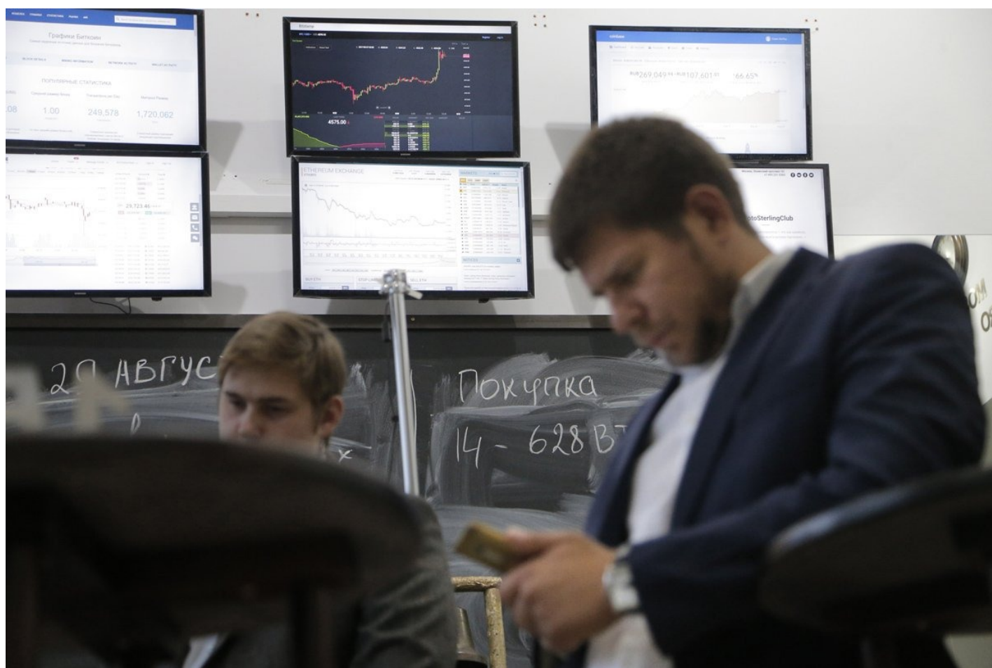
Криптовалютная биржа в Москве.

Выбранный для комментария инфоповод может показаться читателю мемом Александра Твардовского («Это вроде как машина скорой помощи идет: сама режет, сама давит, сама помощь подает»): журналисты, мол, высосали каламбур из пальца и сами же его развенчали. Однако непосредственно факт переполоха, вызванного пусть даже и ошибочным прочтением законодательной поправки, заслуживает, как мне видится, серьезного внимания, ибо свидетельствует о беспрецедентной в историческом отношении важности криптовалютной темы.