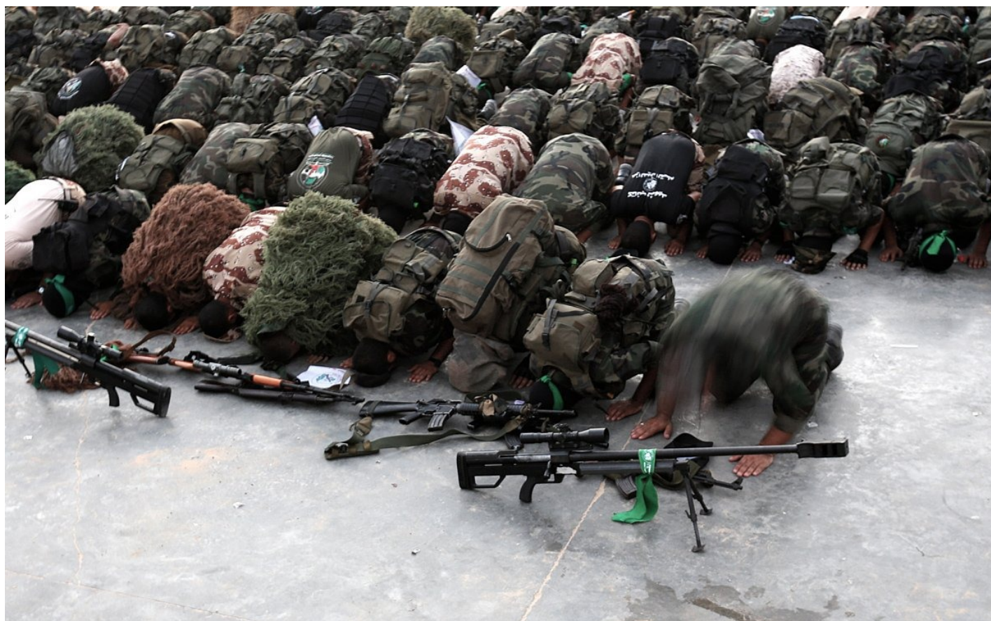
Палестинские бойцы ополчения «Эзз аль-Дин аль-Кассам», военного крыла движения ХАМАС, молятся рядом со своим оружием после парада на улицах Бейт-Хануна на севере сектора Газа, 11 августа 2015 года.

Интересный факт, который нельзя произносить в приличном обществе. ИГИЛ существует, потому что Саудовская Аравия вложила очень много денег, чтобы возродить суннитское движение против шиитов. В Ираке после Саддама Хусейна они начали поднимать голову. В Ираке шиитское большинство, а Хусейн был суннитский лидер, который сдерживал шиитов. Его свергли, и суннитское население оказалось в невыгодном положении: мало того, что они являются меньшинством, так теперь еще и большинство ополчилось против них. Пришлось суннитов спасать. Тут происходит финансовое вложение. Саудовская Аравия заинтересована в том, чтобы Ирак не превратился в очередное поле игры Ирана. Эта война была проиграна достаточно быстро, но ИГИЛ берет эти деньги и растет. Если мы скажем, что это Саудовская Аравия виновата, она всё будет отрицать.