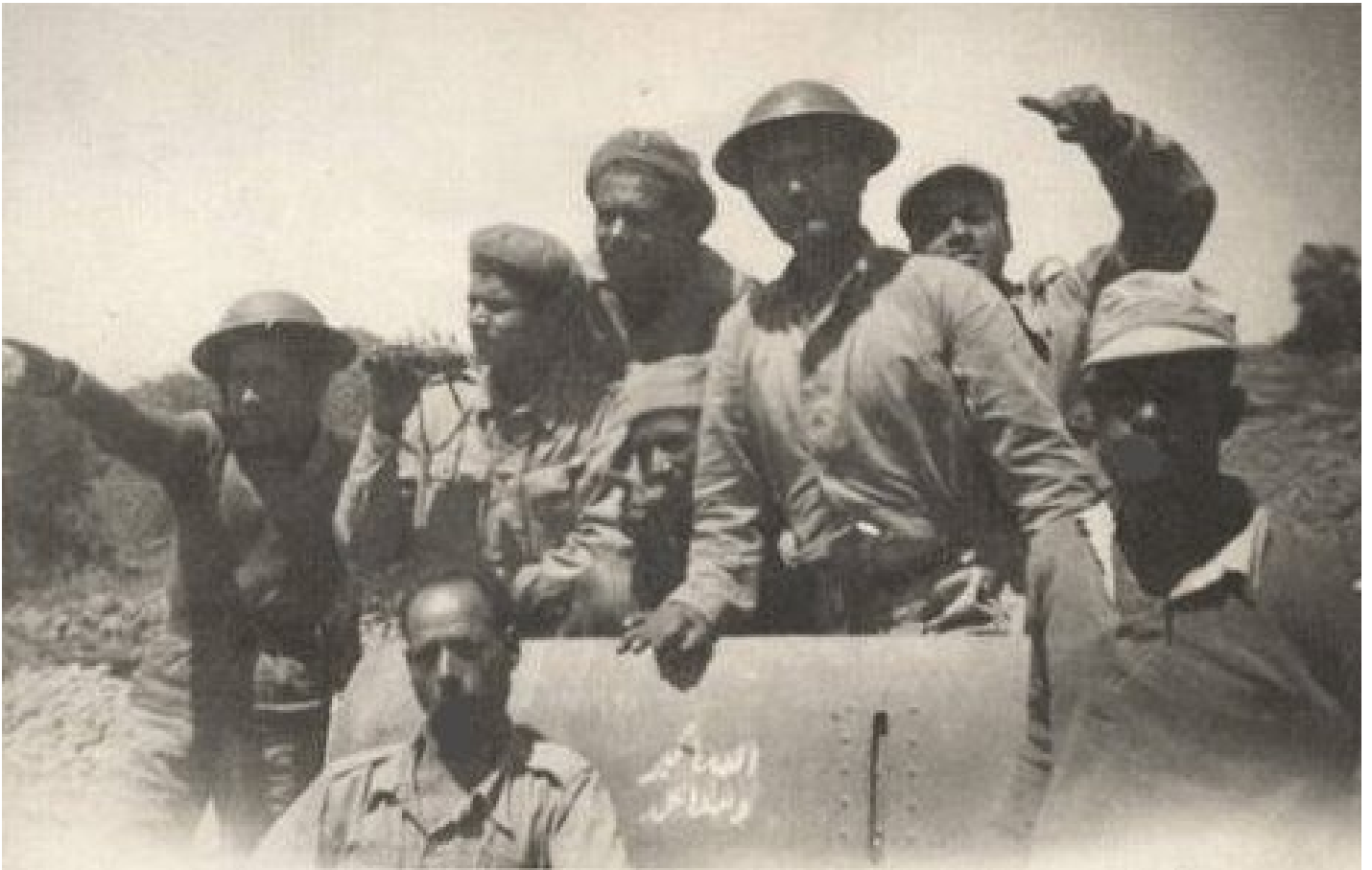
Боевики «Братьев-мусульман» в арабо-израильской войне 1948 года.

Сейид Кутб возвращается в Египет, становится религиозным мусульманином и присоединяется к движению. В какой-то момент он начинает говорить о том, что нынешнее светское правительство во главе с Насером незаконно, потому что оно не от Аллаха. Самое ужасное, что человеческие законы, которые это правительство проводит, контрпродуктивны, и по этой причине правительство нужно заменить, а лучше убить.