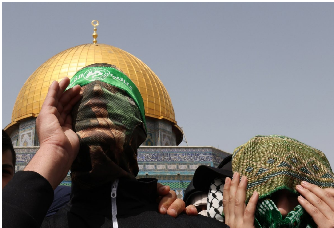
Палестинцы во время Рамадан в мечети Аль-Акса, 24 марта 2023 года.

— Да, конфликты были всегда. Было много разных ответвлений, особенно у шиитов. У шиитов секты являлись неотъемлемой частью религии много веков, но на сегодняшний день по количеству сект и ответвлений лидируют, наоборот, сунниты. Единственный случай в современной истории, когда кого-то называли хаваридж официально, — это были ИГИЛ; и самое смешное то, что их называла так самая радикальная организация, — и это «Аль-Каида».