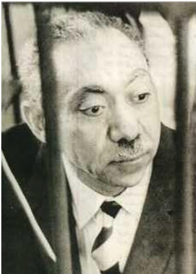
Сейид Кутб.