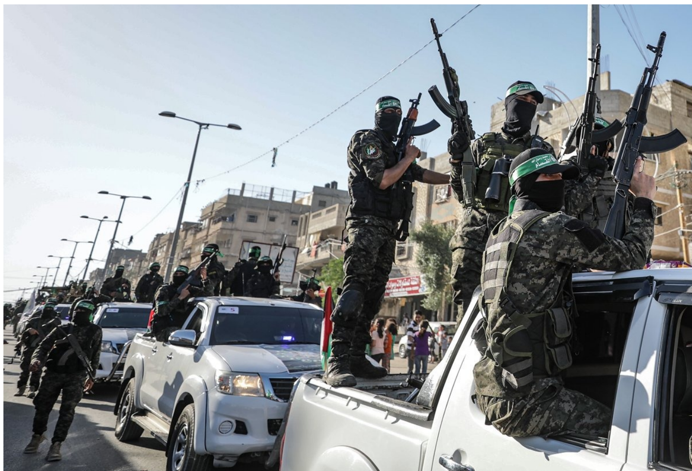
Бойцы бригады Изз ад-Дин аль-Кассам, военного крыла ХАМАС, на параде в городе Газа, 27 мая 2021 года.

Так вот в это же время Абдуллу Аззама обвиняли в том, что он построил настоящую машину джихада в Афганистане, а за Палестину не борется, какой же он после этого палестинец? Он ощущал огромную вину, и поэтому использовал интересный академический прием по шариату. Он объяснил при помощи различных фетв, что если идет долгий бой между Западом и исламом, или между любой другой цивилизацией и исламом, и бой происходит в разных регионах, то нужно выбрать один регион, где все должны сконцентрироваться, победить там, а уже потом идти в другие регионы. Он говорил, что Палестина — это будет вторая война, первая война — в Афганистане. Там есть шанс, есть деньги, есть люди. Таким образом, он призывал всех мусульман мира приехать в Афганистан, в Пешавар. В 1984 году там создается бен Ладеном офис моджахедов, чтобы они все приезжали туда и помогали выиграть войну против Советского Союза.