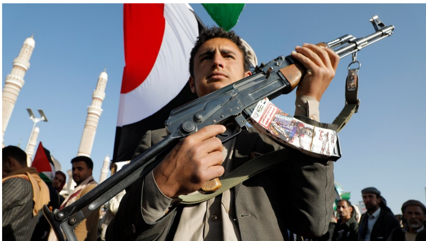
Мужчина держит автомат во время акции протеста в Сане, Йемен, 22 декабря 2023 года.

Исследователь современного исламизма объясняет Юлии Латыниной, почему религиозный фундаментализм остается популярным в современном мире