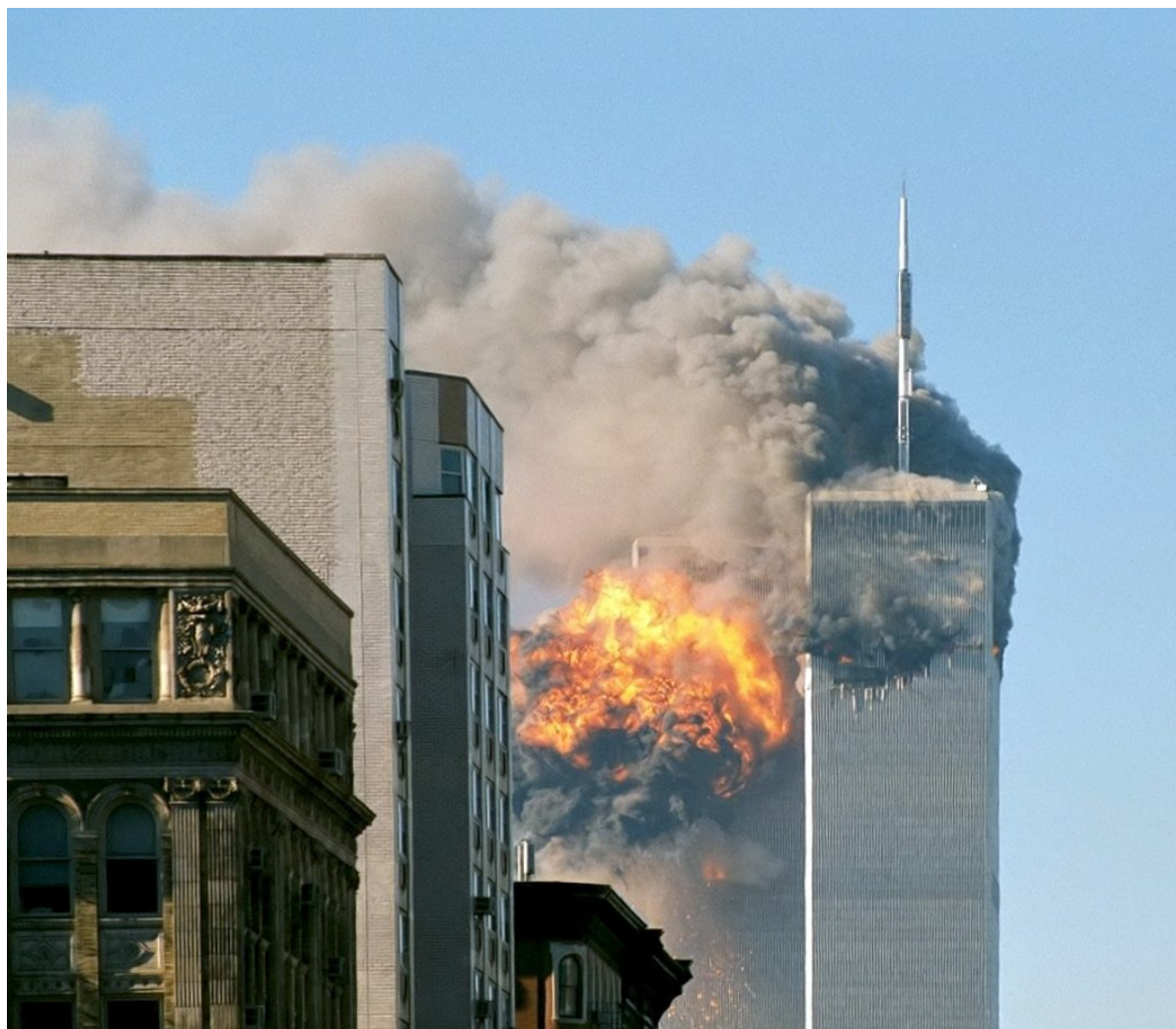
Взрыв в башне Всемирного торгового центра в Нью-Йорке во время теракта 11 сентября 2001 года.

похожая на то, что было 30 лет назад. Талибы, с одной стороны, с ИГИЛ заигрывали и дружили, с другой стороны — «филиал» ИГИЛ в Хорасане ополчился против талибов. До «Крокуса» последний нашумевший теракт был в Кандагаре, в Афганистане — против «Талибана». «Вилаят Хорасан» — это очередной анклав ИГИЛ, и не имеет значения, сидят они в Хорасане, или в Таджикистане, или в Африке, — их связи с глобальным ИГИЛ существуют. В данный момент ИГИЛ «Хорасан» является наиболее видимым анклавом. Вообще их много, просто мы о них не слышим. Они в основном совершают ужасающие теракты в Африке, а про Африку мало кто слышит.