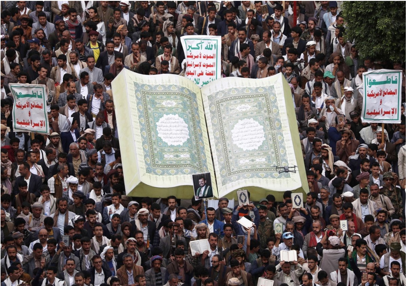
Йеменцы собираются вокруг макета Корана во время акции протеста против осквернения и сожжения Корана в Санае, Йемен, 24 июля 2023 года.

— Правильно ли утверждать, что в Коране нет разделения на мир ислама и мир войны, а придумал его Ибн Таймия?