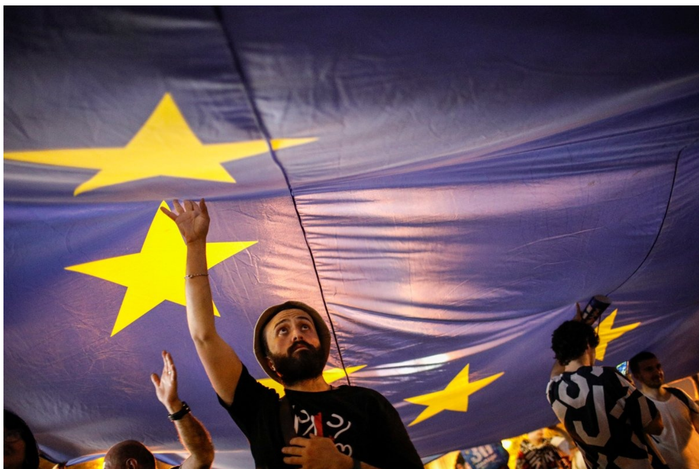
Сторонники оппозиции несут флаг ЕС во время акции протеста против законопроекта об «иностранных агентах» у здания парламента в Тбилиси, 28 апреля 2024 года.

Оказать правовую помощь всем задержанным обещают 50 неправительственных организаций. НПО сегодня распространили совместное заявление по поводу задержаний, в котором отмечают, что «Иванишвили начал репрессии, которые анонсировал во время своего выступления 29 апреля. Однако борьбу за европейское будущее страны невозможно победить методами российской службы безопасности».