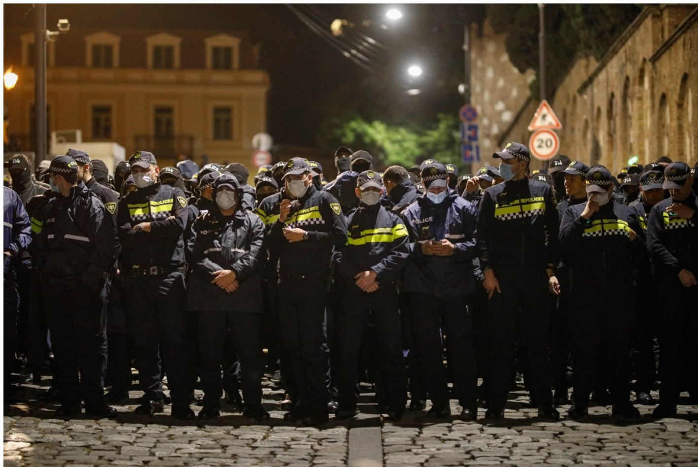
Полицейские перекрывают улицу во время акции протеста против законопроекта об «иностранных агентах» у здания парламента в Тбилиси, 7 мая 2024 года.