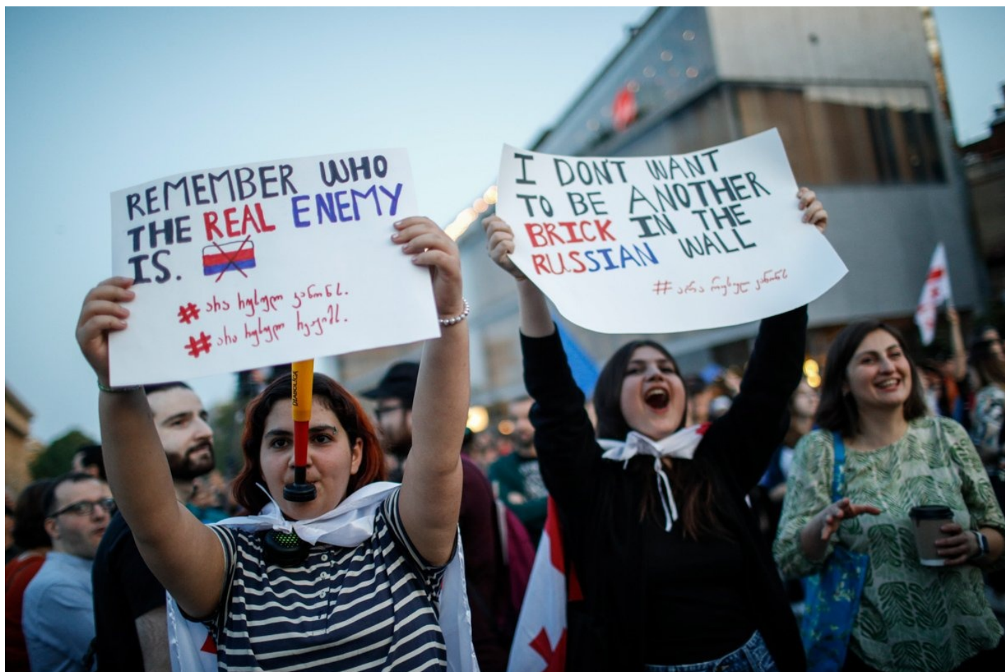
Сторонники оппозиции протестуют против законопроекта об «иностранных агентах» у здания парламента в Тбилиси, 28 апреля 2024 года.

Той же ночью кто-то «пометил» офисы оппозиционных партий и неправительственных организаций, даже на автомобилях несогласных с политикой правительства активистов появились профессионально напечатанные плакаты с надписями: «агенты», «враги народа», «агентурные штабы». Процесс расклейки плакатов попал на камеру видеонаблюдения партии «Гирчи».