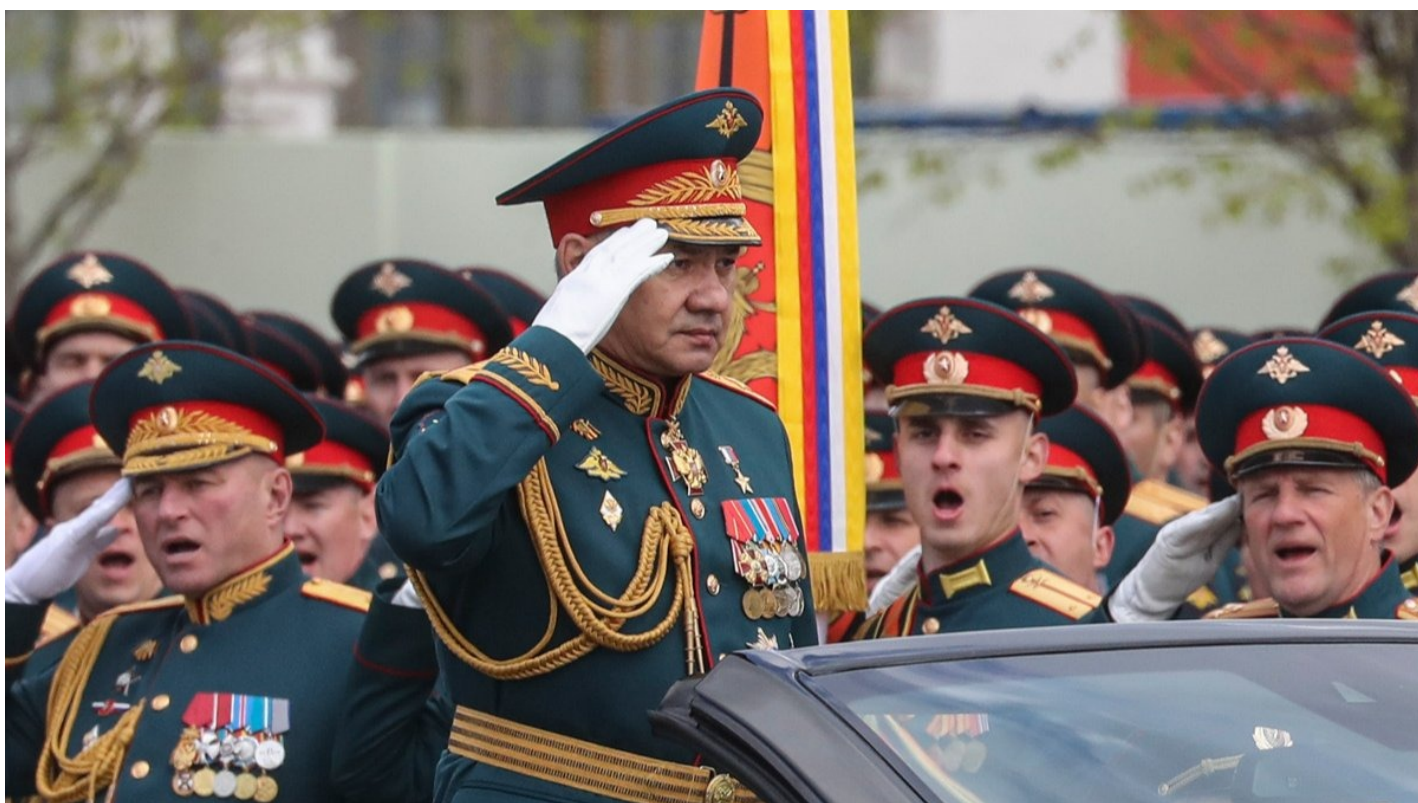
Сергей Шойгу принимает участие в параде на Красной площади, 9 мая 2022 года.

Что означает перевод Шойгу из Минобороны в Совбез. Объясняют политологи