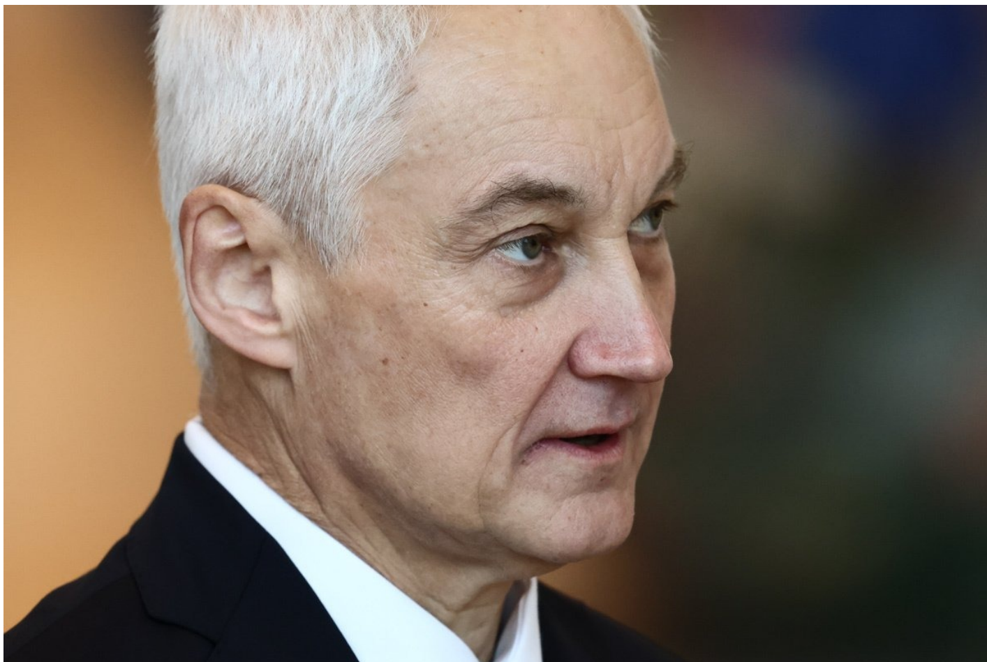
Андрей Белоусов.