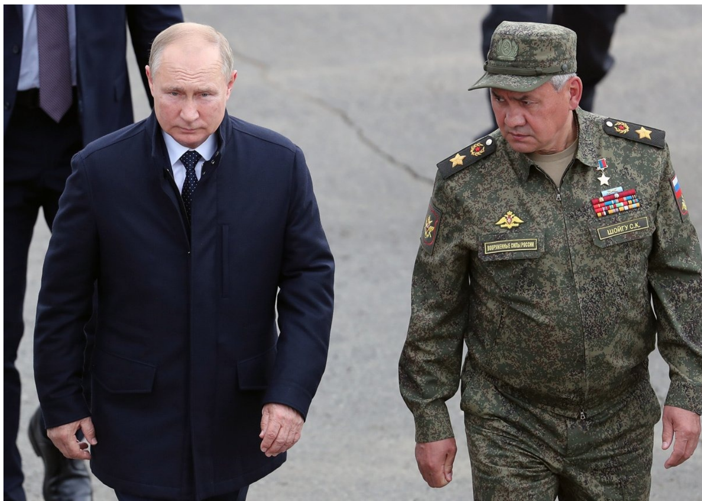
Владимир Путин и Сергей Шойгу.