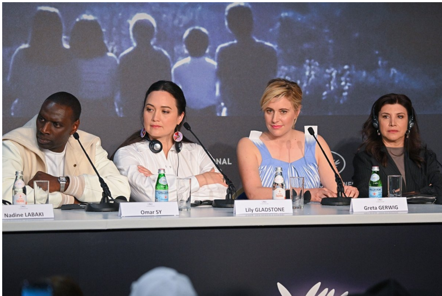
Жюри Каннского кинофестиваля, 14 мая 2024 года.

проект в 6 главах о чтении, писательстве и зрительском опыте, из которых было готово для экрана 36 минут. Редкое удовольствие увидеть сырой фрагмент work in progress, которая уже никогда не будет закончена.