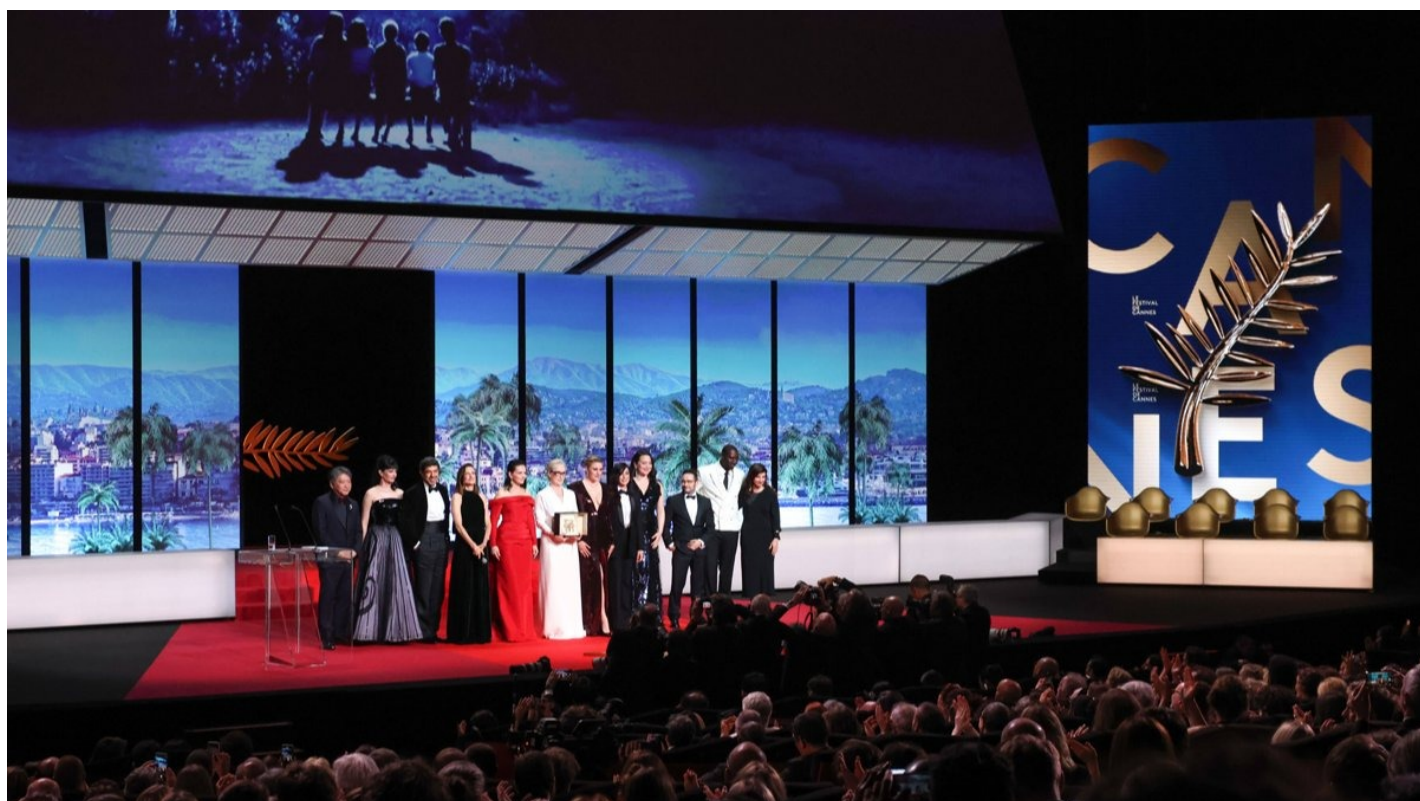
77-ый Каннский кинофестиваль в день открытия, 14 мая 2024 года.

20 самых ожидаемых фильмов Каннского кинофестиваля