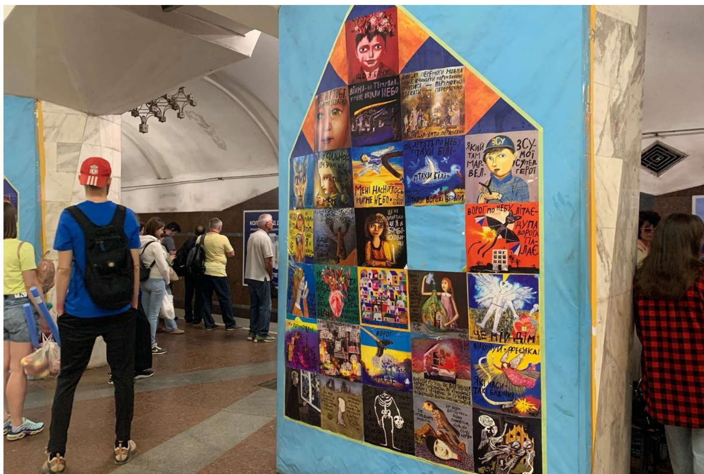
Станция метро «Исторический музей» в центре Харькова. Здесь дети прятались от российских ракет и рисовали.

В мэрии готовятся открывать подземные реанимационные и операционные отделения.