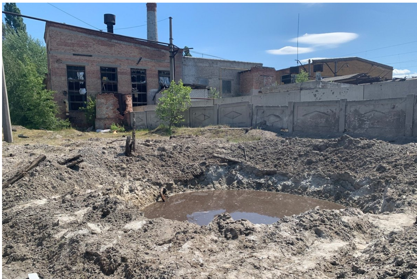
Воронка которая появилась после российского ракетного удара у типографии «Фактор-Друк».