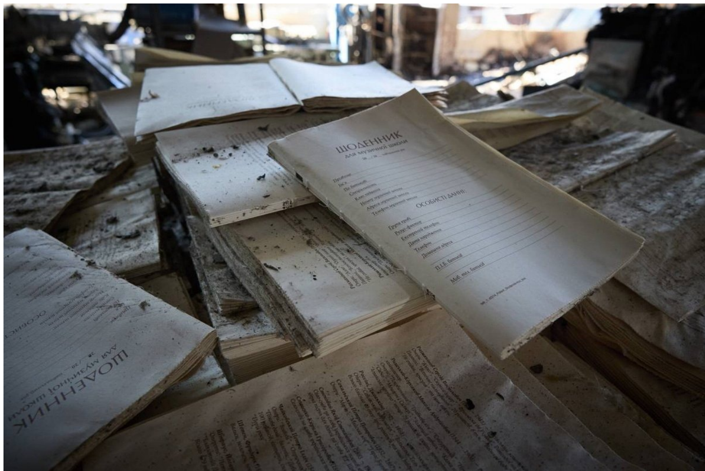
Уцелевшие дневники музыкальной школы на фоне сгоревших книг в типографии, 24 мая 2024 года.

Переплетный цех — это конвейер. Делали обложки, на сленге полиграфистов «крышки», ламинировали их, наводили позолоту, складывали, то есть «подбирали» листы будущих книг, сшивали блоки — всё автоматически, разумеется. Немецкое, швейцарское, итальянское оборудование экстра-класса. Часть пространства занимали стеллажи с полуфабрикатами и готовая продукция, попросту — бумага и картон, лучшая пища для огня.