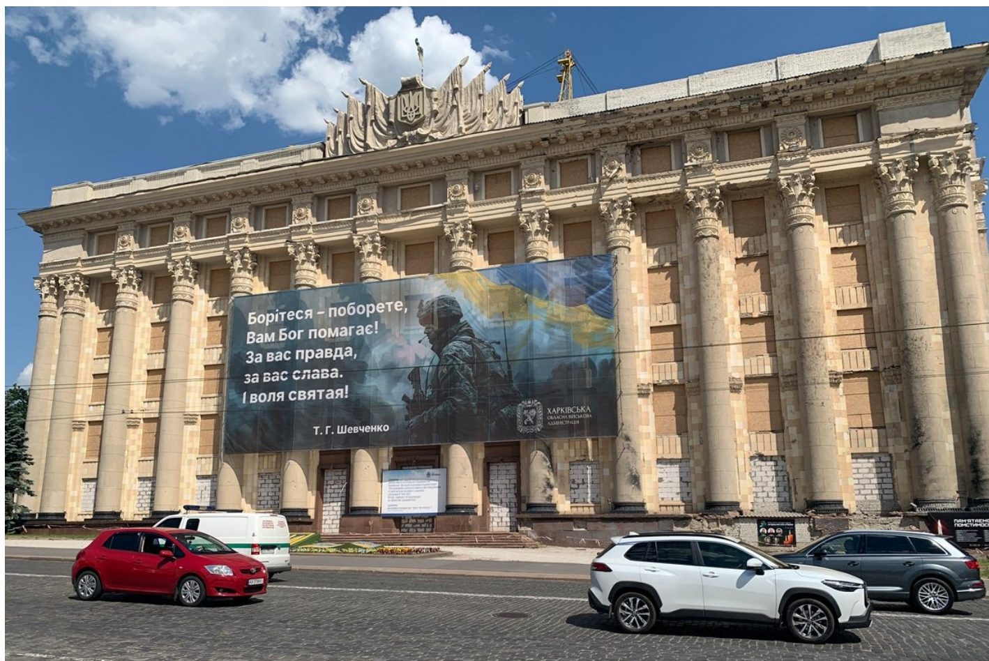
Здание областной военной администрации.

Сергей Яковлевич каждый день общается с коллективом «Фактор-Друк»: семьи погибших не останутся без поддержки. Сколько сотрудников преодолет психологическую травму— пока вопрос открытый.