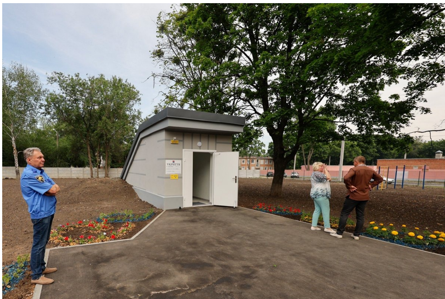
Вход в подземную школу в Харькове.

Сапронов — автор самого короткого лозунга дня, который я приведу, почти не отредактировав: «Хер вам, а не Харьков».