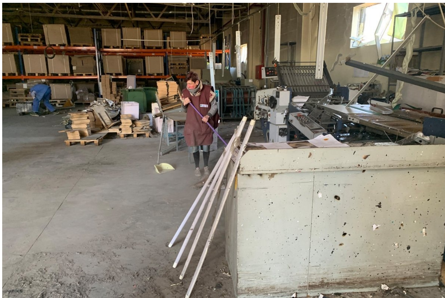
Сотрудники типографии делают уборку в переплетном цеху.