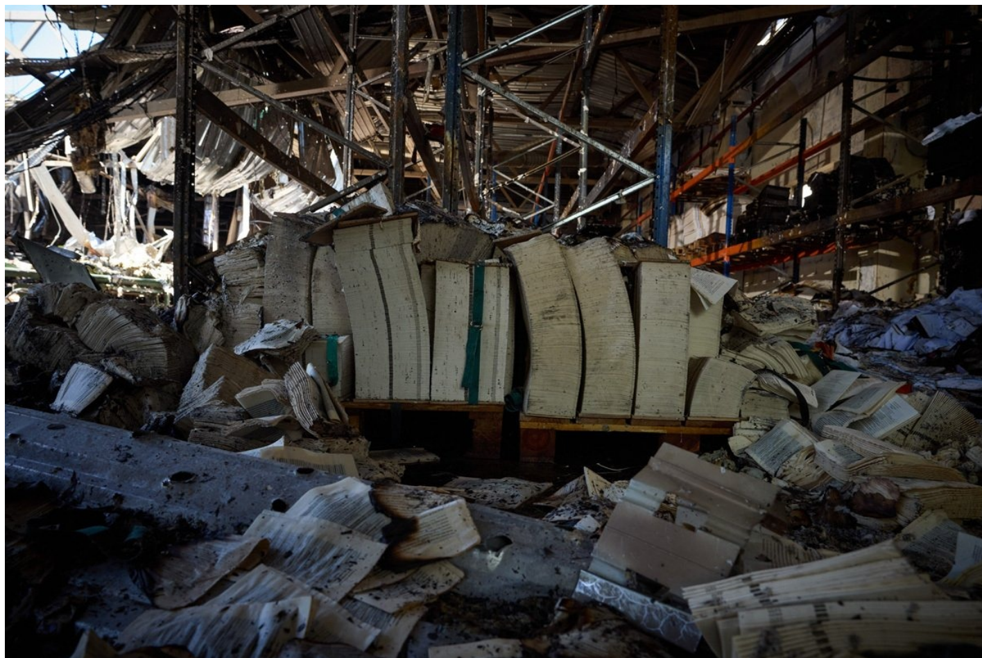
Остатки продукции типографии пострадавшие от обстрела, 24 мая 2024 года.

Директор по производству в 10:26 минует ряд машин, нигде не останавливаясь. Вспышка, дальше записи нет. Жив.