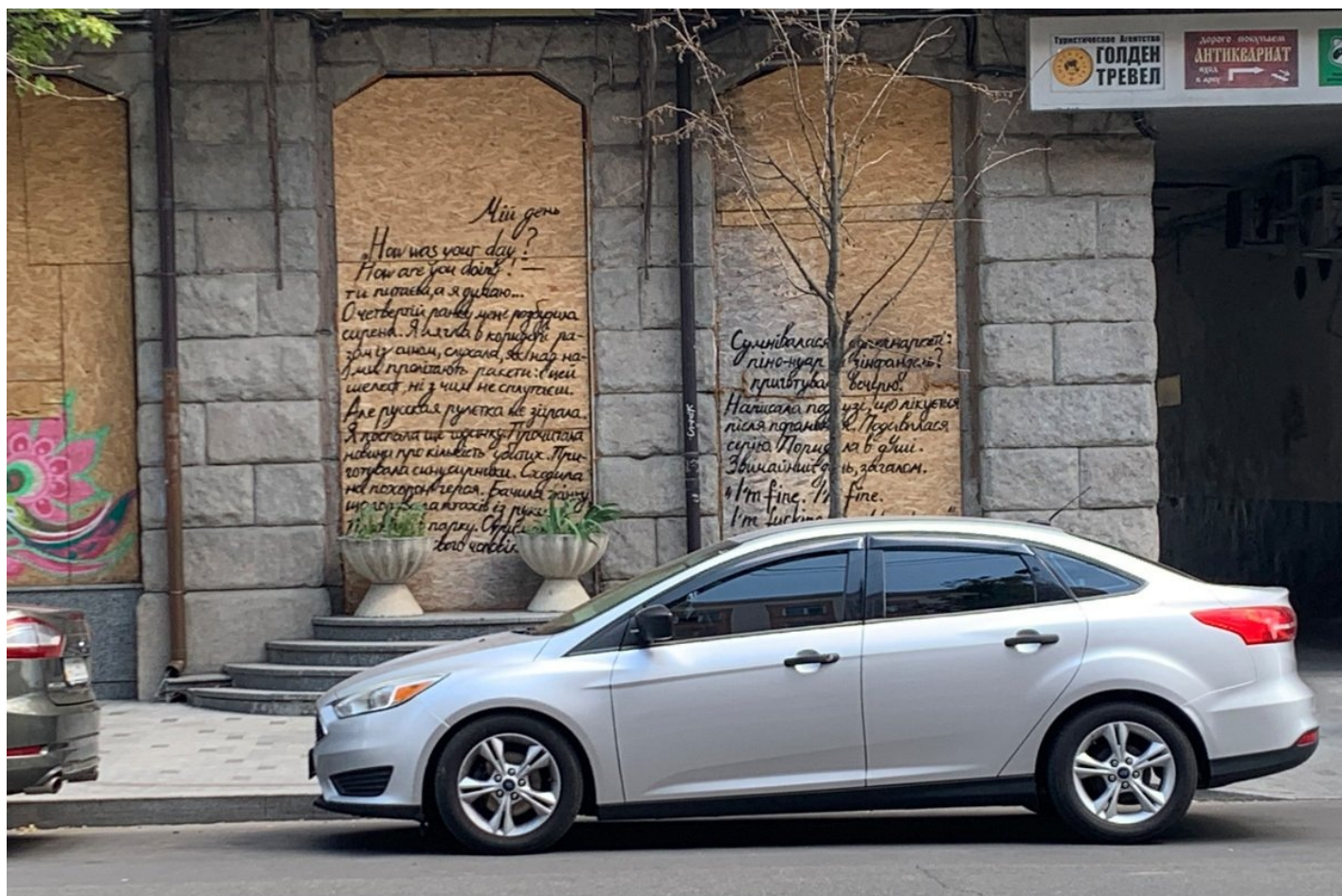
Щиты из фанеры, прикрывающие выбитые обстрелами окна, превращенные в арт-объекты в центре Харькова.

арт-объекты. Украшены то петриковской росписью (украинская декоративно-орнаментальная народная живопись. — Прим. ред.), то портретами и цитатами Григория Сковороды, то фрагментами из произведений Владимира Вакуленко или Виктории Амелиной, современных харьковских литераторов, погибших от рук российских военных.