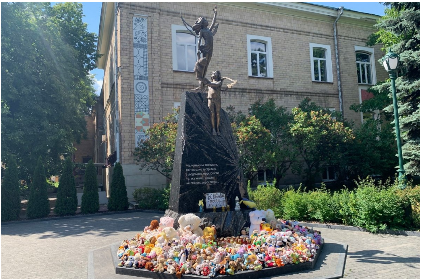
Монумент погибшим детям.