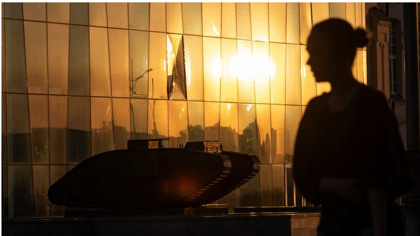
Британский танк Mark V времен Первой мировой войны около поврежденного фасада исторического музея на площади Конституции в центре Харькова, Украина, 27 мая 2024 года.

Репортаж Ольги Мусафировой из Харькова — из разрушенной российскими ракетами типографии, из подземной школы и подвальных арт-пространств