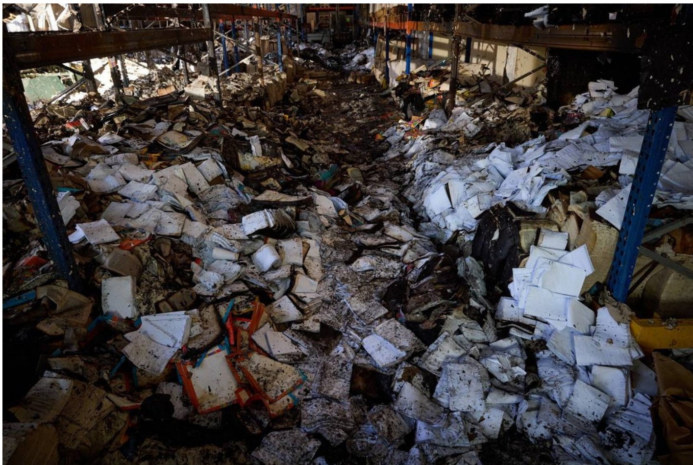
Последствия попадания С-300 в типографию, 24 мая 2024 года.