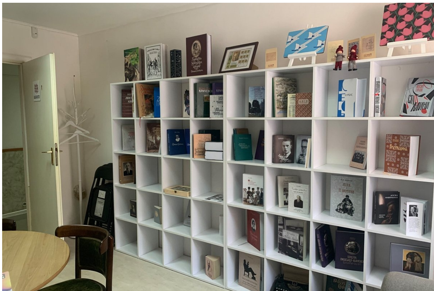
В «КнигоУбежище» собираются люди, которых интересует этнография, культурология, биографические очерки.

Когда Харьков расстреливала полевая артиллерия россиян, стоявшая чуть не сразу за городской чертой, в убежище спускались жильцы с верхних этажей. Моды на чтение, тем более «трудных» книг, не было даже у молодежи, замечает Савчук. Сейчас в «КнигоУбежище» несколько раз в неделю собираются не только студенты-культурологи и будущие философы. Заглядывают программисты, медики, люди, которых прежде мало занимало что-то еще, кроме узкопрофильных вещей.