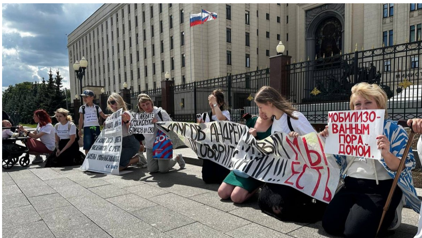
Акция родственников мобилизованных у здания Минобороны в Москве, 6 июня 2024 года.

Как сложилось российское движение жен мобилизованных, и почему в итоге оно раскололось на «прокремлевских» и «иноагентов»