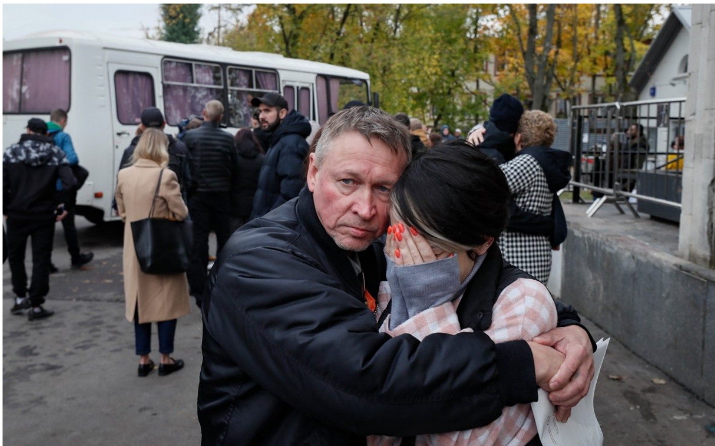
Родственники российских призывников у призывного пункта во время частичной военной мобилизации в Москве, Россия, 29 сентября 2022 года.