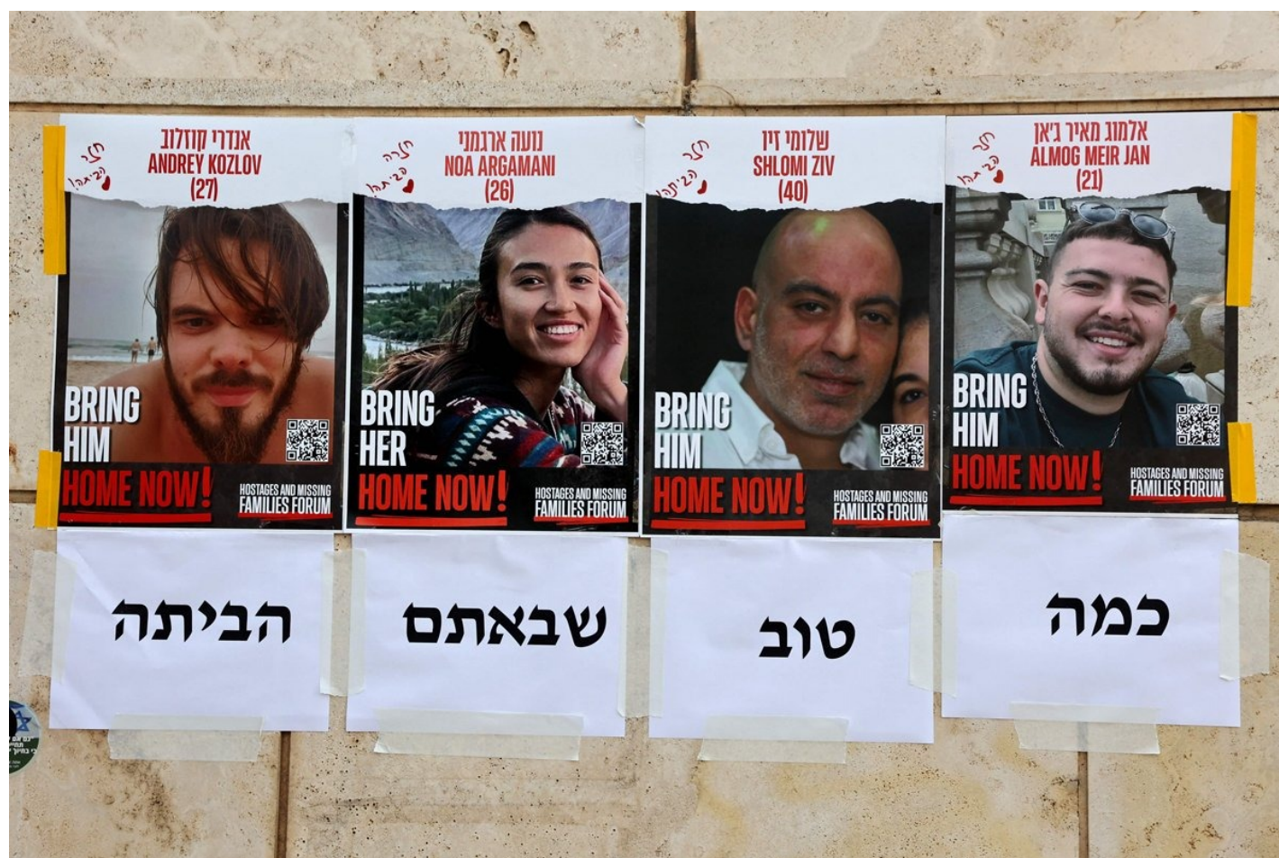
Плакаты с надписью «Немедленно домой», на которых изображены портреты четырех спасенных израильских заложников в Тель-Авиве, 8 июня 2024 года.

играет никакой роли. Но на самом деле иногда, как говорят, дьявол кроется в нюансах.