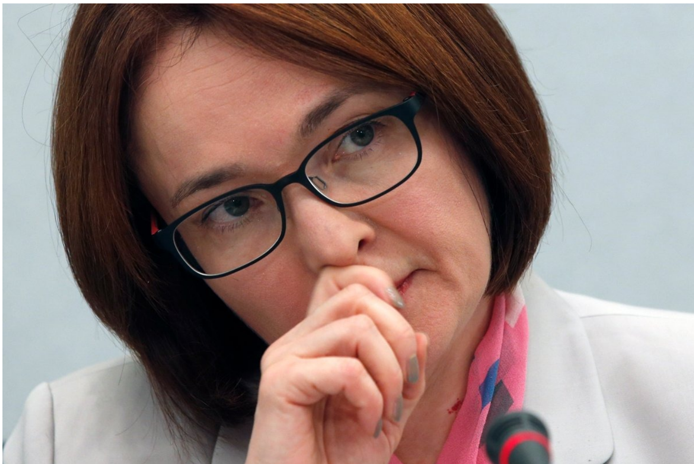
Председатель Центрального банка РФ Эльвира Набиуллина.

площадках, но не на бирже», — написал он в своем телеграм-канале.