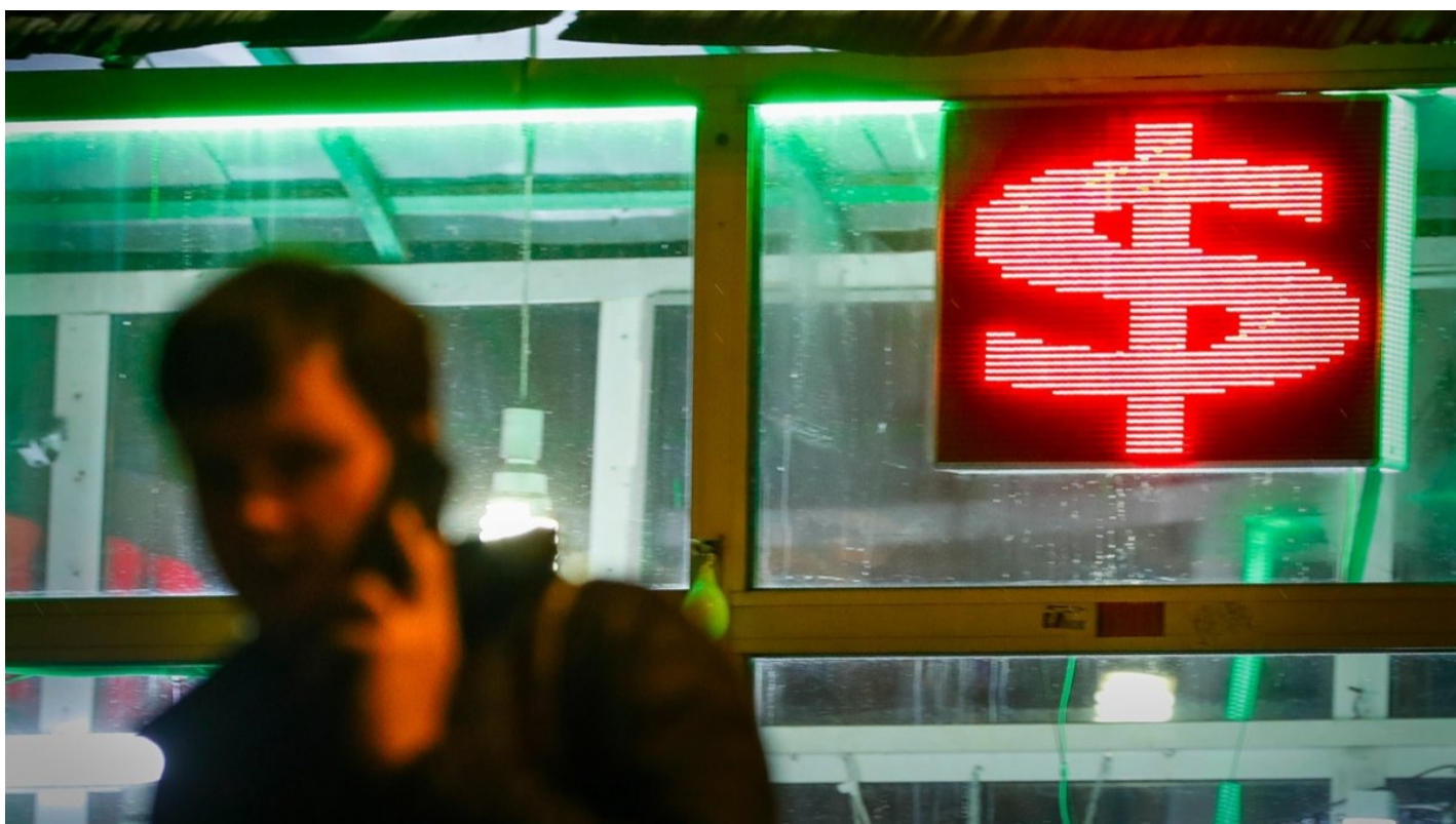
Знак доллара США на обменном пункте в Москве, 4 октября 2023 года.

Как изменится курс рубля, сохранятся ли вклады и можно ли будет купить валюту в РФ, отвечают экономисты