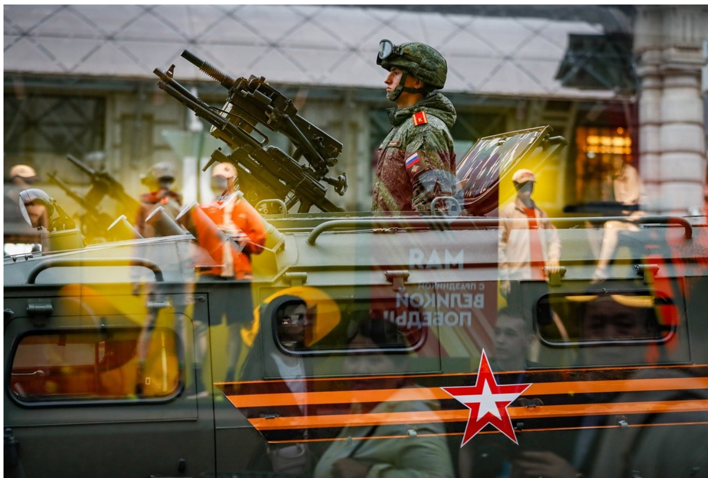
Российский военнослужащий среди отражений в окне во время репетиции военного парада в преддверии празднования Дня Победы в центре Москвы, 26 апреля 2024 года.

— Потому что люди, не ровен час, разбогатеют, а потом и думать начнут?