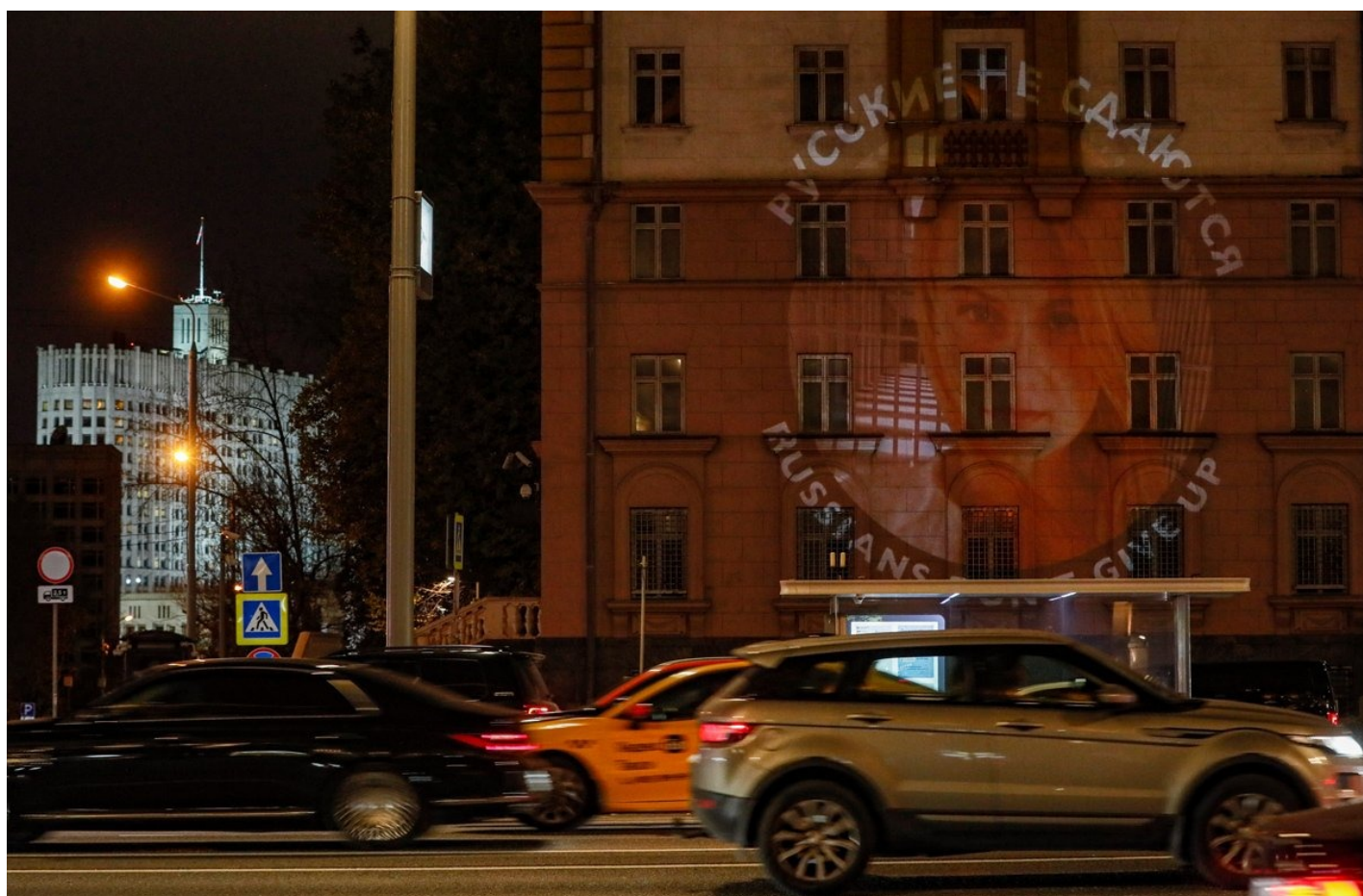
Автомобили проезжают мимо проекции с изображением портрета Марии Бутиной и надписью «Русские не сдаются» на здании американского посольства в Москве, Россия, 25 октября 2023 года.

Но вряд ли такое возможно. Потому что мы с вами хорошо представляем европейских и американских чиновников, они вообще обратного хода не дают никогда.