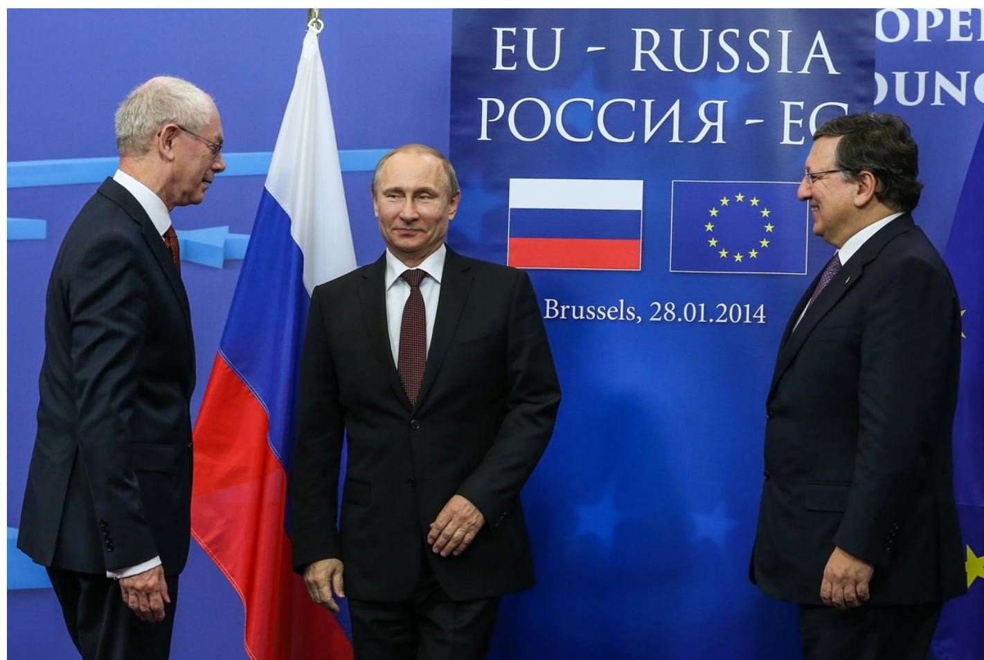
Владимир Путин (в центре) с председателем Европейского совета Херманом Ван Ромпеем (слева) и председателем Комиссии ЕС Жозе Мануэлем Баррозу (справа) перед началом встречи в штаб-квартире Европейского совета в Брюсселе, Бельгия, 28 января 2014 года.

такие же, как вы», это встречало непонимание, и были все основания для такого непонимания.