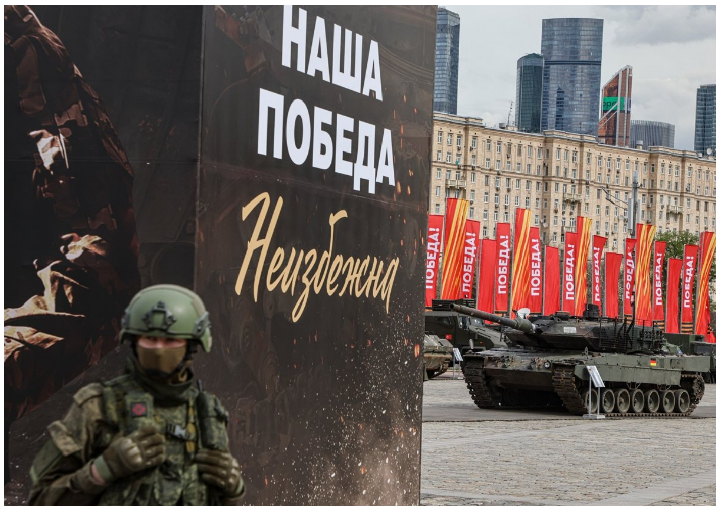
Российский военнослужащий на фоне плаката с надписью «Наша победа неизбежна» и немецкого танка Leopard 2A6, захваченным российскими войсками в Украине, во время подготовки к выставке на Поклонной горе в Москве, 28 апреля 2024 года.

— Страна — это же всё-таки не домохозяйство. Это же не работает так, что сколько на рынке денег получил — столько на войну потратил. «Источники средств для войны» не равно «приток валюты от экспорта минут отток». Но в целом при прочих равных да, безусловно, за счет этих санкций возможности вести войну увеличиваются.